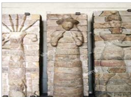
تصویر ۱۵: گاو-انسان، معبد اینشوشینک، موزه لوور (URL: 15)

نوع وحشی بز، مرتبط با خدای حاصلخیزی در شوش بوده است (شوالیه و گریبان، ۱۳۷۹: ۹۲) که در بسیاری از سفالینه‌های مکشوف از آنجا، در میان شاخ آن، نمادهایی مانند خورشید قرار دارد. این حیوان به‌شکل‌های گوناگون در بسیاری از آثار هنری دوره ایلام به‌کار رفته است؛ مثلاً به‌عنوان بخشی از لیوان در حفريات تپه چغامیش، بزى به‌حالت ایستاده به‌صورت دسته‌کاربرد داشته است. از دوران کهن تمدن ایلام، ظروف تزیینی با شکل‌های گوناگون از قیر طبیعی به‌دست آمده‌اند؛ برای نمونه کاسه‌ای مربوط به اوایل هزاره دوم ق.م. با تزیین سر بز کوهی یافت شده که از قسمت شاخ‌هایش روی کاسه خم‌گردیده است، «در این کاسه‌ها، سلیقه هنری انتزاع‌گرای ایلامی‌ها با سبک ناتورالیستی بابلی‌ها هم‌زمان بود» (Porada, 2012). در طرف دیگر ظرف، دو بز روبروی هم و با میانجی یک درخت خرما بر زمین به‌صورت نشسته حک شده‌اند که این فرم نقش‌مایه، در سنگ یادمانی از ایلام کهن نیز