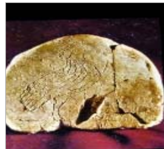
تصویر ۱۲: عقاب-شیر ایلامی، سنگ صابون (URL:12)