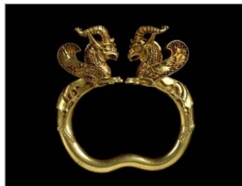
تصویر ۱۳: دست‌بند با نقش گریفین، قرن ۴ و ۵ ق.م. هخامنشی، گنجینه جیحون (URL:13)