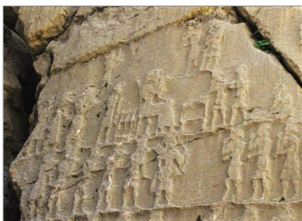
تصویر ۵: مراسم تشریفاتی شبیه مراسم درباری هخامنشی با اهدای هبه. (URL: 5)

در نقش برجسته با عظمتی از دوران ایلام بر روی تخته‌سنگ سه گوشه‌ای در دشت مال امیر (در صد کیلومتری شمال شرق ایذه)، صحنه‌ای مربوط به نیایش با محوریت حمل مجسمه خدا یا شاه به معابد وجود دارد که در آن حمل مجسمه بزرگی از رب‌النوع روی تخت روان صورت می‌گیرد (تصویر ۶). این مجسمه از دیگر افراد حاضر در صحنه بزرگ‌تر است. در سمت چپ و پشت سر مجسمه، چهار ردیف نیایشگر کوچک‌تر از مجسمه و سرانشان دیده می‌شود که با دو خط مشخص، از هم جدا و به سه گروه تقسیم شده‌اند. از شوش در دوره ایلام، مهری به دست آمده است که مجسمه یکی از رب‌النوع‌ها بر روی تخت روانی حمل می‌شود (صراف، 1387: ۹۱). در کول فرح، نقش برجسته دیگری وجود دارد که نشان‌دهنده صحنه مراسم قربانی شش گاو کوهان‌دار است. در این تصویر، پرسپکتیو