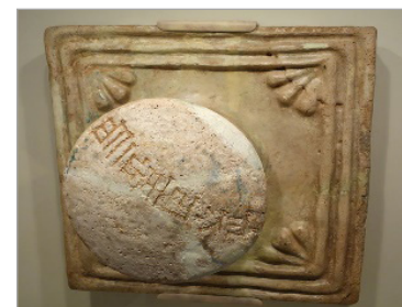
تصویر ۳: پلاک دستگیره‌دار با نوشته سلطنتی اونتاش‌گال، از محوطه چغازمبیل، ایلام میانی، ۱۲۵۰ ق.م. (URL: 3)