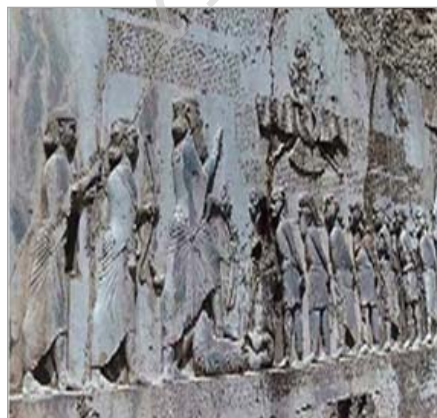
تصویر ۹. کتیبه و سنگ‌نگاره داریوش اول، بیستون (URL: 9)

سنت ترکیب نوشته و تصویر که در صخره‌نگاری‌ها و آجرهای قالبی ایلام و سنگ‌نگاره‌های هخامنشی وجود دارد، تا مدت‌های مدید فضای هنری ایران را همراهی کرده است، به طوری که در ادوار بعد در نقاشی نسخه‌های مصور نیز این سنت ادامه می‌یابد. استفاده از خط‌نوشته همراه تصویر، گویای بی‌اعتمادی به تصویر برای بازگویی کل روایت مربوط به یک صحنه است؛ با این علم که پارس‌ها در نقش برجسته‌ها و مهرهای خود به دلیل ترس از نامشخص بودن نام پادشاه و نادیده گرفتن پیروزی‌ها یا بیان کارهای مهم ایشان، استلزام وجود همراهی با این سنت را حس می‌کردند. در پاسارگاد محل استقرار کاخ‌های کوروش، نیز سه نوع کتیبه تشخیص داده شده است. این کتیبه‌ها به سه زبان ایلامی، بابلی و فرس قدیمی (میخی) و «دنباله سنی است که در ایلام وجود داشته و بهترین نمونه آن، زیگورات چغازمبیل است» (گیرشمن، ۱۳۴۶: ۱۳۳). از چهار گوردخمه هخامنشی در نقش رستم، تنها آرامگاه داریوش دارای کتیبه است. دو سنگ‌نوشته، در دو طرف ورودی آرامگاه دیده شده است که در آن با خط میخی و به سه زبان پارسی، ایلامی و بابلی به شرح معرفی داریوش، مراکز تحت حکومت، فعالیت‌ها و