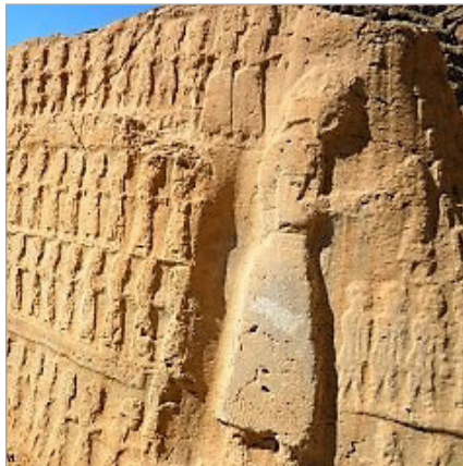
تصویر ۶: نقش برجسته کول فرح، احتمالاً ایلام نو (URL: 6)

نقوش برجسته هخامنشی، نقش‌مایه آتشدان و تقدس آتش، حاصل باورهای آیینی است؛ برای نمونه در نقش برجسته بار عام داریوش، دو آتشدان و نیز در بالای گوردخمه داریوش، اردشیر دوم آتشدانی بزرگ روبروی نقش برجسته پادشاه قرار دارد. در نمونه مهرهای استوانه‌ای هخامنشی نیز صحنه‌هایی مشتمل بر پادشاه و آتشدان نشان داده شده است. رابطه بین تمدن ایلام و هخامنشی با توجه به کلیاتی چون حضور