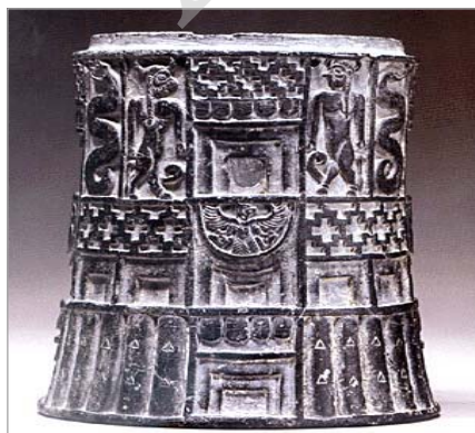
تصویر ۱۷: نقش شاهین بر سر در یک عمارت کاخ‌مانند به‌همراه مار و انسان تلفیقی، ایلام (URL:17)

شاهین، نماد خورشید و در تمدن‌های کهن ایران وجود داشته است. روی استوانه‌ای از قیر طبیعی مربوط به ایلام