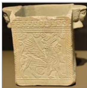
تصویر ۱۴: گریفین، بدل چینی، ایلام میانه (URL:14)

قدیمی‌ترین شیر با صورت انسان (اسفنکس) را از آن مصری‌ها دانسته‌اند؛ برای اولین بار در خاورمیانه در تمدن