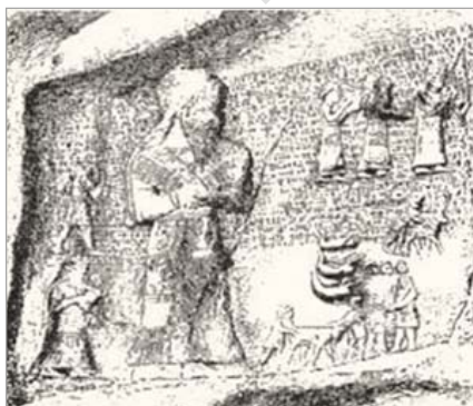
تصویر ۸. مراسم قربانی همراه موسیقی برای هانی با مشایعت کوتور-کاهن، کول فرح (URL: 8)

مقامی به‌واسطه تمایز اندازه بین ۶ نفر موجود در اطراف پادشاه برجسته می‌شود. در کل، نقش برجسته‌های کول فرح و مال امیر، نشان از یک مراسم نمایشی و آیینی دارند که به‌صورت دوره‌ای برگزار می‌شود؛ از جمله این مراسم آیینی می‌توان به اعیاد آفرینش و باززایی پاییزه و بهاره جشن بانوی پایتخت ۱۳ ، توگ ۱۴ و جشن بانوی ارگ اشاره کرد. در تخت جمشید در گوردخمه اردشیر (دوم یا سوم) و نیز در راهروی غربی کاخ آپادانا در همان جا و نیز گوردخمه‌های شاهان هخامنشی ۱۵ در نقش رستم، توالی انسان‌های حامل تخت و نیز پرسپکتیو مقامی دیده می‌شود. در نقوش برجسته گوردخمه اردشیر (دوم یا سوم) در تخت جمشید، تعداد ۱۴ نفر با قامتی کوتاه‌تر از پادشاه، تخت او را بر دو دست دارند. تخت شاهی داریوش (تصویر ۷) در تخت جمشید و خشایارشا در مجموعه نقش رستم با پرده و سایه‌بان بالای آن، نیز توسط ۲۸ نفر نگهداری یا جابه‌جا می‌شود. این سنت گرچه در ایلام نیز دیده می‌شود، اما تعداد افرادی که تخت‌های پادشاهان هخامنشی را بر دست می‌برند زیادتر است. در تخت جمشید به‌جای حمل مجسمه رب‌النوع در ایلام، خود شاه بر روی تخت روان قرار دارد و شاید از همین‌جا بتوان تغییر جایگاه و کاربرد رابطه خدا و شاه از دوره ایلام به هخامنشی را تفسیر کرد.