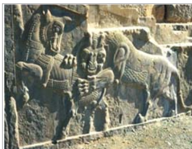
تصویر ۱۱: مبارزه شیر و گاو، پلکان شرقی کاخ داریوش (URL: 11)

در فرهنگ‌ها و اسطوره‌های ملل مختلف، گریفین، سر عقاب و بدن شیر دارد. گاهی تاج‌دار و گاهی با پای چنگین ترسیم می‌شود. جیمز هال آن را برای نخستین بار به تمدن مصر نسبت می‌دهد (هال، ۱۳۸۰: ۶۵)، اما والتر هینتس عقاب-شیر را یک ابداع اصیل ایلامی می‌داند و معتقد است در بین‌النهرین ناشناخته ماند، اما در مصر پذیرفته شد ۲۰ (هینتس،