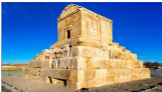
تصویر ۲: مقبره کوروش، پاسارگاد (URL: 2)

در هنر معماری هخامنشی، باغ‌آرایی نقش مهمی داشته است. می‌توان وجود چهارباغ مرکزی یا باغ سلطنتی را از آثار مهم پاسارگاد به حساب آورد. آب‌گذرها و حوضچه‌های سنگی موجود در محل، آبیاری چهارباغ را میسر می‌کرده است. ایجاد باغ‌های شاهی در پاسارگاد احتمالاً بعد از مرگ کوروش صورت گرفته و حتی تا قرن چهارم پیش از میلاد نیز مورد استفاده قرار گرفته است. استروناخ آن را به‌اواخر دوره هخامنشی و یا پس از آن نسبت می‌دهد (فیروزمندی، ۱۳۸۵: ۸۳).