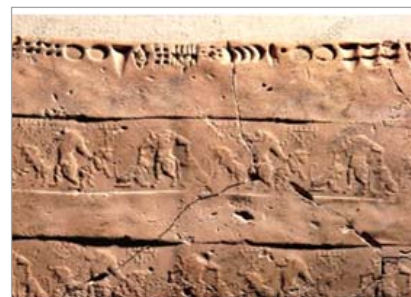
تصویر ۱۰: غلبه شیر و گاو بر هم‌دیگر، اثر مهر پروتو عیلامی، شوش، ۲۹۰۰ ق.م. (URL: 10)