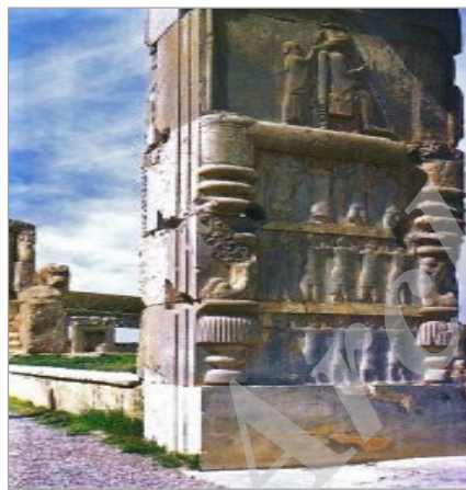
تصویر ۷: تخت شاهی، تخت جمشید (URL: 7)