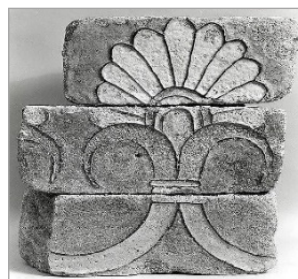
تصویر ۴: آجر لعاب‌دار، دوره هخامنشی، قرن ۵ و ۶ ق.م.، شوش، سرامیک و لعاب (URL: 4)