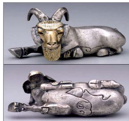
تصویر ۱۶: بز کوهی، پروتو عیلامی، شوش، حدود ۳۱۰۰ تا ۲۹۰۰ ق.م. (URL:16)