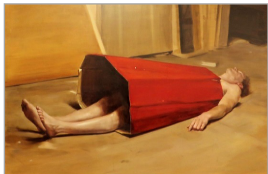
تصویر ۱۱. لباس ابلیس، ۲۰۱۱، cm 203*367 (URL: 3)

معاصر، همان قطعیت و عدم قطعیت است که بیننده را به تردید و دودلی می‌اندازد.