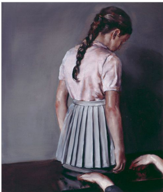
تصویر ۶. دامن، ۲۰۰۵، 60*70 cm (URL: 3)

بورمانس در نمایشگاه دو سالانه برلین (۲۰۰۶)، فیلمی را بر روی یک صفحه LCD کوچک نشان داد که آن را مانند یک تابلو، قاب گرفته بود. این فیلم بر اساس یک طراحی که