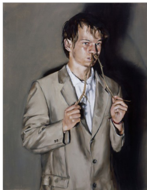
تصویر ۵. شکار اسب، ۲۰۰۵، 100*130 cm (URL: 3)