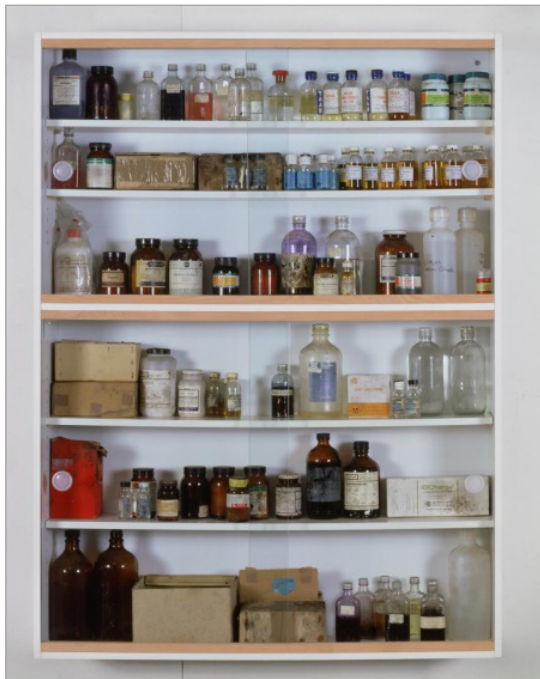
تصویر ۲. می‌خواهم خودم باشم، ۱۹۹۱-۱۹۹۰، (URL: 1) 1372 x 1016 x 229 mm

دیده می‌شود. هرست از کودکی درگیر مفهوم مرگ است و به مرگ فکر می‌کند؛ چون مادر بزرگ او از کودکی با او از مرگ صحبت می‌کرده است. از دیگر مجموعه‌هایی که هرست ارائه داده، مجموعه "قفس‌های دارو" است. هرست در این زمان، به نقش دارو در زندگی انسان و مصرف بیش از اندازه آن فکر می‌کند. او در قالبی پارادوکسی، زیبایی‌شناسی مدرن را با کالایی برآمده از بیماری بشر ادغام می‌کند. در این دوگانگی بین امر زیبا و چیزی که با زیبایی در تناقض است، یک اثر ترکیبی ایجاد می‌کند. در آن زمان، این کار تبدیل به جریانی شد که به زیبایی‌شناسی طبی و پزشکی کشیده شد. در این اثر