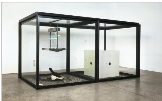
تصویر ۱. هزار سال، ۱۹۹۰، 2075 x 4000 x 2150 mm (URL: 1)

چیزهایی که در آب نمک قرار می‌داد مثل ماهی، گوسفند، گاو، گوساله، کوسه و غیره که عدم امکان فیزیکی مرگ در ذهن یک فرد زنده ۲۳ (۱۹۹۱) (تصویر ۳) نام گرفته بود، با قدرت خواست بشر برای عشق، زیبایی، مرگ و ترس از آنها و عجز او در رویارویی با آنها مرتبط بود» (آرچر، ۱۳۸۸: ۲۰۴). کوسه هرست با عنوان "امکان‌ناپذیری فیزیکی مرگ در ذهن کسی که زنده است"، شاخص‌ترین اثر در میان گروه جنبش هنرمندان جوان انگلیس (YBA) است و توسط ساچی ۲۴ خریداری و در گالری ساچی نگهداری می‌شود. این اثر، با ابعاد بسیار بزرگ ساخته شده که هنرمند در آن به‌دنبال مرز میان ترس و خلاف ترس، مرز بین مرگ و زندگی و درک زیباشناختی از مرگ و زندگی است. هرست به‌دنبال نشان دادن وحشت نیست، بلکه وحشت برای او یک ابزار است. نکته مهم در این اثر، این است که کوسه مرده است. هرست، بیننده را بر روی لبه‌ای از پارادوکس قرار می‌دهد