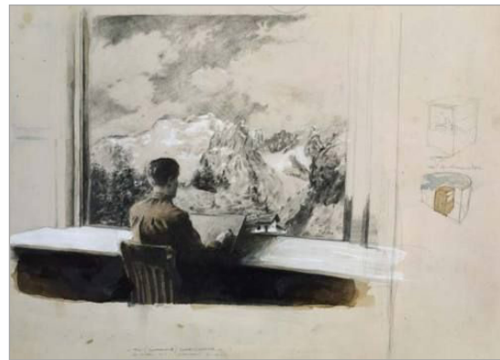
تصویر ۷. جادوگر، ۲۰۰۲، 16.7 * 24 cm (URL: 3)