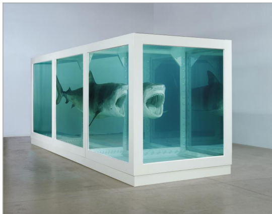
تصویر ۳. امکان‌پذیری فیزیکی مرگ در ذهن کسی که زنده است (URL: 1) 2.1 * 5.2 * 2.1 m، ۱۹۹۱