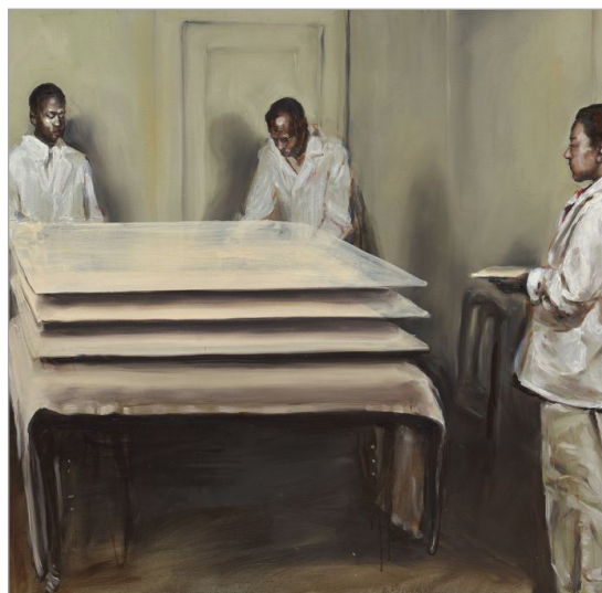
تصویر ۱۰. یکی یکی، ۲۰۰۳، cm 85*100 (URL: 3)