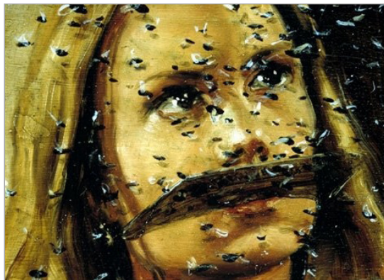
تصویر ۸. هنرپیشه آمریکایی، ۲۰۰۱، 20*28 cm (URL: 3)