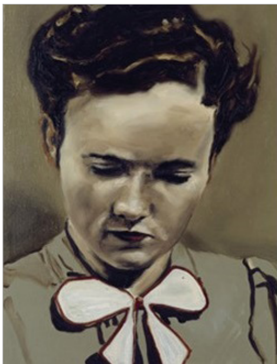
تصویر ۹. تشویش، ۲۰۰۱، cm 65*50 (URL: 3)