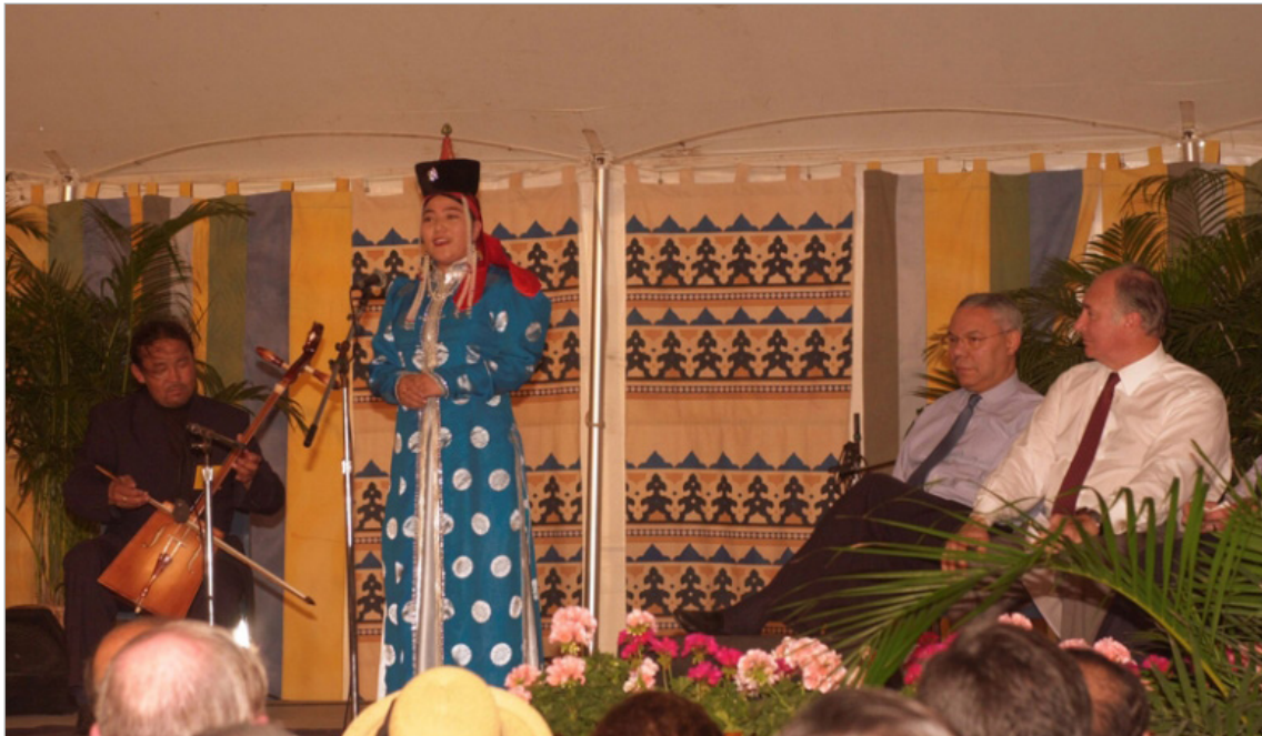
تصویر ۲. افتتاحیه مراسم جاده ابریشم در سال ۲۰۰۲ با حضور کالین پاول و آقا خان در واشنگتن (URL: 6)