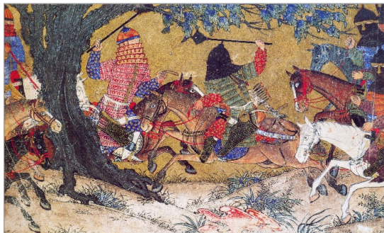
تصویر ۱۰. جنگ اردشیر با بهمن پسر اردوان، شاهنامه بزرگ مغولی، ۷۲۵-۷۳۵ هجری، انستیتوی هنر دیتروید، (Sims, 2002: ۳۵.۵۴) fig 14)