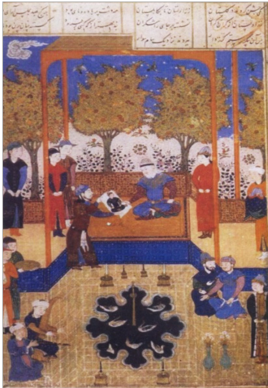
تصویر ۱۲. نشان دادن تصویر رستم به سام، شاهنامه محمد جوکی به سال ۸۴۳ هجری، انجمن سلطنتی آسیایی لندن، MS 239, fol.30v (آزند، ۱۳۸۷: ۱۷۳)

از این رو، عموم شاهنامه‌های ایلخانی واجد نوعی سبک واحد ملی و متمرکز هستند که استثنای این امر، شاهنامه کبیر مغولی بوده که بسیار متفاوت و پرمطراق است؛ حال آن که