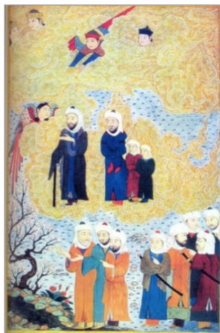
تصویر ۶: امامان در عرصه قیامت، گلچین اسکندر سلطان به سال ۸۱۳ هجری، شیراز، مجموعه گلبنکیان لیسبن، L.A. 161, pp.523-524 (شایسته‌فر، ۱۳۸۴: ۸۴ و ۸۵)