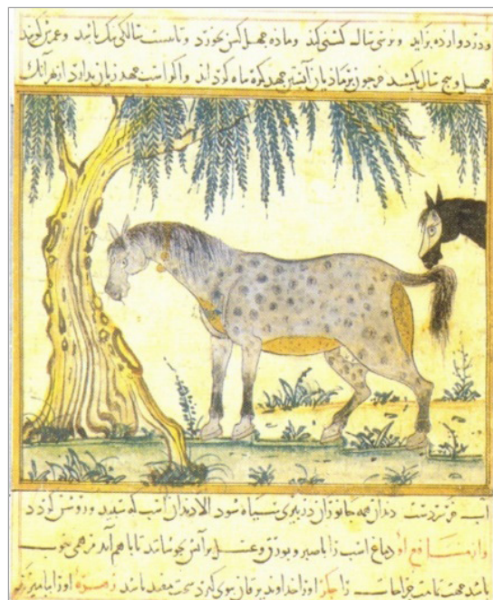
تصویر ۷. اسب، منافع‌الحیوان، مکتب ایلخانی، کتابخانه پیرپونت مورگان، نیویورک، MS M.500, fol.28 (Grabar, 2000: fig. 12)