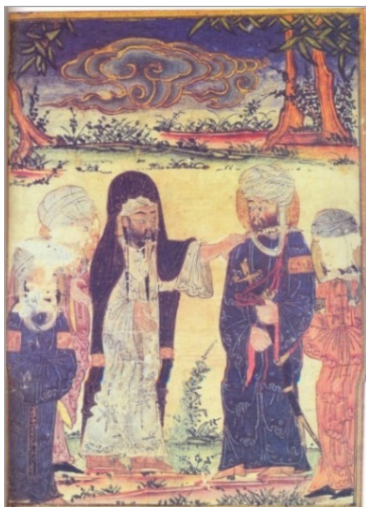
تصویر ۲. غدیر خم، آثارالباقیه بیرونی، ۷۰۷ هجری، دانشگاه ادینبورو، Arab 161, fol. 162r MS (Hillenbrand, 2000: 141)

شد (Okasha, 1981: 45-46). در نسخه آثارالباقیه به سال ۷۰۷ هجری دانشگاه ادینبورو (شماره دسترسی: Arab 161 MS)، دو نگاره با موضوعی شیعی به تصویر درآمده؛ نگاره‌ای با موضوع غدیر خم که در آن حضرت علی (ع) در کنار پیامبر تصویر شده است (تصویر ۲) (مهدی‌زاده، ۱۳۹۶: ۱۵). از همین نسخه، نگاره دیگری با عنوان مباحله که واقعه‌ای است که شیعیان برای بیان شأن والای امامان خود به آن استناد می‌کنند، ترسیم شده که در آن، پیامبر در کنار حضرت علی، حضرت فاطمه و امام حسن و امام حسین (ع) ایستاده است (MS Arab 161, fol. 161r; Hillenbrand, 2000: 142). مهدی‌زاده، ۱۳۹۶: ۱۶). دو تصویر فوق به‌گونه‌ای ترسیم شده که تقدس موضوعات را نشان دهند. اندازه بزرگ‌تر آنها نسبت به سایر تصاویر، رنگ‌های نیلی تند و نارنجی درخشان و سیاه که تا قبل از این در نگاره‌ها به کار برده نمی‌شد، ترسیم آنها در دو صفحه انتهایی یا خاتمه کتاب، ترسیم دو صفحه با موضوع مشابه در پی یکدیگر که بارها در این نسخه تکرار شده و نهایتاً ترسیم هم‌زمان زمین و آسمان که بیان نمادین بهشت در هر جایی است که این دو شخصیت حضور دارند، موجب تأثیرگذاری بیشتر این دو نگاره بر روی مخاطب می‌شوند (Hillenbrand, 2000: 133). البته در این نگاره‌ها، مقام والای این بزرگان آن‌گونه که در دین اسلام مطرح است، در نظر گرفته نشده و منعکس‌کننده جایگاه قدسی آنها نیست. در نسخه تاریخ طبری محفوظ در گالری هنر فریر (شماره دسترسی: F1930.21.1-2)، شاهد تصاویر مذهبی هستیم؛ مثلاً تصویری با عنوان انتخاب عثمان به خلافت.