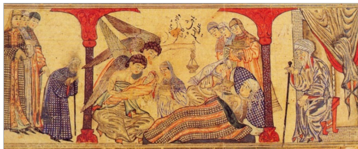
تصویر ۱. تولد حضرت محمد (ص)، جامع‌التواریخ، دانشگاه ادینبورو، MS Arab 20, f.42r (Hillenbrand, 2000: 137)

نسخه آثارالباقیه بیرونی که نشانی از مکان تهیه یا مالک اصلی آن یافت نمی‌شود، اما سبک نقاشی‌های آن، بیانگر تعلق این نسخه به عهد ایلخانان است (James, 1998: 4-5). این نسخه به‌دستور اولجایتو که شیعه‌مذهب بود، کتابت و مصور