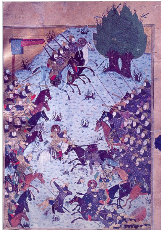
تصویر ۱۱. نبرد ایران و توران، شاهنامه بایسنغری به سال ۸۳۳ هجری، کتابخانه کاخ گلستان تهران، 355 MS 61, p. (Sims, 2002: fig 8)