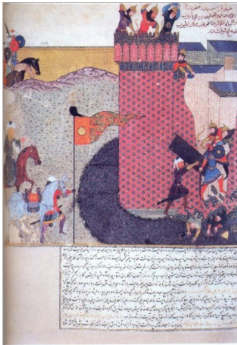
تصویر ۴. علی در جنگ خیبر، کلیات حافظ ابرو، توپقاپی‌سرای استانبول، B.282, fol.169a (شایسته‌فر، ۱۳۸۴: ۸۰)

ملی پاریس (شماره دسترسی: Suppl. turc 190) نگهداری می‌شود (شمسی و همکار، ۱۳۸۵: ۸۶). نکته جالب درباره این نسخه آن است که علاوه بر نمایش واقعه معراج پیامبر، در آن، نگاره‌های متفاوت و دیدنی وجود داشته که نشان‌دهنده جزای گناهکارانی چون خورنده مال یتیم، شراب‌خواران، زناکاران، کم‌فروشان و رباخوران بوده، هم‌چنین تصاویری از کافران و خرافاتیان و غیره با اسلوب سیاه‌قلم و به‌شکلی هولناک ترسیم شده‌اند (آزند، ۱۳۸۷: تصویر صفحه ۱۶۳؛ بلر و همکار، ۱۳۸۳: ۹۶). شاهرخ به‌دلیل توجه افراطی به دین اسلام، سفارش چنین نسخه‌ای را داده بود. در این زمان به‌غیر از معراج‌نامه میرحیدر، در نسخ دیگری نیز تصاویری با مضمون مذهبی دیده شده؛ در نسخه کلیات حافظ ابرو به‌سال ۸۱۹ هجری موجود در توپقاپی‌سرای استانبول (شماره دسترسی: B.282 (Adamova, 2015: 160) دو تصویر مذهبی وجود دارند؛ تصویر اول مربوط به نقش امام علی (ع) در جنگ خیبر است (تصویر ۴) و تصویر دوم، همراهی امام علی (ع) با پیامبر را در مسجدالحرام نشان می‌دهد (شایسته‌فر، ۱۳۸۴: تصویر صفحه ۸۱؛ ۱۳۸۵: ۱۰۸). نسخه‌ای که دارای مجموعه داستان‌ها بوده و به‌سفارش شاهرخ در سال ۸۳۰ هجری در هرات تدارک دیده شده بود، شامل نگاره‌ای با عنوان داستان قربانی شدن حضرت اسماعیل توسط حضرت ابراهیم است