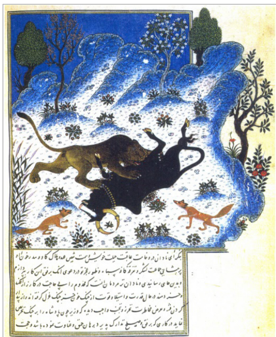
تصویر ۸. حمله شیر به گاو، کلیله و دمنه، موزه توپقاپی سرای استانبول 1022, fol.46v (اژند، ۱۳۸۷: ۱۵۶)

در عهد ابوسعید ایلخانی، نسخه‌ای از کلیله و دمنه که به نظر می‌رسد کار احمد موسی بوده و امروزه در کتابخانه دانشگاه استانبول (شماره دسترسی: H2160) نگهداری می‌شود، تهیه شده است ۷ (ره‌نورد، ۱۳۸۶: ۲۶). نقاشی‌های این نسخه، نشان‌دهنده مناظر متنوعی از طبیعت و صحنه‌های بسیاری از حیوانات بوده (بلر و همکار، ۱۳۸۳: ۴۹) و حاوی متنی است شامل حکایاتی از زبان حیوانات که در کنار تصاویر