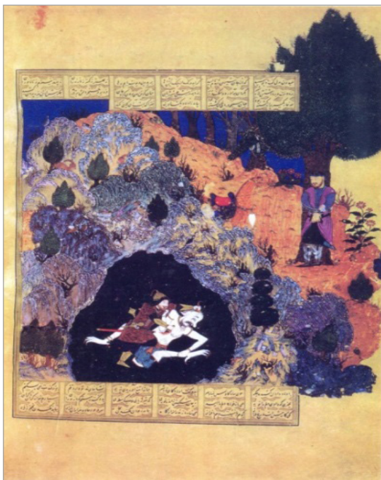
تصویر ۹. رستم و دیو سپید، شاهنامه بایسنغری به سال ۸۲۳ هجری، کتابخانه کاخ گلستان تهران، MS 61, p.48 (آزند ۱۳۸۷: ۱۴۶)

انواع موضوعات و پیشرفت چشمگیر نقاشی در عصر تیموری، عجیب به نظر نمی‌رسد. مضمون حیوانات در دوره ایلخانی، در نسخه کلیله و دمنه ابوسعیدی، عجایب‌المخلوقات قزوینی، منافع‌الحیوان ابن‌بختیشوع که نسخه‌ای دایره‌المعارف‌گونه درباره حیوانات بوده و نسخی هم‌چون شاهنامه دموت، که اگر چه اختصاصاً به این مضمون نپرداخته، اما شامل صحنه‌های شکار هستند، نمود یافته است. در عصر تیموری نیز کلیله و دمنه بایسنغری موجود در توپقاپی سرای استانبول و کلیله و دمنه کاخ گلستان، مهم‌ترین نسخه‌هایی بوده که با مضمون حیوانات استنساخ شدند. نسخه عجایب‌المخلوقات که نه تنها شامل ترسیم حیوانات معمول می‌شود، بلکه حیوانات خیالی، افسانه‌ای و دور از ذهن را نیز در خود دارد، از جمله موضوعات دیگری بوده که ذیل این مضمون مصور شده است. صحنه‌های شکار حیوانات و درگیری حیوان و انسان، دسته دیگری بوده که به‌نمایش مضمون حیوانات در این دوره پرداخته‌اند. در آخر، نگاره‌های تک‌برگی و نسخی چون منطق‌الطیر عطار که به ترسیم پرندگان و گاه حیواناتی نامتعارف چون گربه و سگ می‌پرداخته، در گروه تصاویر با مضمون حیوانات قرار می‌گیرند؛ چنین تصاویری تحت تأثیر نقاشی چینی و به‌صورت تک‌برگی، از قرن نهم به نقاشی ایران ورود یافت. در واقع این مقوله، وجه تمایز بارز عصر تیموری و ایلخانی در این مضمون است.