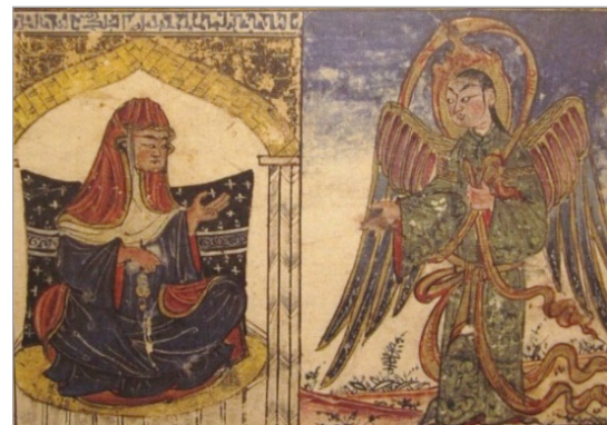
تصویر ۳. بشارت میلاد مسیح (ع)، آثارالباقیه، ۷۰۷ هجری، دانشگاه ادینبورو، (URL: 1) Ms Arab 161, p.166

بر خلاف دوره ایلخانی، مضامین مذهبی عهد تیموریان عمدتاً اختصاص به موضوعات اسلامی دارند. هر چند در برخی تصاویر این دوره نیز اشاراتی به پیامبران پیش از حضرت محمد شده، اغلب مضامین دینی، به موضوع پیامبر اسلام و سیره ایشان، حضور ائمه مخصوصاً حضرت علی (ع) و رویدادهای مربوط به ایشان و وقایع دینی، اختصاص یافته‌اند. در زمان دومین پادشاه تیموری، شاهرخ میرزا، معراج‌نامه دیگری معروف به معراج‌نامه میرحیدر به‌سال ۸۴۰-۸۳۹ هجری در هرات مصور شده است که امروزه در کتابخانه