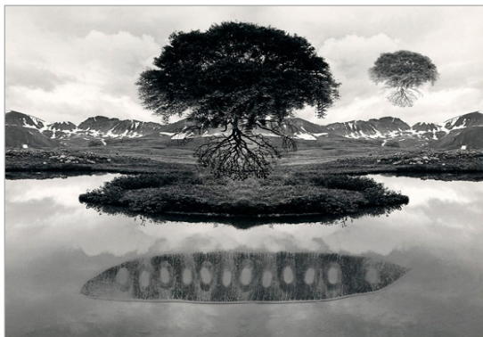
تصویر ۱. بدون عنوان، جری اولزمن، ۱۹۶۵ (URL: 1)

لوکاس ساماراس (۱۹۳۶)، هنرمندی است که در دهه هفتاد میلادی، تصاویر اکسپرسیونیستی سرشار از آشفتگی، شرارت و لذت‌طلبی خلاقانه که خودآگاهی بالایی در آنها موج می‌زند را به وجود آورده است. وی به واسطه هنر عکاسی و با گرفتن پولارویدهایی از خود در زوایای عجیب و غیرمعمول با عنوان "اتو پولاروید" ۱۰ ، انرژی روانی خویش را با کاتارسیس مهار کرده و تبدیل به خودنگاره‌هایی وحشت‌زا، معوج و تحریف‌شده می‌نماید که وی را قادر ساخته تا با نفوذ در ذهن مخاطب، هم مشاهده‌گر باشد و هم مشاهده‌شونده. این نفوذ، مملو از اشارات تلویحی به روابط جنسی، زخم زدن، درمان‌های روان‌کاوانه و فرآیند تولید هنری است (گراندبرگ، ۱۳۸۹: ۱۵۳). در مجموعه خودنگاره‌های مشهور اس ایکس ۱۱ با عنوان "دگردیسی‌های عکاسانه" ۱۲ که رویکردی روان‌شناختی دارد، چهره و بدن ساماراس، در معرض تغییرات ناخوشایندی قرار