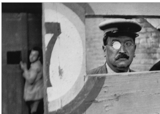
تصویر ۴. میدان مسابقات گاوبازی والنسیا، هنری کارتیه برسون، اسپانیا، 1933 (URL: 4)

این عکس، در لحظه‌ای مشخص گرفته شده؛ به‌طوری که بازتاب نور، یکی از شیشه‌های عینک را کاملاً به شکل دایره‌ای سفیدرنگ تبدیل کرده است. بیننده‌ای که این صحنه گاوبازی را از میان عینک نورانی تماشا می‌کند، به یاد موقعیت عکاس در صحنه افتاده که از درون منظره‌یاب دوربین خود، صحنه را می‌نگریسته است. نه تنها تصویر به طرز فوق‌العاده‌ای ساخته و پرداخته شده است، به‌علاوه به‌اختصار، موقعیت صحنه را هم به‌طور نمادین نشان می‌دهد؛ بازی نگاه‌ها، تنش صحنه گاوبازی، فضای نامحدود، تخمین حدود فاصله و ... همه چیز در این تصویر حضور دارد از جمله خود عکاس (شرو، ۱۳۹۱: ۱۳۳). همچنین، مکان‌های بسیاری در این تصویر وجود دارند که در آنها فضای بازنمودی، بر ملاکننده فضای ارجاعی است؛ دری که عدد هفت روی آن نوشته شده، در و یا منفذی روی دیوار در محدوده ساختمان، منفذ قابل‌رؤیت