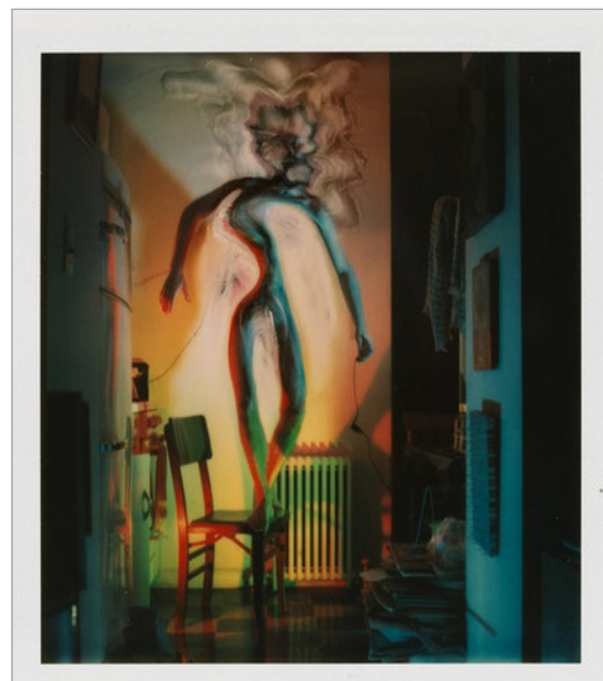
تصویر ۲. دگر دیسی های عکاسانه، لوکاس ساماراس، 1974 (URL: 2)