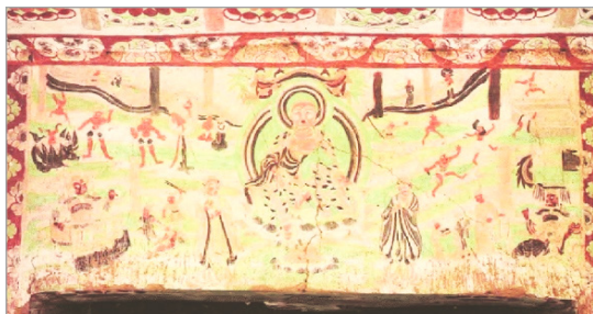
تصویر ۳. در جهنم با مسیر تولد دوباره، نقاشی روی دیوار، Yulin شرقی، غار ۳۳ (Schmid, 2008: 309)

در دیگر نقاشی‌های غارهای یولینگ سی و هشت، مجازات گناهکاران را در مقابل پادشاهانی که روی صندلی‌های بلند فرمانروایی نشسته و اعمال گناهکاران را در کارنامه‌ها ثبت می‌کنند، مشاهده می‌کنیم. ارواح مردگان در مقابل پادشاهان، کانگوهای چوبی بلند پوشیده و نگهبانان زن در مقابل هر پادشاه، کتاب‌های دایره‌ای شکل را گشوده و حکم گناهکاران را می‌خوانند. همچنین، دیواره‌های غارهای دیگری در منطقه تورفان به‌ویژه در بزکلیک به چشم می‌خورند که در آنها، یک نقاشی بزرگ و پیچیده، کتیبه‌های ایغور در مورد "شش جاده به تناسخ" ۲۱ را توصیف می‌کند (Gruber, 2008: 321) (تصاویر ۴ و ۵ و ۶). این نقاشی، شش جاده را در بخش‌های جداگانه نمایش می‌دهد که در آنها، گناهکاران تحت اعمال انواع شکنجه قرار می‌گیرند. مجازات آنان این‌گونه است؛ شیاطین با موهای فر، به زور مایع جوشان را به خورد گناهکاران می‌دهند. گناهکاران توسط شیاطین کشته شده، در حالی که از شراره‌های شعله‌ور فرار می‌کنند. شیاطین، گناهکاران را با نیزه می‌زنند، در حالی که یک شیطان با سر گاو، دیگ مایع با مواد مذاب را تکان می‌دهد. بدن برهنه گناهکاران، به یک کوره قیف‌مانند تبدیل می‌شود و گناهکاران بر یک تخته‌سنگ خوابیده و منتظر مجازات هستند؛ همان‌طور که دیگر مجرمان به جایگاه شکنجه خود نزدیک شده و توسط خزندگانی همچون مارها عذاب می‌بینند (تصاویر ۶ و ۷ و ۸). بسیاری از این شکنجه‌ها، به دیزانگ و کتاب مقدس ده پادشاه می‌رسند. موضوع سه‌گانه مرگ، قضاوت و مجازات فیزیکی در هر سه نقاشی دیواری غارهای دونهوانگ، یولین و بزکلیک، دیدگاه غالب موضوعات و نقاشی‌های چینی و آسیای میانه قرن نهم تا دوازدهم را اطلاع می‌دهد که مرتبط با روز قضاوت و سفر روح به برزخ است.