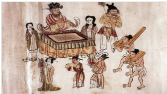
تصویر ۲. جزئی از تصویر ده پادشاه (پادشاهان جهنم در پشت میزهای خود با مجازات‌های مختلف). غار شماره ۱۷، دونهوانگ، 900-930.mogao میلادی (URL: 2)