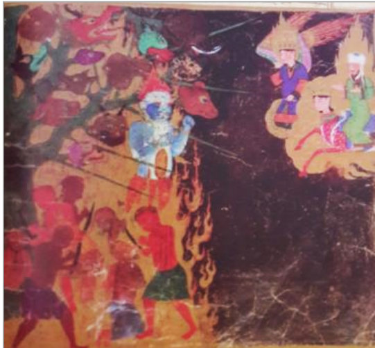
تصویر ۹. درخت دوزخی، معراج‌نامه شاهرخی (سگای، ۱۳۸۵: تصویر ۴۵)

همان‌گونه که در جدول مقایسه‌ای ۱ مشخص شد،