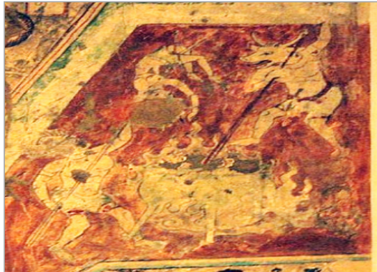
تصویر ۴. بخشی از تصویر، صحنه‌های جهنمی "شش راه برای تولد دوباره"، غارهای Bezeklik، تورفان. قرن ۱۰ تا ۱۱ میلادی (URL: 3)

کرد که مختص افراد، موقعیت و صحنه‌های خاص است. در تصاویر ۷ و ۸، انسان‌هایی را می‌بینیم که به‌طور کامل استحاله شده و یا قسمتی از آنها، از انسانی به حیوانی پیکرگردانی ۲۳ می‌کنند. پیکرگردانی، بسیاری از دیدگاه‌های شخصی، اجتماعی، فلسفی، روان‌شناسی، زبان، ادب و هنر را در شرایط و احوال گوناگون سیاسی، اجتماعی، دینی و اخلاقی مورد توجه قرار