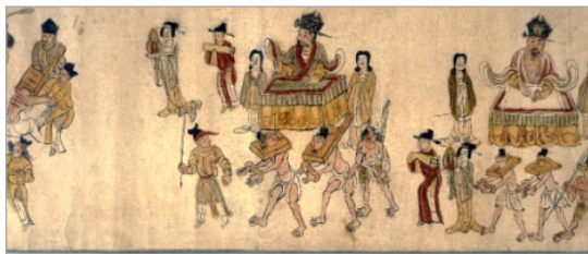
تصویر ۱. نشان دادن پادشاهان جهنم در پشت میزهای خود با مجازات‌های مختلف. غار شماره ۱۷ دونهوانگ، 900-930.mogao میلادی (URL: 2)

جزئیات نگارگری مانند کانگو/بوغ، ماناکل، شیاطین شکنجه‌گر، نیزه زدن، شکنجه توسط مارها و مجازات با مایعات متعفن و مذاب که سابقه‌ای در تفسیر کتاب مقدس ده پادشاه دارند، دوم، وجود ساختار رسمی و منسجم؛ هدف اساسی در تصاویر جهنم، عمدتاً در مورد تزکیه رفتار فردی مانند عدم وجود ریاکاری، حرص، تقلب و غیره است و رفتارهایی که به جامعه آسیب می‌زنند؛ مانند عدم پیروی از دستورات قانونی، بذل اختلاف، خوردن مال یتیم، زنا، نوشیدن شراب و غیره که گویای یک هم‌بستگی نمادین و یک تطابق ناقص بین دو پیکره مطالعاتی هستند. به‌عنوان نمونه، کانگو؛ تخته‌ای بزرگ و سنگین با سوراخی در مرکز برای گردن گناهکاران، به‌عنوان نوعی مجازات بدنی استفاده می‌شود. نمایندگان تیموری از جمله غیاث‌الدین نقاش، یک بار شاهد مجازات چینی‌ها (استفاده از کانگوی چوبی) بوده که آن را این‌گونه شرح