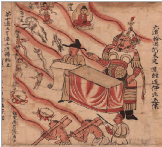
تصویر ۸. پادشاه دهم، بخشی از کتاب مقدس ده پادشاه، غار شماره ۱۷ دونهوانگ، mogao. قرن ۱۰ م، جوهر روی کاغذ (schmid, 2008: 309)