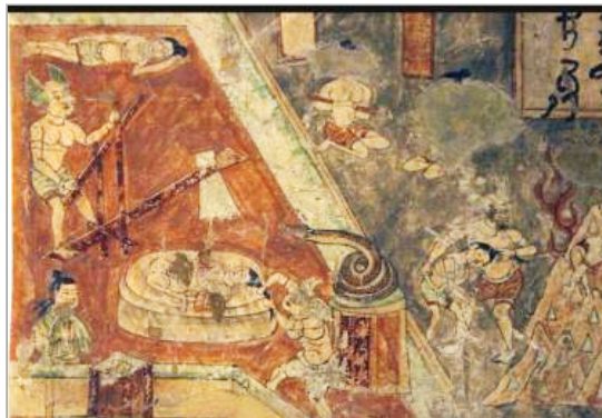
تصویر ۵. جزئی از تصویر صحنه‌های جهنمی، شش راه برای تولد دوباره نقاشی دیواری غارهای Bezeklik، تورفان. قرن ۱۰ تا ۱۱ م. (URL: 3)