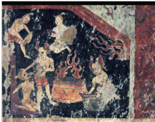
تصویر ۶. بخشی از تصویر شش راه برای تولد دوباره نقاشی دیواری غارهای Bezeklik، قرن ۱۰ تا ۱۱ م. (URL: 3)