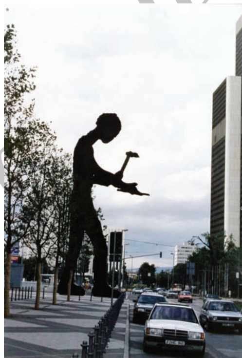
تصویر ۱: Hammering Man ، جاناتان بورفسکی، فرانکفورت

در واقع، در اغلب موارد، هنر نوگرا و زیباشناسی فرمال آن در این دوره یک «عموم» خالی شده از مفاهیم اجتماعی، اعتقادی و نظام‌های ارزشی را به‌عنوان مخاطب هنر عمومی فرض کرده و آثاری هنرمندمدار، مینیمال و ساخته شده بر اساس مفروضات و ایده‌های شخصی را به نمایش گذاشته، هویت هنر عمومی را که در تعامل با عموم بر مبنای برخی انگاره‌های مشترک به دنبال گشودن زوایای جدیدی است که می‌توان از آن زوایا ساختار اجتماعی هنر را مشاهده کرد، نادیده می‌گیرد (مرادی، ۱۳۸۶، ۸۳). این موضوع تا حدی است که «مکان‌محور بودن» [۲۰] هنر این دوره بیش از آنکه