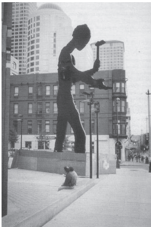
تصویر ۲: Hammering Man ، جاناتان بورفسکی، جلو ورودی موزه هنرهای سیاتل

به‌عنوان مثال، یکی از نمونه‌های بی‌توجهی هنرمندان این دوره به فضای شهری و ابعاد مختلف آن، که تعیین کننده نوع برخورد با عناصر هنر عمومی است، مجسمه Hammering Man اثر جاناتان بورفسکی [۱۹] است که با تغییراتی اندک در اندازه‌اش، در فرانکفورت و سیاتل - که به‌طور حتم دارای زمینه‌های مختلف اجتماعی- مکانی هستند - نصب شده است (تصویر ۱ و ۲).