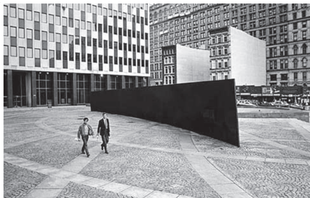
تصویر ۳: Titled Arc قبل از جابجایی، اثر ریچارد سرا، ۱۹۸۱م.، نیویورک

پس از برپایی تعداد زیادی جلسات محاکمه و دادرسی، بالاخره در سال ۱۹۸۹م. با توجه به «سنگینی وزن قانونی خواسته‌های عموم که در اطراف این میدان زندگی یا کار می‌کنند نسبت به خواسته هنرمند» (Kelly, 1996, 15) حکم نهایی دادگاه مبنی بر انتقال این اثر هنری از میدان به محلی دیگر صادر گردید. این واقعه باعث شد ریچارد سرا که آثار زیادی از وی در نقاط مختلف جهان ساخته شده بود از طراحی و ساخت کارهای هنری در عرصه عمومی کناره‌گیری کند. از آن زمان تا کنون سرنوشت این اثر بیش از هر اثر دیگری در حوزه هنر عمومی اذهان منتقدان و نویسندگان را به خود مشغول کرده و درباره آن تعداد زیادی نوشته ارائه گشته است.