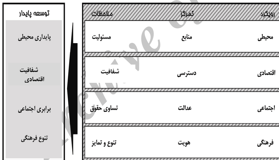
شکل ۱. بررسی مقایسه‌ای ابعاد رویکرد توسعه پایدار

به‌رغم اهمیت این بعد از پایداری، تا دههٔ اخیر، فرهنگ به‌نحوی سنتی به عنوان بخشی از ابعاد اجتماعی پایداری یا جزئی از سرمایه اجتماعی محسوب می‌شد و به‌طور مشخص مورد بررسی قرار نمی‌گرفت. برای نمونه، همان‌طور که ماتیو پایک ۸ (Pike, 2003) بیان می‌کند، در حالی که به تفصیل دربارهٔ سرمایه‌های اجتماعی نوشته شده است، اما توجه به سرمایه‌های فرهنگی همچون هنر موسیقی و جز آن، و نیز ارزش‌های مشترک آنها که اهمیت بسیاری در نزدیک ساختن مردمان دارند، کمتر مورد توجه قرار گرفته است. بخشی از این غفلت‌ها ناشی فقدان ملاحظات فرهنگی‌اند.