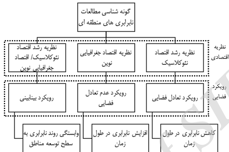
شکل ۳. مدل مفهومی گونه‌شناسی مطالعات نابرابری‌های منطقه‌ای

نابرابری‌های منطقه‌ای در سه دسته جای گرفتند: رویکرد تعادل فضایی که به نظریه رشد اقتصاد نئوکلاسیک رجوع می‌کند؛ رویکرد عدم تعادل فضایی که به نظریه اقتصاد جغرافیایی کروگمن رجوع می‌کند و دسته سوم رویکرد بینابینی که روند افزایشی یا کاهش نابرابری را متأثر از شرایط و سطح توسعه منطقه می‌داند. مدل مفهومی تحقیق حاضر در نمودار زیر منعکس شده است.