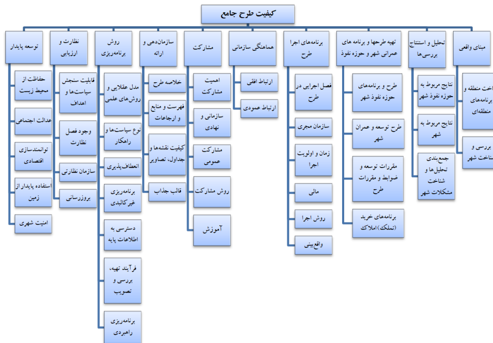
شکل ۲. مؤلفه‌ها و معیارهای مدل مفهومی کیفیت طرح‌های توسعه و عمران شهری (جامع)

(۳) طرح و برنامه: رویکرد برنامه‌ریزی موجود در برخورد با طرح و مسئله رشد و توسعه شهر باعث تولید محتوای طرح‌ها، شاخص و آیتم‌های سنجش کیفیت طرح می‌شود. طرح تهیه شده می‌تواند نمود بیرونی تفکرات و جهان‌بینی حاکم بر جامعه و یا حداقل حکومت مرکزی باشد. به صورت کلی در این بخش نمی‌توان دو مؤلفه اهداف و سیاست‌ها را به‌عنوان مؤلفه اصلی کیفیت طرح‌های جامع در نظر گرفت و با اینکه برخی طرح‌ها بر مبنای رویکرد برنامه‌ریزی راهبردی در کشور تهیه شده‌اند (برای مثال طرح مجموعه شهری تهران (مصوب سال ۱۳۸۱)، طرح جامع شهر تهران (مصوب ۱۳۸۶) و طرح‌های شهرهای درون مجموعه شهری تهران)، اما همچنان رویکرد اصلی تهیه طرح‌های جامع، استفاده از قرارداد تپ ۱۲ است. لذا اساساً طرح‌های جامع طبق شرح خدمات، رویکردی راهبردی ندارند و باید براساس اهداف از پیش تعیین شده و اهداف و سیاست‌های طرح‌های بالادست، قانونی و مصوب از سوی ارکان حکومت مرکزی تهیه و اجرا شوند. اهداف طرح جامع عبارت است از: (۱) تهیه برنامه بلندمدت شهر، (۲) مشخص نمودن نحوه استفاده از اراضی و منطقه‌بندی حوزه‌های مسکونی، صنعتی، بازرگانی، اداری و کشاورزی، (۳) تنظیم خطوط کلی ارتباطی و مشخص نمودن مراکز انتهایی خطوط (ترمینال‌ها، فرودگاه‌ها، بنادر و غیره)، (۴) تخصیص سطوح لازم برای ایجاد تأسیسات و تجهیزات و تسهیلات عمومی مناطق و نوسازی و بهسازی و تعیین اولویت‌های آنها، (۴) تدوین ضوابط و مقررات مربوط به موارد چهارگانه فوق‌الذکر. ۱۴ با این حال در پروتکل ارزیابی طرح‌ها، در ذیل مؤلفه «روش برنامه‌ریزی»، معیارها و زیرمعیارهایی برای اهداف و سیاست‌ها در نظر گرفته شده است. از این جهت می‌توان طرح‌هایی که داوطلبانه الگوی راهبردی را مد نظر داشته‌اند، شناسایی و ارزیابی نمود.