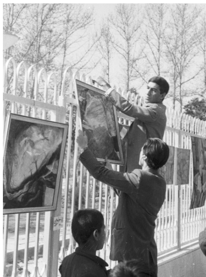
شکل ۸. نمایش عمومی آثار دانشجویان