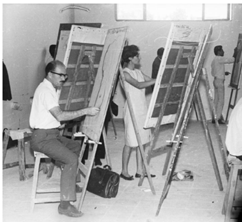
شکل ۵. کارگاه نقاشی در دهه ۵۰