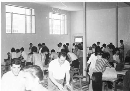
شکل ۷. کارگاه تزئینی در دهه ۵۰