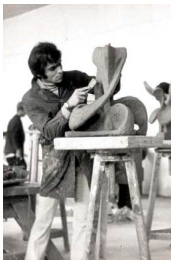
شکل ۶. کارگاه مجسمه‌سازی در دهه ۵۰