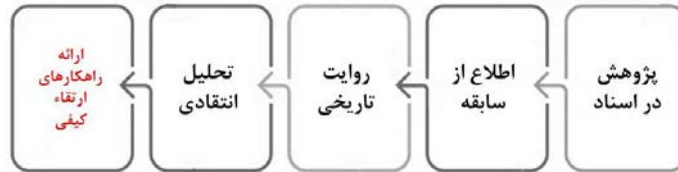
شکل ۲. مراتب پژوهش‌های بنیادی تا رسیدن به راهکارهای ارتقای کیفی

پیداست که ارتقای کیفیت بدون ارزیابی و ارزیابی بدون داشتن اطلاعات کافی ممکن نیست. در مورد آموزش معماری داخلی مشکل جدی پیش روی پژوهش‌های تحلیلی و انتقادی ثبت و ضبط نشدن سابقه است. روشن نیست پیش از این دوران چه اتفاقاتی افتاده، از همین روی شرط اول قدم گردآوری اسناد و آگاهی یافتن از سابقه است.