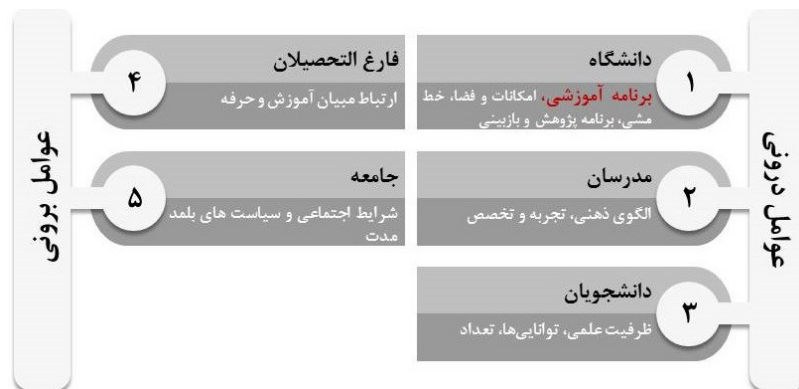
شکل ۴. عوامل درونی و برونی مؤثر بر کیفیت آموزش