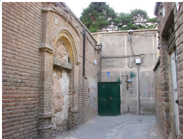
تصویر ۳: تخریب تزیینات بنا توسط مالک به‌منظور جلوگیری از ثبت (Rezaei 2014)