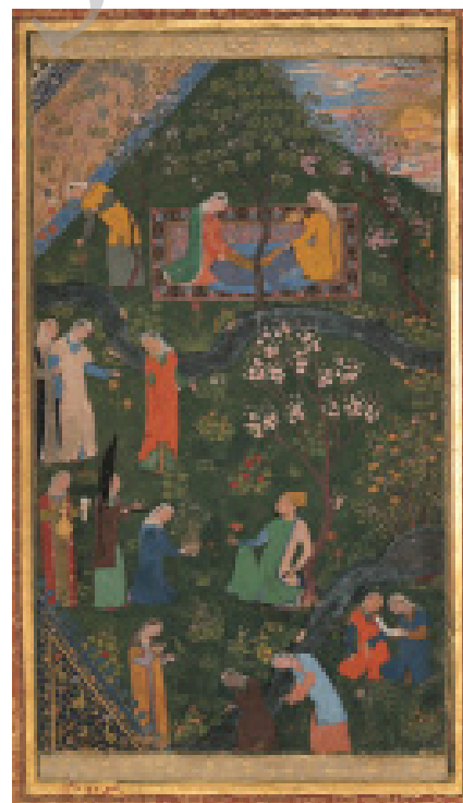
تصویر ۳: سلطان حسین میرزا در تفرج‌گاه (نیمه راست)، کمال‌الدین بهزاد، مرقع گلشن، صفحه ۶۲، اواخر سده نهم هـ، کاخ گلستان