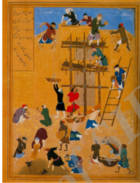
تصویر ۱: ساختن کاخ خورنق، کمال‌الدین بهزاد، خمسه نظامی، اواخر سده نهم هجری، موزه بریتانیا

از این دست نگاره‌ها بخشی اختصاصاً به عمل و ساخت معماری مربوط است؛ مثل نگاره‌هایی که در مرصعات اصناف آمده است و اطلاعاتی در زمینه فهم معماری به مثابه پیشه به‌دست می‌دهد. این دسته از نگاره‌ها برای مطالعه موضوعاتی از قبیل چگونگی طرح‌اندازی یا تبدیل طرح به بنا، ابزار و مواد کار معماران یا استادکاران، گروه سازندگان و شناخت اجتماعی ایشان و موضوعاتی از این قبیل مناسب‌اند. این نگاره‌ها گرچه معدودند و کمتر مورد توجه قرار گرفته‌اند، مدرک بی‌نظیری برای چنین موضوعاتی است.