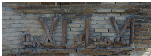
تصویر ۱۲: بخش چهارم کتیبه گنبد قابوس: الامیر ابن الامیر

الامیر» (ت ۱۲)، یادآور تکرار واژه‌های «شاه» و «شاه پسر شاه» در بسیاری از کتیبه‌های کاخ‌های هخامنشی (نک: لوکوک ۱۳۹۵) است. ۳۳ علاوه بر این در تمامی کتیبه‌هایی که بلر در کتاب خود آورده است تنها در کتیبه گنبد قابوس، واژه «امیر» با این بسامد و تأکید چهارباره می‌آید. به نظر می‌رسد این تأکید دست‌کم در دو قاب بر واژه «امیر» بدون هیچ پیشوندی برای قابوس و خاندانش نشانه‌ای از اصرار قابوس بر تأکید و نشان دادن استقلال و اقتدار پادشاهی خود و شکوه و عظمت پادشاهی زبیریان بوده است.