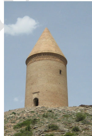
تصویر ۷: میل رادکان غربی (۴۱۱-۴۰۷ ق) (wikipedia.org)