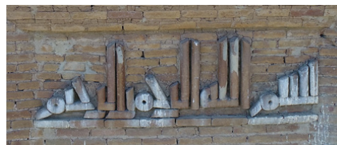
تصویر ۵: بخش نخست کتیبه: بسم الله الرحمن الرحیم

لغت «قصر» تنها در کتیبه میل رادکان غربی ۱۹ و بقعه پیر علمدار دامغان ۲۰ (۴۱۷ق) وجود دارد؛ با این تفاوت که در این دو کتیبه، لغت قصر در ترکیب با لغاتی چون «قبه» یا «مشهد» آمده است. در کتیبه برج‌های لاجیم ۲۱ (۴۱۳ق) و رسکت ۲۲ (شاید ۵۰۰ق) که ظاهراً به پیروی از برج قابوس ساخته شده‌اند، به ترتیب عباراتی چون «هذا قبر القبه» و «هذه القبه» آمده است. در کتیبه بقعه دوازده امام یزد (۴۲۹ق) و بقعه چهل دختران دامغان (۴۴۶ق) نیز عبارت «هذه القبه الامیر» و در بنای گنبد عالی [علی] ابرکوه ۲۳ (۴۴۸ق)، عبارت «هذه التربة للامیر ... نور الله قبرهما» آمده است (بلر ۱۳۹۴؛ گدار ۱۳۷۱، ج. ۲: ۲۲۵). برخلاف موارد فوق که آشکارا بر کارکرد تدفینی بنا اشاره دارند، در کتیبه گنبد قابوس، هیچ لغتی دال بر آرامگاه بودن بنا وجود ندارد. می‌دانیم که «در دوره اسلامی لغات قبه، بقعه، تربه (خاک)، مقبره، خوابگاه،