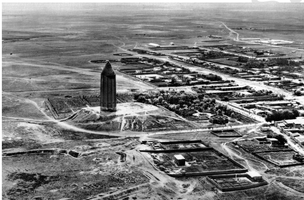
تصویر ۳: تصویر هوایی گنبد قابوس در سال ۱۳۱۶ش / ۱۹۳۷م (Schmidt 1940, plate 64)

گنبد قابوس نخستین میراث از سلسله‌برج‌های یادبود ایران است که به فرمان قابوس بن وشمگیر بر مسیر گرگان قدیم [که اعراب جرجان گویند] به خراسان ساخته شد. اما چه چیز باعث شد که او به ساخت چنین بنای رفیع و عظیمی مبادرت نماید که تاکنون بسیار جسورانه و منحصر به فرد بوده است؟ یافته‌های باستان‌شناسی نشان می‌دهد گنبد قابوس آن گونه که به نظر می‌رسد تنها نیست. این یافته‌ها آثار و بقایایی از گرگان قدیم، دیوار دفاعی گرگان و تعداد زیادی از تپه‌های باستانی را در حوالی بنا آشکار کرده است (نک: کیانی و مرتضایی ۱۳۸۶؛ Sauer 2013). مضاف بر اینکه مسیرهایی در شهر گرگان که به گنبد قابوس منتهی می‌شوند، حکایت از قرارگیری بنا در بستری تاریخی دارد که بقایای آن در حال آشکار شدن است. ۶ از طرفی به‌رغم فقدان هرگونه اشاره صریح یا تلویحی مبنی بر اینکه نیت اصلی قابوس از ساخت بنا آرامگاه بوده، کشف بقایای اجساد انسان‌ها در محوطه گنبد قابوس، احتمالاً شاهدی بر قرارگیری گنبد قابوس در قبرستان حاشیه گرگان قدیم است؛ ۷ هرچند در صورت تأیید وجود قبرستان در این منطقه، مطالعات تکمیلی برای تقدم یا تأخر ایجاد این قبرستان نسبت به ساخت گنبد قابوس ضروری می‌نماید.