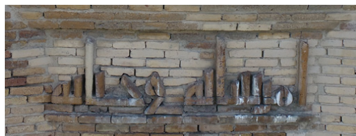
تصویر ۱۴: بخش ششم کتیبه گنبد قابوس: امر ببنا نه فی حیاته