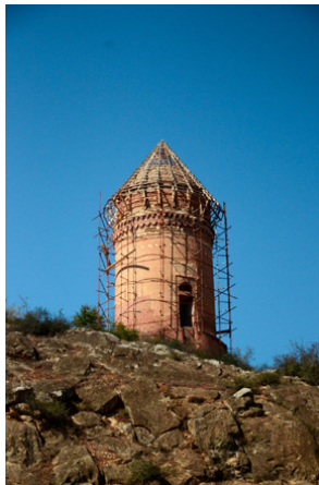
تصویر ۱۰: برج رسکیت (شاید حدود ۵۰۰ ق؟) (همان‌جا)

مشهد و قبر به «آرامگاه» اطلاق می‌شد. البته قبه از همه رایج‌تر است» (بلر ۱۳۹۴، ۱۷). در لغت عرب، «قَبَّه» به معانی گنبد، بنا یا عمارت گنبدی آمده است. لغت قَبَّه هم از ریشه «قَبَّ» به معنی بلند شدن، عمودی شدن و قدبرافراشتن است. برای همین عرب به برج ناقوس، قَبَّه الجرس می‌گوید (آذرنوش ۱۳۸۵، ۵۲۳). با این حساب، اطلاق واژه قبه به قصر قابوس در زبان فارسی هم‌زمان دارای دو معنی «گنبد قابوس» و «برج قابوس» است. در عمل هم این بنا تاکنون با همین دو اصطلاح شناخته شده است. پرسش قابل طرح این است که کتیبه‌نگاران گنبد قابوس به جای طیف وسیعی از واژگانی که بعدها در این گونه بناها به کار رفته است، چرا تماماً ترکیب «قصر عالی» را که نه نشانی از عنوان مرسوم «قبه» که به آن موسوم گشت و نه عنوان «قبر» آورده‌اند؟ پاسخ اولیه و منطقی به این پرسش این است که استفاده از این ترکیب و بدون واژه‌ای که ناظر بر آرامگاه بودن بنا باشد مانند آنچه در میل رادکان و پیر علمدار ذکر شد، نشان می‌دهد که ساخت این بنای باشکوه بسیار فراتر از ابعاد تدفینی آن بوده است.