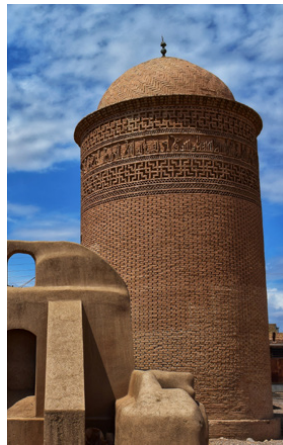
تصویر ۹: بقعه پیر علمدار (۴۱۷ ق) (همان‌جا)