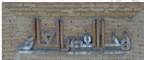
تصویر ۶: بخش دوم کتیبه گنبد قابوس در بالای درگاه: هذا القصر العالی

در ادامه، کتیبه بنا بر مبنای تبارشناسی واژگان و خاستگاه‌های محتمل این کلمات در متون کلاسیک تفسیر می‌شود. کتیبه قصر قابوس درست در زیر بازشوی گنبد رک و تمامی کتیبه‌ها در بناهای دوره اسلامی با «بسم الله الرحمن الرحیم» موسوم به تسمیه آغاز می‌شود. بخش دوم کتیبه هم که بالای درگاه است، عبارت منحصر به فرد «هذا القصر العالی» است. این ترکیب یگانه به عنوان نقطه عزیمت تحقیق حاضر، از این جهت قابل بررسی است که در تمامی کتیبه برج‌های آرامگاهی و دیگر کتیبه‌ها، جز دو استثناء جزئی، وجود ندارد.