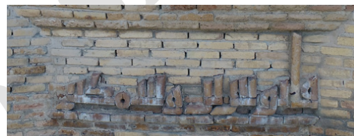
تصویر ۱۳: بخش پنجم کتیبه گنبد قابوس: قابوس بن وشمگیر

بنا بر ملاحظات این مقاله می‌توان ادعا کرد که گنبد قابوس به‌رغم آنکه الهام‌بخش مقابر و برج‌های بعد از خود بوده، صرفاً برای مقاصد تدفینی محض ساخته نشده است. تا آنجا که قابوس که دستور ساخت بنا را داده، به دو دلیل تمایل نداشته در کتیبه بنا عنوانی به کار رود که بنا به آرامگاه او شهره شود؛ اول آنکه او در نامیدن این بنا به قصر هر دو معنای ناپایدار قصر (کنایه از سکونت ناپایدار دنیوی) و پایدار قصر (کنایه از سکونت جاودانه اخروی) را در نظر داشته است. دوم، قابوس می‌خواسته این قصر نمادی از عظمت، بزرگی و بی‌مرگی نام او در یادها باقی بماند؛ درحالی که او با نهادن عناوین ناظر بر آرامگاه بر بنا، معنای محدود مرگ و پایان خود را به اذهان متبادر می‌کرد. در بخش ششم کتیبه نیز آمده است: «امر ببنا نه فی حیاته.» تأکید بر ساخت بنا در زمان حیات کارفرمای آن، اولاً تأکیدی بر این نکته است که این بنا را پس از مرگ قابوس نساخته‌اند؛ ثانیاً اشاره صریح بر واژه حیات که معنای متضاد آن، یعنی مرگ، درون آن نهفته است و سپس تاریخ کلیدی ۳۹۷ ق می‌تواند نمادی از حیات و جاودانگی نام و آغاز اقتدار حکومت او باشد.