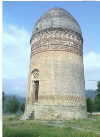
تصویر ۸: برج لاجیم سوادکوه (۴۱۳ ق) (همان‌جا)