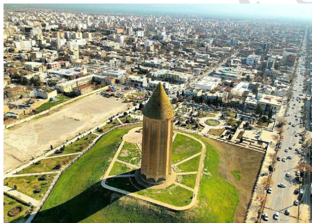
تصویر ۲: منظره عمومی گنبد قابوس (از جهت شمال) روی تپه مصنوعی

(Grabar 1966, 44). همو و اتینگهاوزن بار دیگر یادآور شده‌اند که در این بنا نشانی از مقبره دیده نمی‌شود و پیشنهاد داده‌اند که می‌توان منشأ فرم آن را در بعضی آثار یادبودی مزدایی و یا دگرسانی خیمه و چادر به یک بنای معماری دنبال کرد (اتینگهاوزن و گرابار ۱۳۹۴، ۳۰۴). به گفته هیلن براند تشخیص مفاهیم مرتبط با هریک از شکل‌های آرامگاهی، مستلزم بررسی در حوزه شمایل‌نگاری ۴ در معماری اسلامی است که به‌طور وسیعی ناشناخته مانده است. ضمن اینکه معتقد بود که مقابر اولیه نظیر مقبره سامانی و گنبد قابوس جز برای نگاهداشت یاد متوفی، برای مصارف دیگر از نظر موقعیت مناسب نبودند (هیلن براند ۱۳۸۷، ۲۷۸). او ریشه‌های معماری تدفینی سده‌های میانه ایرانی را احتمالاً در عناصر زرتشتی و ترکی می‌داند. قرارگیری مقابر روی تپه‌ها و در فضایی باز تداعی‌کننده دخمه زرتشتیان یا برج خاموشی است. همچنین برج‌هایی چون میل رادکان شرقی نیز با پس‌زمینه بی‌انتهای بیرون شهر، نمونه‌های صریح‌تری از ترجمان آجر در ارائه یک چادر شاهانه ترکی با بام مخروطی است (همان، ۲۷۳-۲۷۵). اما ولفرام کلایس (۱۹۸۲) نظری کاملاً متفاوت دارد. او برج مقبره اینانج یا بنای نقاره‌خانه شهر ری را خاستگاه اصلی فرم گنبد قابوس دانسته است (به نقل از مؤذن‌زاده ۱۳۹۷، ۳۱۴). میکائیلیدیس نیز معتقد است به‌رغم آنکه کتیبه برج مقابر شمال ایران به‌وضوح کارکرد تدفینی این آثار را نشان می‌دهند، هیچ بقایایی از اجساد در آن‌ها وجود ندارد. این بدان معناست که کارکرد این بناها چیز دیگری غیر از تدفین بوده است (Michailidis 2007, 280-283).