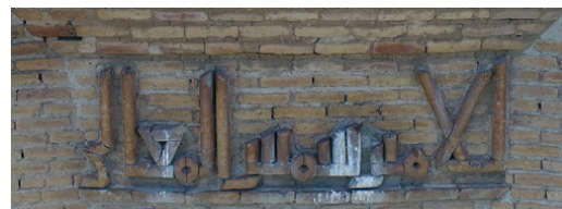
تصویر ۱۱: بخش سوم کتیبه گنبد قابوس: للامیر شمس المعالی