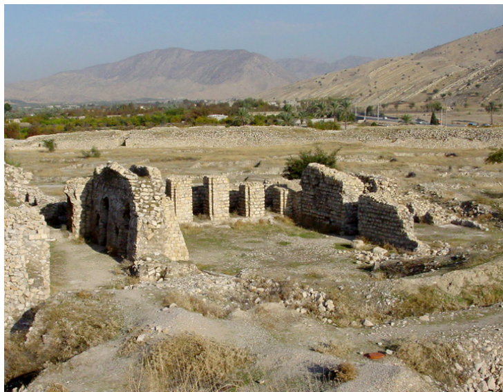
تصویر ۴: عکسی از ایوان موزائیک از سمت جنوب به شمال