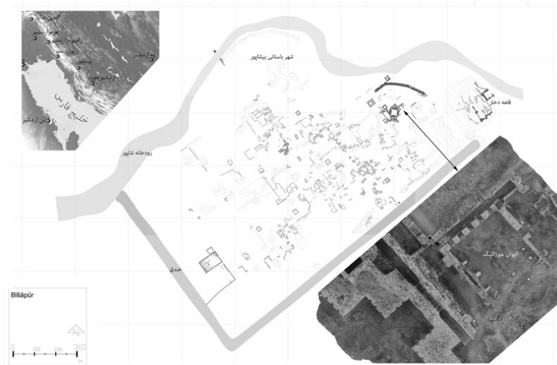
تصویر ۱: موقعیت قرارگیری بیشاپور، نقشه شهر و موقعیت ایوان موزائیک

ویرانه‌های شهر بیشاپور در جنوب غربی استان فارس و بین شهرهای قائمیه و کازرون قرار دارد (تصویر ۱). بنیان این شهر باستانی به شاپور اول، دومین پادشاه ساسانی که بین سال‌های ۲۴۰ تا ۲۴۳ م به تخت نشست (فرای ۱۳۸۹، ۲۲۰)، منسوب است. او در ساخت بیشاپور از تمام امکانات جهان آن روز بهره‌برداری کرد (گیرشمن ۱۳۷۸، ۳۲) و آنچه تا به امروز باقی مانده، نشان از عظمت و تنوع آثار هنری شهر در دوره حیات خود دارد. نگاه علمی و تحقیقاتی به این محوطه، از اوایل قرن نوزدهم میلادی آغاز شد. گزارش‌های جیمز ژوستین موریه (۱۷۸۰-۱۸۴۹م) که نتیجه بازدیدهای وی در سال‌های ۱۸۰۹ و ۱۸۱۱م از شهر بیشاپور بود، اولین سابقه توجه محققان غربی به این شهر تاریخی است (موریه ۱۳۸۵). او به توصیف بقایای نمایان شهر پرداخت و نقاشی‌هایی از برخی از آن‌ها ترسیم کرد. گزارش بازدید دیگری که دیوید تالبوت رایس (۱۹۰۳-۱۹۷۲م) در سال ۱۹۳۵م به چاپ رساند (Talbot Rice 1935) توجه موزه لوور را برای انجام حفاری در این شهر جلب کرد. او اولین کسی بود که شکل کلی شهر را بر اساس شواهد ترسیم کرد و از بعضی آثار عکاسی کرد. ژرژ سال (۱۸۸۹-۱۹۶۶م)، موزه‌دار وقت بخش هنرهای آسیایی موزه لوور، در همان سال مقدمات انجام کار میدانی را در شهر بیشاپور تهیه دید و از سال ۱۹۳۸ تا ۱۹۴۱م، کاوش‌های باستان‌شناسی به سرپرستی رومن گیرشمن (۱۸۹۵-۱۹۷۹م) به انجام رسید (گیرشمن ۱۳۷۸، ۱۱).