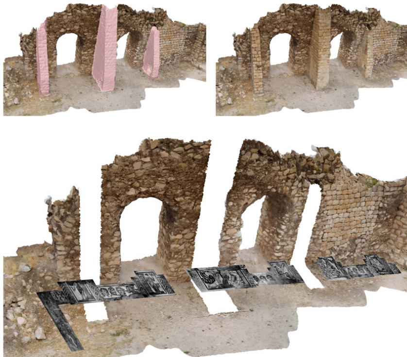
تصویر ۶: دیوار غربی ایوان، پشت‌بندها و موقعیت اصیل موزائیک‌ها