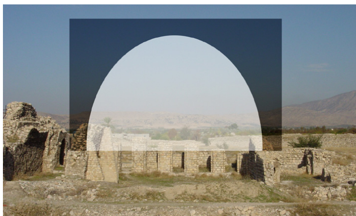
تصویر ۵: نمایی فرضی از طاق ایوان موزائیک