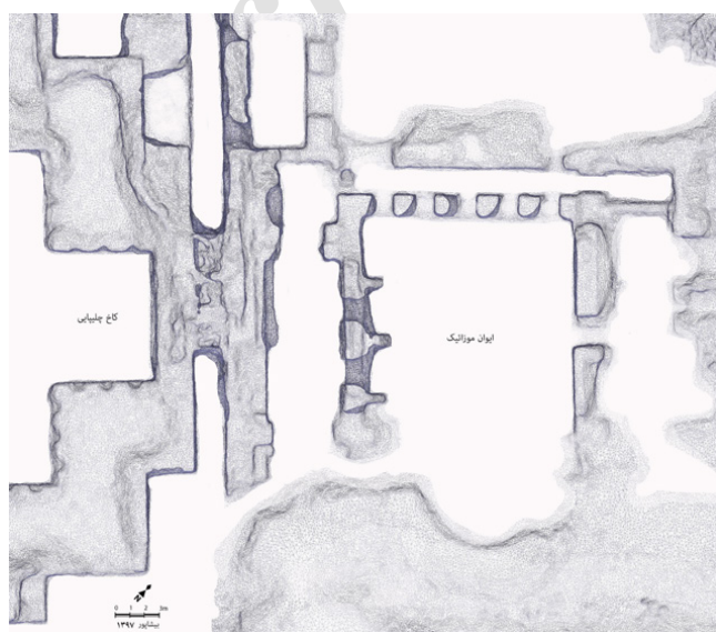
تصویر ۳: نقشه ایوان موزائیک. برداشت به روش فتواسکن توسط پرهپاد

یک بنای تاریخی، بنایی است که حس حیرت را به ما منتقل کرده و ما را وادار به خواستن دانستن بیشتر درباره فرهنگ مردمی می‌کند که آن را ساخته‌اند (Feilden 2003, 1) و این مهم میسر نمی‌شود مگر با درک نشانه‌ها. با حذف سرنخ‌هایی که بیننده عادی و یا متخصص را به جست‌وجوی دانستن بیشتر ترغیب می‌کند، هویت آثار را خدشه‌دار خواهیم کرد. قطعات و تزیینات معماری و گاهی اشیاء از دو جنبه به شناخت و درک آثار آسیب می‌زند که عبارت‌اند از آسیب به بستر و ادراک شیء. این قطعات ارتباط دوطرفه‌ای با فضایی دارند که در آن قرار گرفته‌اند. ایوان بدون موزائیک‌ها و موزائیک‌ها در مکان و شرایطی غیر از آنجایی که برای آن ساخته شده‌اند، از هویت خود فاصله زیادی دارند.