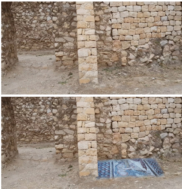
تصویر ۲: جانمایی مجازی یکی از نقوش موزائیکی که هم‌اکنون در موزه لوور نگهداری می‌شود