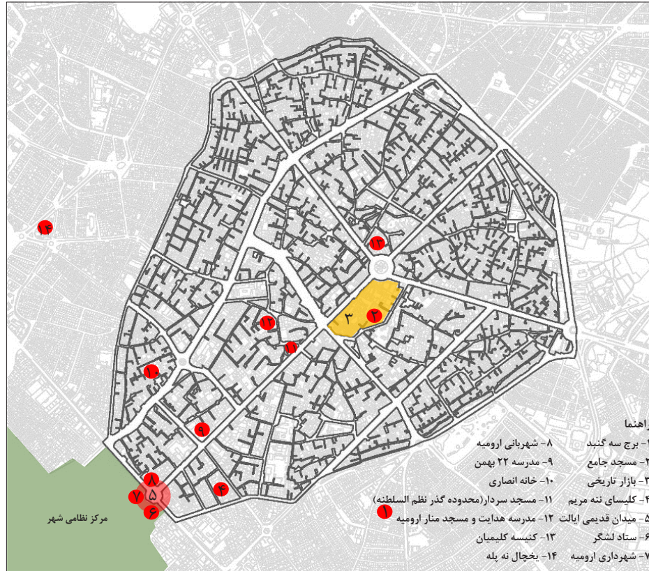
نقشه ۱: محدوده بافت تاریخی و مکان‌های میراثی ثبتی محدوده مرکزی ارومیه

مسائل پیچیده دارد (Zebardast, 2010:79)، مورد نظر این پژوهش قرار گرفته و شامل مراحل زیر می‌باشد: