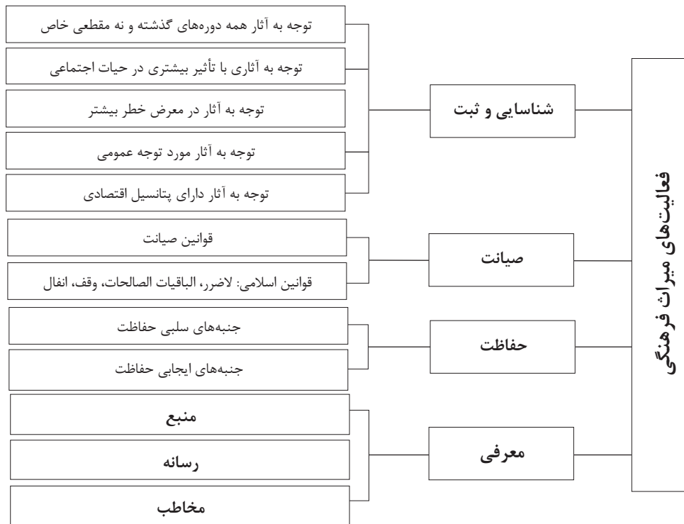
نمودار ۱: انواع فعالیت‌ها در حوزه میراث فرهنگی