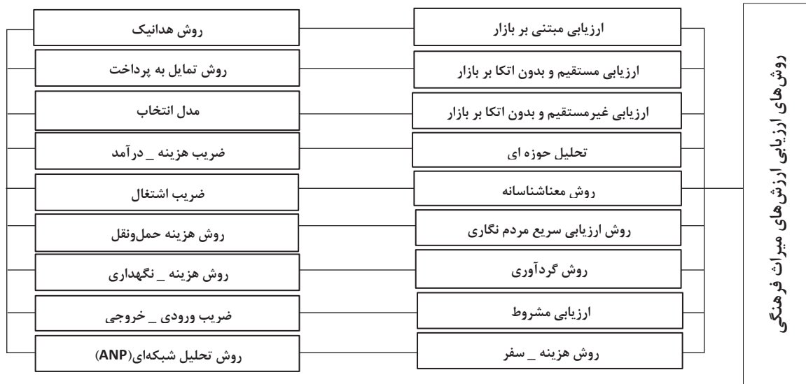
نمودار ۳: روش‌های مختلف ارزیابی ارزش‌های میراث فرهنگی (Abbaszadeh et al, 2013: 215)

در این قسمت با توجه به نقش ارزش‌ها در گردشگری فرهنگی، به اولویت‌بندی آثار تاریخی براساس ارزش‌های یاد شده با هدف تعیین منطقه و محور گردشگری در محدوده مرکزی شهر ارومیه پرداخته می‌شود. در این خصوص ضمن ارائه مختصر روش‌های