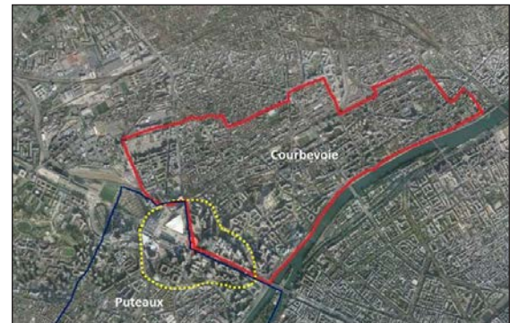
تصویر ۲: موقعیت لا دفانس بین دو جامعه محلی Puteaux و Courbevoie