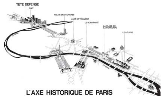
تصویر ۳: محور تاریخی شهر پاریس

۱۳ شماره شانزدهم پاییز ۱۳۹۴ فصلنامه علمی-پژوهشی مطالعات شهری