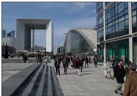
تصویر ۵: سکوی پیاده محور به عنوان ستون فقرات و نقطه کانونی پروژه ایفای نقش می‌نماید