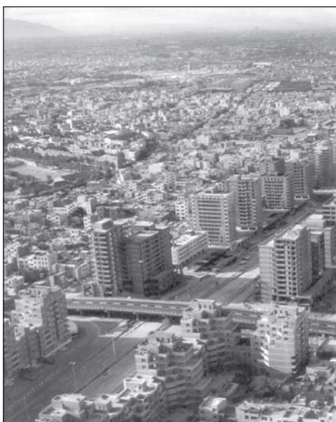
تصویر ۶: جداسازی عملکردی و نمادین محله توسط بزرگراه