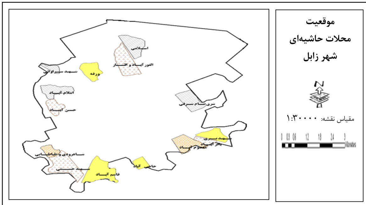
تصویر ۳: پراکندگی محلات حاشیه‌ای زابل

کارگر ماهر ساختمانی، ۲/۲۲ درصد کارمند بخش خصوصی و ۶/۶۹ درصد سایر شغل‌هایی مانند مسافرکشی (۶/۳۳ درصد) و دامداری (۰/۶۳ درصد) هستند و ۲۶/۹۰ درصد بیکار می‌باشند که آمار بیکاری در این مناطق به خصوص در بین سرپرستان خانوار جوان و دارای تحصیلات کم‌تر از دیپلم خیلی زیاد است.