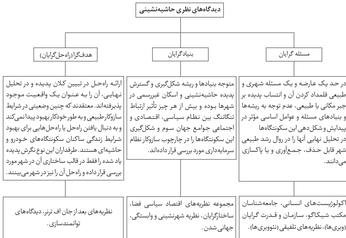
تصویر ۱: دیدگاه‌های نظری حاشیه‌نشینی - (Sheikhi, 2002: 37-38)

حجم نمونه برای جامعه آماری از طریق رابطه کوکران مطابق زیر می‌باشد: