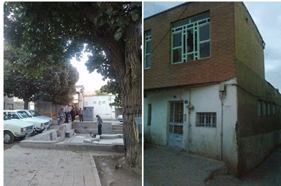
تصویر ۴: پنجره‌های شکسته و فضاهایی با اختلاف سطح در مرکز محله

CPTED، نظارت طبیعی، کنترل طبیعی دسترسی‌ها، تقویت قلمروگرایی و مراقبت و نگهداری می‌باشد. در این بخش به بررسی وضعیت کنونی مرکز محله آخوند با توجه به راهبردهای رویکرد CPTED پرداخته شده است. پس از مشاهدات میدانی که در مرکز محله آخوند انجام شد، نکاتی در مورد راهبردهای رویکرد CPTED مورد مذاقه قرار گرفت. با توجه به راهبردهای نظارت طبیعی رویکرد CPTED، موارد زیر مشاهده گردید (تصویر شماره ۴).