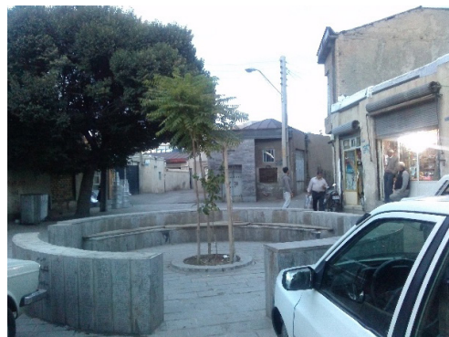
تصویر ۵: دسترسی‌های نامناسب منتهی به مرکز محله و تبدیل آن به پارکینگ