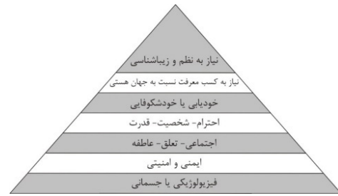
تصویر ۱: هرم مازلو

وجود دارد. این رویکرد در واقع، زمینه‌های اجتماعی، فیزیکی و روان‌شناختی ارتکاب جرم را شناسایی کرده و چهار نوع راهبردی برای کاهش فرصت ارتکاب جرم ارائه می‌دهد: ۱- افزایش امکان مشاهده جرم و جنایت، ۲- افزایش خطر ارتکاب جرم، ۳- کاهش منفعت‌های ارتکاب جرم و ۴- از بین بردن بهانه‌های ارتکاب جرم (Souri, 2010: 33).