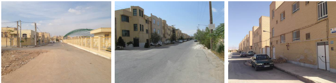
تصویر شماره ۲: منطقه آماده‌سازی شده امام‌شهر (سمت راست)، صفائیه (تصویر وسط) و آزادشهر (سمت چپ)