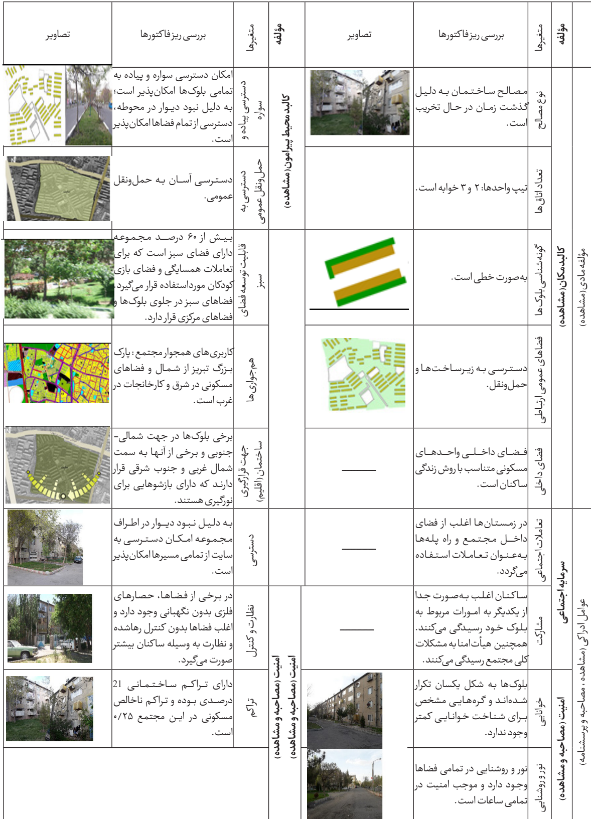
جدول شماره ۸: بررسی ویژگی‌های مادی و ادراکی

۶۳ شماره سی بهار ۱۳۹۸ فصلنامه علمی-پژوهشی مطالعات شهر کیفیت محیطی مؤثر در زیست پذیری مجتمع‌های مسکونی