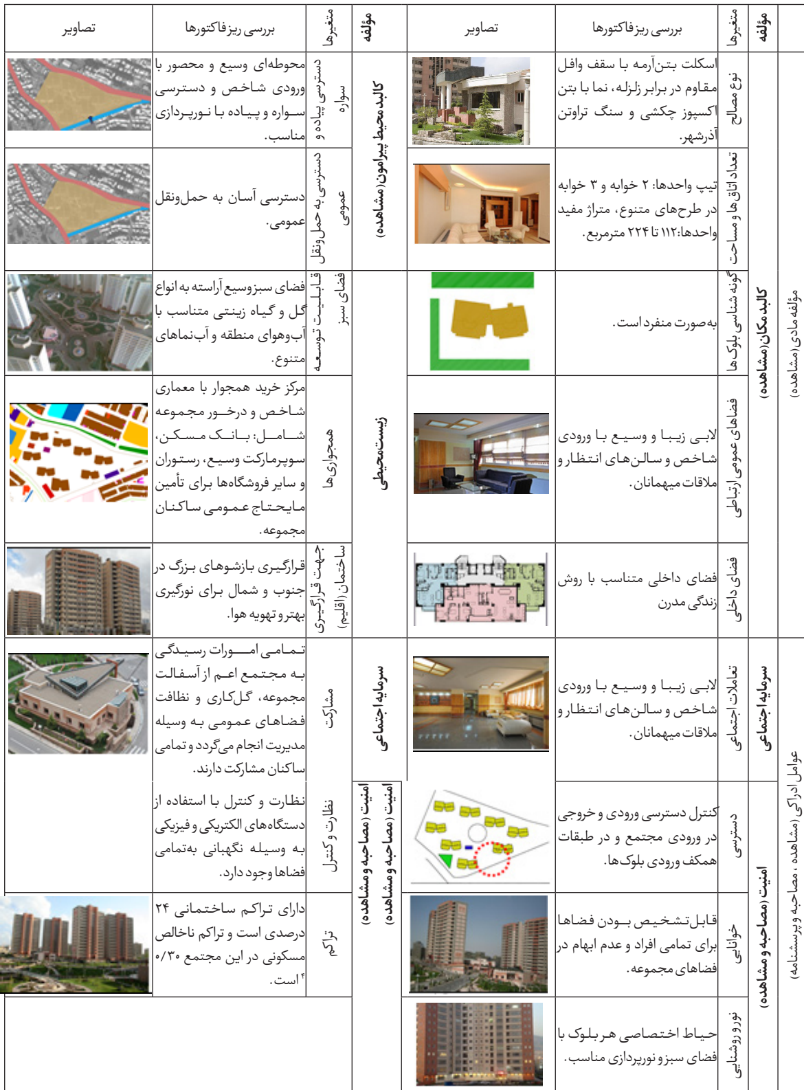
جدول شماره ۶: بررسی ویژگی‌های مادی و ادراکی