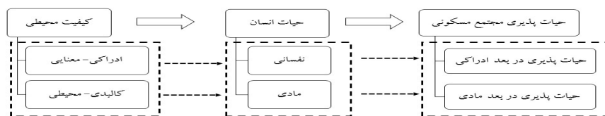
تصویر شماره ۲: دیاگرام حیات‌پذیری در مسکن با توجه به حیات انسان و کیفیت محیط

زندگی حقیقی بناها با زندگی انسان در آنها آغاز می‌گردد و تأثیرگذاری این زندگی بر پیکره بنا، امری روزمره است که رفته‌رفته به تغییر و تحولاتی متفاوت می‌انجامد (Alpano et al. 2005). معماری می‌بایست زندگی انسان را سامان دهد، چنان‌که اغلب مکاتب نیز ساماندهی محیط را مهم‌ترین اصل در بهبود زندگی انسان‌ها تلقی کرده‌اند. در واقع فضای معماری حاصل تجربه زندگی روزمره آدمیان است (Rendell, 2006). به عبارت دیگر کار معماری شکل دادن به مکان زندگی انسان است و کیفیت رویدادها و موقعیت‌هایی که در آنها فراهم می‌آوریم، موجب ایجاد حیات در بناها می‌گردد (Alexander, 1979). بنابراین زمانی که حیات در یک عنصر دیده شود، می‌تواند حیات‌پذیر باشد؛ زیرا برای حیات انسان شرایط مساعد را دارد. پس وقتی در مورد مکان یا فضای معماری بحث می‌شود، با توجه به این‌که قرار است فاکتورهایی را برای حیات انسان دارا باشد، می‌تواند از واژه حیات‌پذیری استفاده شود. همچنین به دلیل تأثیر متقابل محیط مسکونی بر زندگی ساکنان، تعریف کیفیت محیطی مؤثر بر حیات‌پذیری را ضروری می‌سازد. تحقق حیات‌پذیری در مجتمع مسکونی از راه اعتلای کیفیت محیط و با شناخت چگونگی حیات و مراتب آن صورت