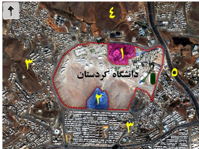
تصویر شماره ۲: موقعیت و همجواری های دانشگاه کردستان ۱- بیمارستان تأمین اجتماعی ۲- دانشگاه پیام نور ۳- محلات مسکونی ۴- دانشگاه علوم پزشکی ۵- محور اصلی شهر (بلوار پاسداران)