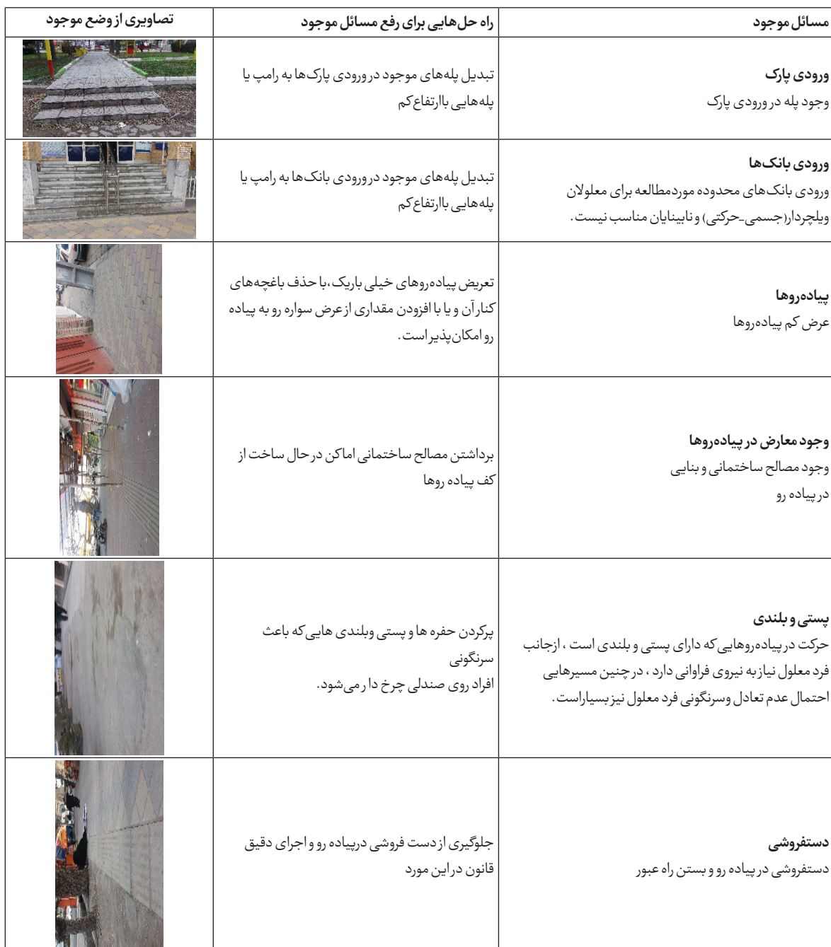
جدول شماره ۱۲: مسائل وضع موجود و ارائه راه حل‌هایی برای مناسب‌سازی بخش مرکزی شهرداری