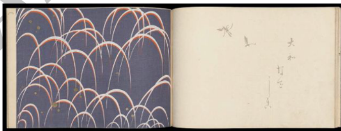
شکل ۷. چهار فصل زرین، اثر تامامورا شیموهیرو، ۱۹۰۳م، کتاب اهون چاپ‌نقش روی کاغذ، ۲۵/۵ در ۲۶/۸ سانتی‌متر، موزه هنرهای زیبای بوستون، منبع: www.educators.mfa.org

برای یافتن چنین مفاهیمی در زمینه تصویرسازی، آثار فراوانی یافت می‌شود که از قرار معلوم از زن تأثیر پذیرفته‌اند، در این بین سهم طومارها و پرده‌نگاره‌ها بیشتر است، اما آثار معاصر هم خالی از این آرمان نیستند. در کتاب شعری با عنوان چهار فصل زرین که توسط تامامورا شیموهیرو [44] با تکنیک اوکیوئه در سال ۱۹۰۳ تصویرسازی شده است، برای تصویر کردن شعری در خصوص فصول، تصویرگر با استفاده از فضایی که بین خوشنویسی تکرنگ و چاپ رنگی ایجاد کرده، مخاطب را در تعلیق میان دو صفحه از کتاب نگاه می‌دارد (تصویر ۷).