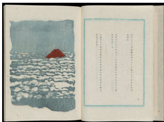
شکل ۲. کوه فوجی، اثر اونچی کوشیرو، ۱۹۴۶، چاپ‌نقش مرکب و رنگ روی کاغذ، موزه هنرهای زیبای بوستون

یکی از برترین عرصه‌های جلوه شیبویی در آثار تصویری زن، همان تکرنگ بودن یا استفاده حدقلی از رنگ است. چیزی که از شدت سادگی چشم را با ملایمت به‌سوی خود می‌کشاند. در وجهی دیگر نوع قلم‌گذاری این آثار را نیز باید مورد توجه قرار داد. قلم با سادگی و روانی بسیار بر روی زمینه به نوسان درمی‌آید؛ اما این سادگی شاید حتی زمخت، چیزی در ورای خود پنهان دارد که قابل بیان نیست. رمزی که در زیر لایه‌های روانی و بی‌پیرایگی خود گرفته است، از آشکارگی و زننده بودن مفاهیم جلوگیری می‌کند. این خصوصیتی است که در تمامی آثار تأثیر گرفته از زن به‌نحوی غیرآشکار باعث گیرایی آن می‌شود. آثار قرن دوازدهم ژاپن، یعنی زمان ورود زن تا دوره ابو (قرن نوزدهم) سرشار از این مفهوم ناب ژاپنی است. در دوران معاصر نیز هنوز این زیبایی در آثار برتر ژاپن دیده می‌شود.