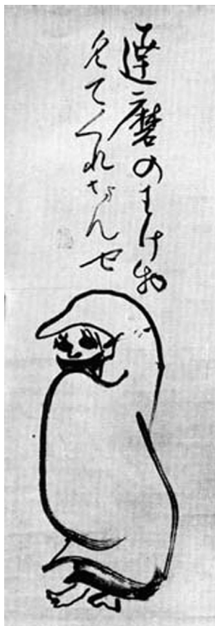
شکل ۴. داروما، اثر سنگایی، قرن نوزدهم، مرکب روی کاغذ، ۱۶ در ۲۰/۵ سانتی‌متر، موزه ایدمیتسو توکیو، منبع: Tanaka, 1980, 63.