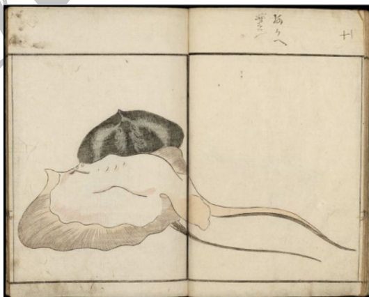
شکل ۳. گیوکایفو، اثر کوواگاتا کی‌سای، ۱۸۰۲م. چاپ‌نقش روی کاغذ، موزه هنرهای زیبای بوستون، منبع: www.educators.mfa.org

نمونه‌هایی از این دست کم نیستند. باید گفت چشم زیبایی‌شناس ژاپنی سال‌هاست که این ترکیب‌ها را می‌شناسد و به‌کار می‌گیرد. ترکیب‌بندی‌های بدیع و متفاوت تصویرسازی‌های ژاپنی در تمام دنیا مشهورند و برخلاف ترکیب‌های قرینه قرن هجدهم اروپا، ریشه در فرهنگ تصویری قرن دوازدهم ژاپن دارند، در آیینی که تکرار تقارن را کمالی غیرضروری و غیرقرینگی را تازگی ذهن و خیال می‌داند.