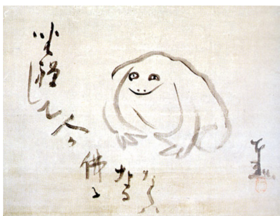
شکل ۵. قورباغه خندان، اثر سنگایی، قرن نوزدهم، مرکب روی کاغذ، ۱۶ در ۲۰/۵ سانتی‌متر، موزه ایدمیتسو توکیو

می‌رسید صدای تالاپا!»، موضوع شعر و طرح سنگائی قورباغه‌ای است که از دیدگاه خود به دنیای آدمیان می‌نگرد. در مذهب زن همه جانداران اعم از باشعور و بی‌شعور سهمی از ذات بودا دارند (تصویر ۵). شعر مطایبه‌آمیز سنگائی گوهری است از فرهنگ زن دوره ادو که آگاهی زن را با نگاهی بازیگوشانه به دنیا می‌آمیزد و تلفیقی می‌سازد که دلسوزی آن برای همه موجودات عالم ضامن بقای آن بوده است.