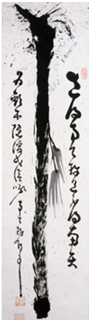
شکل ۶. چوبدست، اثر نانتمبو، قرن ۱۹، مرکب روی کاغذ، ۳۳ در ۱۳۱/۳ سانتی‌متر، مجموعه گیتز-یلن

زن، به کرات دیده می‌شود. آثار بی‌شمار طومارهای آویختنی که توسط راهبان دیرها به تصویر کشیده می‌شد و تعداد قابل ملاحظه‌ای در و پاراوان به این شیوه از قرن دوازدهم تاکنون به جای مانده است. بسیاری از این تصاویر با کوان یا هایکویی همراه است. نوشته‌ای که خود در معنا لحظه‌ای را می‌طلبد و البته نحوه اجرای خوشنویسی نیز همچون نقاشی شکلی بداهه‌گونه به خود گرفته است.