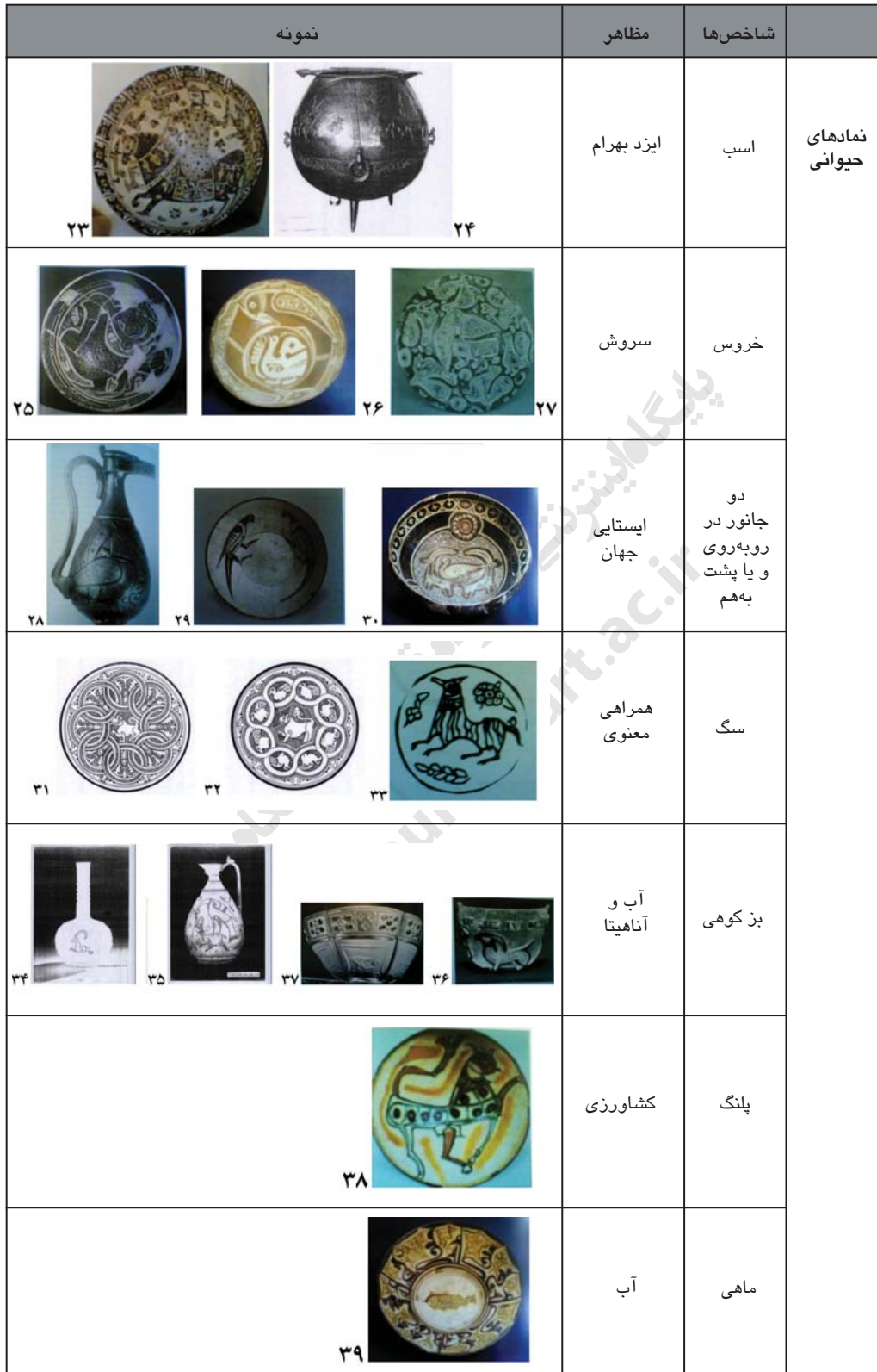
ادامه جدول ۲. نماد و اسطوره‌های کهن در ظروف خانگی قرون اولیه اسلامی ایران