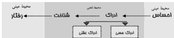
نمودار ۱. فرآیند کلی ادراک و شناخت

می‌نماید. کرمونا در کتاب «بعد طراحیانه برنامه‌ریزی»، طراحان شهری را ملزم به شناسایی مطالبات محیطی متفاوت منبعث از هر سه شیوه می‌داند و ضرورت برخورداری از نگاه فراگیر و جامع برای تأمین کیفیات مورد انتظار عموم از محیط در عین برآورده ساختن نیازهای انسانی (در انطباق با سلسله مراتب نیازهای مازلو) را یادآور می‌گردد.