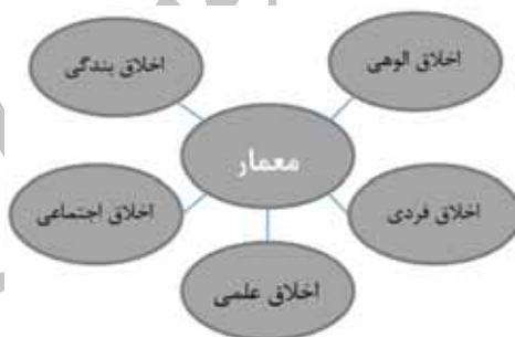
نمودار ۷. جنبه‌های اخلاقی یک معمار اسلامی