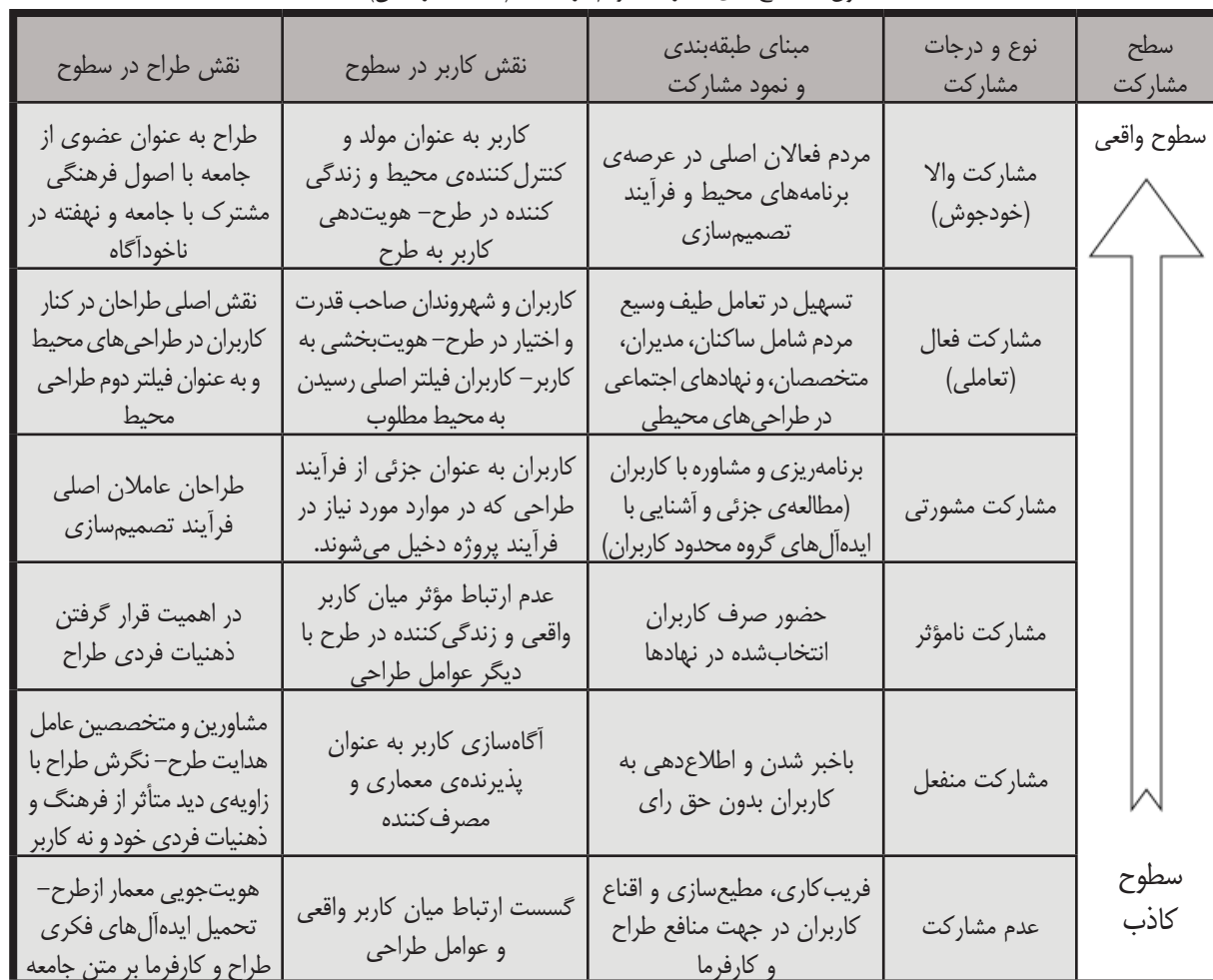
جدول ۱. سطح‌بندی مشارکت مردم در محیط

(انسان‌محور)، درصدد پاسخگویی به مسائل طراحی و توجه و تحقق اهداف انسانی صرف با پیروی از تمایلات کاربران یا الگوهای رفتاری ناخودآگاه کاربران (ناری‌قمی ۱۳۹۴) در طراحی مطرح می‌شود. مشارکت اجتماعی که در آن مشارکت به عنوان کنش اجتماعی مطرح می‌شود و بر دخالت دادن گروه‌های اجتماعی به صورت جمعی، آگاهانه، داوطلبانه، با اهداف معین و بر سهیم شدن در نفع اجتماعی تأکید می‌گردد (یزدان‌پناه ۱۳۸۶). در میان نظریه‌های مشارکتی غرب، آنچه که مشارکت‌کنندگان بر آن توافق دارند؛ مراحلی است که فرآیند برنامه‌ریزی و طراحی مشارکتی را در برمی‌گیرد: شامل زمینه، افراد مشارکت‌کننده، سطح مشارکت و زمان مشارکت (اسلامی ۱۳۹۲، ۲۶). مشارکت شهروندان به عنوان یک ضرورت در حوزه‌های مختلف نظیر برنامه‌ریزی، مدیریت و طراحی جمعی مطرح می‌گردد؛ که طبق مطالعات انجام گرفته در سطوح و درجات