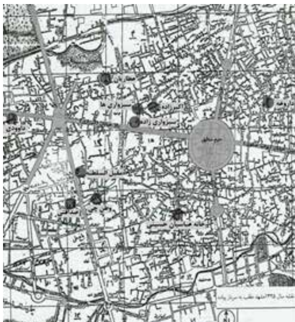
جدول ۱. تعریف زیبایی‌شناسی از منظر اندیشمندان