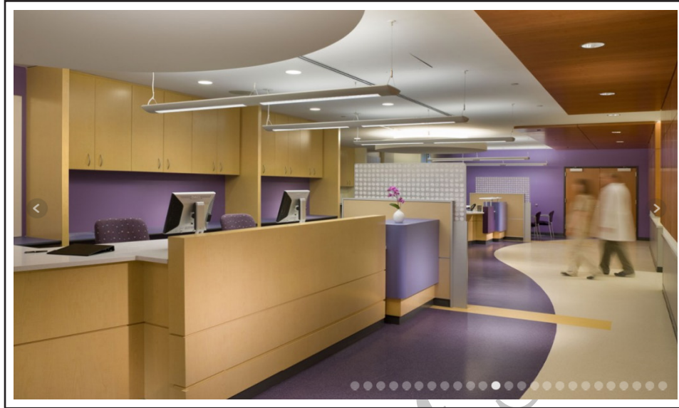
تصویر ۴. استفاده از تضاد رنگی دو رنگ بنفش و کرم در ایستگاه پرستاری جهت بهتر مشخص شدن فضا. مرکز درمانی کندی کریجر. استنلی بیمن و سیرز

می‌شود، هدایت کند. ایستگاه پرستاری مکانی شاداب و درعین‌حال پرکار می‌باشد. استفاده از تم رنگی همچون آبی، زرد، سبزهایی که