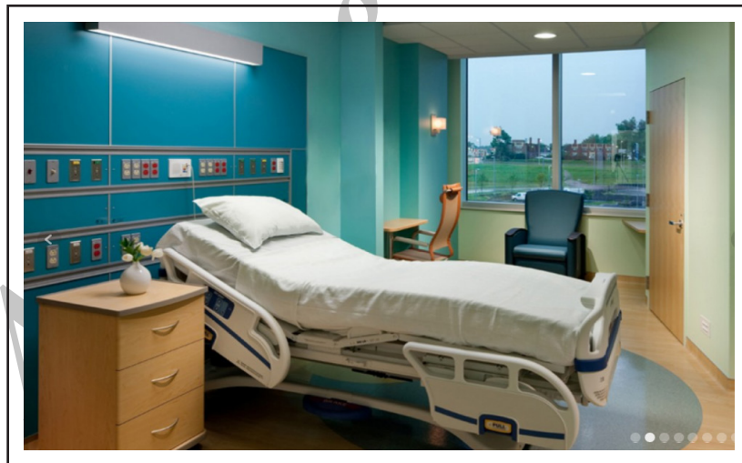
تصویر ۷- استفاده از یک تم رنگی ملایم در اتاق بستری. بیمارستان ا. اس. اف، گروه معماری استنلی بیمن و سیرز.

به طور کل می‌توان گفت رنگ‌هایی که سایه‌ی پاستلی و خام کمتری دارند و تن مایه‌های خاکستری بیشتر دارند، دید ساده‌تر و