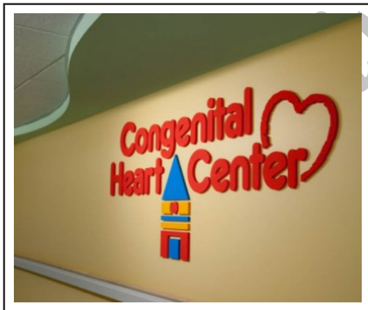
تصویر ۲. استفاده از رنگ‌های مکمل در تابلوها جهت بهتر مشخص شدن نوشته‌ها. بیمارستان کودکان پالمتو ۴ . گروه معماری استنلی بیمان و سیرز ۵ .

از آن در این بخش استفاده کرد، استفاده از نور طبیعی در راهروها و فضاهای ارتباطی بخش بستری علاوه بر جذاب کردن و روشن کردن خود فضا که بسیار مهم می‌باشد، برای کارکنان بیمارستان که بیشتر دید و منظرشان در این قسمت می‌باشد نیز بسیار مفید خواهد بود. در بخش‌های ارتباطی ترافیک فضا نسبتاً زیاد است. وقتی نمی‌توان از نور طبیعی در این قسمت استفاده کرد، بهتر است از رنگ‌های روشن جهت جبران این نقیصه استفاده نمود. همچنین رنگ‌ها در این قسمت می‌توانند در راستای هدایت و جهت‌دهی بیماران و ناظران استفاده شود. محققان دریافته‌اند که تنش ناشی از گم کردن راه می‌تواند منجر به احساس نامیدی افزایش فشارخون سردرد افزایش فشار تنش فیزیکی و خستگی گردد. رنگ ورودی بخش می‌بایست متفاوت با سایر قسمت‌ها باشد. استفاده از علائم و تابلوهای بصری نیز در این قسمت توصیه می‌شود (تصویر ۲). این امر علاوه بر بالاتر بردن کیفیت بصری، به خصوص برای مراجعه‌کنندگانی که برای اولین بار با این فضا مواجه می‌شوند و یا افرادی که با زبان دیگری مکالمه می‌کنند بسیار مفید خواهد بود (H., 2004: 62; Dalke). استفاده از رنگ در راهروها جهت مسیر یابی فضاها می‌تواند در کف صورت گیرد و یا از یک تم رنگی که مبین مسیریابی است در دیوارها استفاده شود (تصویر ۳).