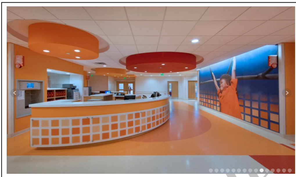
تصویر ۶. استفاده از رنگ‌ها در سقف جهت تبیین بهتر فضاها. بیمارستان دی ماگو ۹ گروه معماری استنلی بیمن و سیرز.