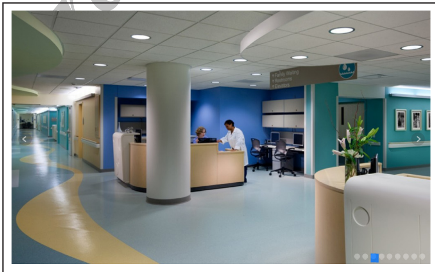
تصویر ۵. استفاده از رنگ تیره‌تر در ایستگاه پرستاری نسبت به سایر رنگ‌ها در بخش جهت بهتر مشخص شدن ایستگاه. بیمارستان ا. اس. اف، گروه معماری استنلی بیمن و سیرز.

ایستگاه پرستاری باید از دورترین قسمت بخش بستری و همچنین اتاق‌های بستری بیماران، قابل‌رویت باشد (تصویرهای ۵ و ۶). رنگ‌هایی که در این قسمت به کار می‌رود باید به نوعی گویای فعالیت‌های این بخش باشد. به طور کل توانایی درک محیط،