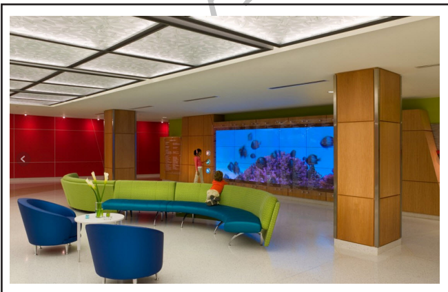
تصویر ۹. استفاده از رنگ‌های روشن در کف، دیوارها و مبلمان برای بخش کودکان. بیمارستان کودکان آتلانتا ۱ ، پردیس اسکاتلندی ریته. گروه معماری استنلی بیمان و سیرز.

رنگ محیط بستری کودکان (کف، دیوارها، سقف و مبلمان) در ایجاد شور و شوق و توانایی کودکان در درک بهتر فضا نقش مهمی ایفا می‌کند. معیار معماران در انتخاب رنگ نباید تنها محدود به رنگ، جنس و دوام آن‌ها باشد، بلکه باید بر اساس درک کودکان از رنگ‌ها صورت گیرد. انتخاب رنگ‌های تند در مقیاس وسیع توسط معماران با تفکر اینکه فضای کودکان را شاد و جذاب می‌کند، معمولاً منجر به نتیجه معکوس می‌شود. چرا که چنین رنگ‌هایی باعث ایجاد عدم تعادل در چشم کودکان می‌شود. رنگ‌های شاد و روشن که باعث ایجاد هیجان در کودکان می‌شوند بهترین رنگ‌ها برای رنگ‌آمیزی می‌باشند. بعضی از رنگ‌های ایده آل که کاربرد زیادی در طراحی اتاق‌های بازی کودکان دارند شامل طیف روشنی از رنگ‌های آبی، سبز، زرد، صورتی و نارنجی می‌باشد. تنوع رنگ‌ها فضا را مهیج‌تر می‌کند. رنگ‌آمیزی یک دیوار با رنگی روشن و استفاده از رنگ‌های مکمل در دیوار کناری یکی از این راهکارها می‌باشد (شامقلی، ۱۳۹۰: ۱۵۶).