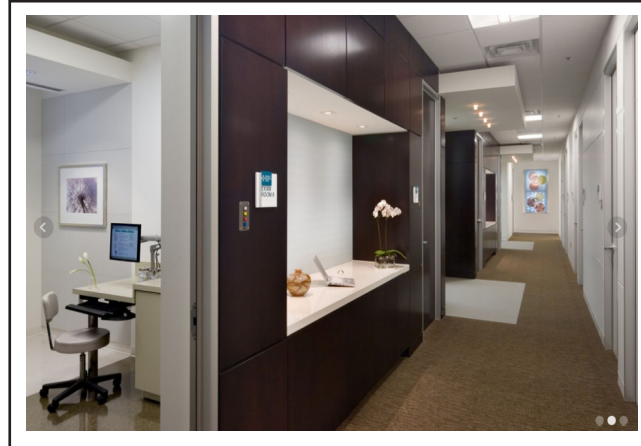
تصویر ۳. استفاده از تضاد رنگی در کف راهروها جهت تبیین مسیریابی فضاها. بیمارستان پید مونت ۶ . گروه معماری استنلی بیمن و سیرز. (20/3/2014)

رنگ این بخش می‌تواند در امتداد رنگ مسیریابی که در راهروها تعریف شده است باشد. امروزه سفید و یا یک رنگ کردن ایستگاه پرستاری که نیاز به تمرکز و دقت دارد توصیه نمی‌شود، چرا که تحقیقات نشان داده است که محیط‌های اداری با رنگ‌های متنوع نسبت به محیط‌های اداری کاملاً سفید و یا یک رنگ تنش و اشتباه کمتری را برای کارکنان به دنبال دارد. در واقع کیفیت طراحی ایستگاه پرستاری تأثیر مستقیمی در بهبود عملکرد کارکنان بیمارستانی و در نتیجه روند بهبود بیماران دارد. استفاده از نظرات پرستاران و کارکنان ایستگاه پرستاری در طراحی این قسمت بسیار حائز اهمیت می‌باشد چرا که آن‌ها بیش از هر کس دیگری به تجهیزات و فضاهای مورد نیاز خود آگاهی دارند. در انتخاب رنگ دیوارهای این قسمت حتماً می‌بایست از نظرات کارکنان این قسمت استفاده کرد.