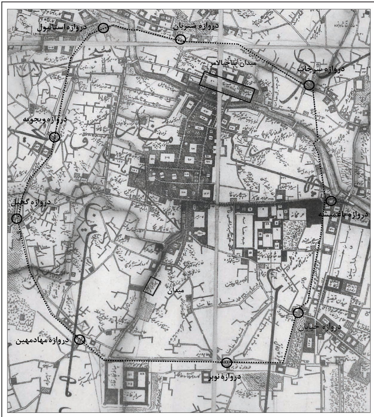
تصویر ۱. بخشی از نقشه دارالسلطنه تبریز، ترسیم توسط سرهنگ قراجه داغی، به سال ۱۲۹۷ ه.ق.، در این تصویر محدوده مربوط به باروی نجفقلی خانی و محل دروازه های نه گانه آن توسط نقطه چین مشخص شده، همچنین محدوده میدان کهن و صاحب الامر نیز تعیین شده اند.