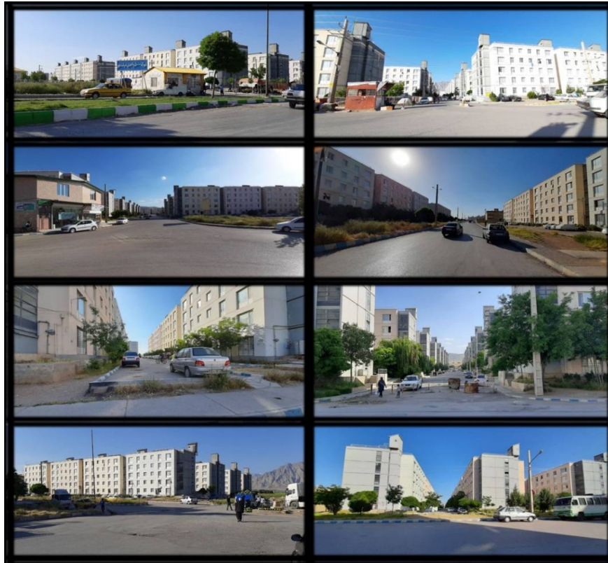
Fig. 2 Pictures of the current situation of the Dolat-e-Mehr residential complex