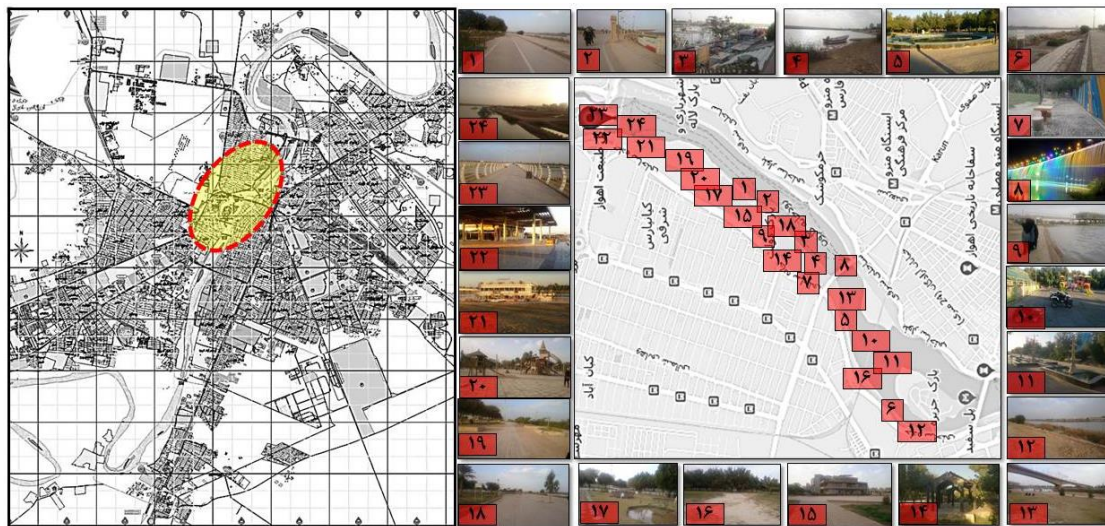
Fig. 2 Map of Ahvaz and study area

اهواز یکی از شهرهای ایران است و به عنوان مرکز استان خوزستان شناخته شده است. یکی از مهم‌ترین پتانسیل‌های گردشگری- تفریحی شهر رودخانه کارون است. با توجه به کشیدگی شمال به جنوب و فاصله‌ای که به واسطه عرض زیاد خود داشته است شهر را به دو حوزه شرقی - غربی تقسیم کرده است. کارون به عنوان لبه‌ای قوی معرف اصلی شهر اهواز است اما با نادیده گرفتن پتانسیل کارون، جانمایی فعالیت‌های خاص در کنار آن تا حدودی بی‌ارتباط با یکدیگر، به شکل محدودیت درآمده و تنها اکتفا به پل‌های عبوری برای اتصال پهنه شرق و غرب رودخانه صورت گرفته است. این در حالی است که با توجه به نیاز شهر به فضاهای عمومی با استفاده از زمین‌های بایر و قابل بهره‌برداری در مجاورت کارون و به عبارتی استفاده از فرصت‌های ساحلی این رودخانه به طول