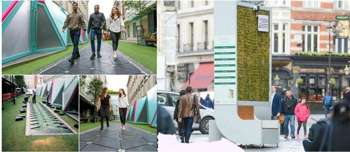
Fig. 1. Intelligent environment in an urban space where sidewalk flooring converts mechanical energy of pedestrians to electrical energy

مردم هوشمند و زندگی هوشمند از مهم‌ترین عوامل مؤثر هستند. زندگی هوشمند بیشترین تأثیرگذاری و مهم‌ترین عامل تبیین پایداری است و پس از آن به ترتیب جابجایی هوشمند و مردم هوشمند قرار دارند (Abdoli, Esmaeilzadeh & Fanni, 2019).