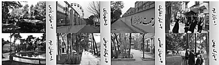
نگاره ۴: تصاویر منتخب و کیفیات مورد سنجش از شهروندان پیرامون تصاویر