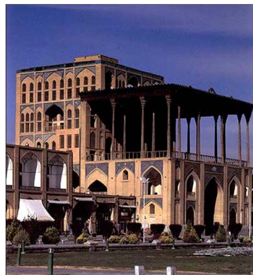
شکل ۳) عالیقاپو، حضور فضای تهی در مراکز دید (ایوان)

در نماها و بدنه‌سازی‌ها و ضرب‌آهنگ ستون‌گذاری‌ها و پنجره‌سازی‌ها، پس از حفظ تقارن یا تعادل جداره، اغلب تقسیمات به‌صورت اعداد فرد یعنی سه و پنج و هفت (سه‌دری، پنج‌دری و هفت‌دری و غیره) تقسیم می‌شود تا همواره قسمت میانی، فضای خالی باشد و نگاه انسان بر توده و جرم ساختمان مانند جرز و دیوار یا چارچوب پنجره‌ها ثابت نشود. حضور ایوان نیز در ورودی بنا خود می‌تواند تأکیدی بر اهمیت فضای خالی (باز و نیمه‌باز) در معماری ایران باشد (شکل ۳).