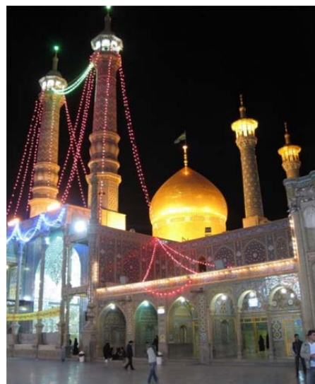
شکل ۶) بارگاه مطهر حضرت معصومه (س) در قم، گنبد طلا، جلوه‌گاه خورشید بر زمین

در اندیشه سهروردی خورشید نماد نورالانوار و جلوه حضور حق تعالی در عالم مشهود است. این جلوه در گنبدهای طلایی می‌تواند مصداق معمارانه درخشش خورشید در کالبد معماری باشد. در بارگاه ائمه اطهار که در آیات و روایات برکات وجودشان به تلالو خورشید تشبیه شده است، گنبدهای طلایی متعددی را در معماری ایران می‌توان مشاهده کرد، از آن جمله می‌توان گنبد طلای بارگاه امام رضا (ع) ، حضرت معصومه (س) ، امام حسین (ع) و غیره را نام برد (شکل ۶).