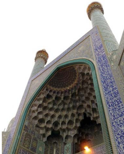
شکل ۷) مقرنس‌کاری سردر مسجد امام اصفهان، چلچراغ آویخته از آسمان

مقرنس برجسته‌ترین تزیین محراب و سردرها و در عین حال زیباترین، رازآمیزترین و پرشکوه‌ترین جنبه آن است. این به ظاهر چلچراغ آویخته از آسمان، محصول موانست و هم‌نشینی بسیار لطیف رنگ و نور بر بستر معماری و بازتابی از زیبایی افلاک، آسمان‌ها و طبیعتی است که در هنر اسلامی، معلم و مبنای آفرینش آثار هنری محسوب می‌شود [13]. "مقرنس تمثیلی از فیضان نور در عالم مخلوق خداوند است که چون چلچراغی بر سر جان نمازگزاران، نور رحمت، معنا و معنویت را می‌گستراند" [13] (شکل ۷).