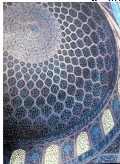
شکل ۲) گنبد مسجد شیخ لطف‌الله، تجلی معنوی نور [19]