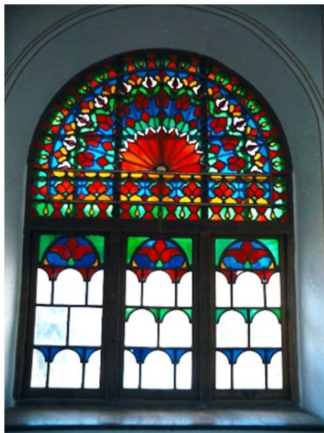
شکل ۴) شیشه رنگی اتاق شاه‌نشین خانه قدکی تبریز، نمود رنگ در معماری

خداوند در فصل چهل و هشتم از دعای شریف جوشن کبیر می‌فرماید "یا نورالنور، یا منورالنور یا خالق النور، یا مدبرالنور، یا مقدرالنور یا نور کل نور یا نوراً قبل کل نور یا نوراً بعد کل نور، یا نوراً فوق کل نور، یا نور لبس کمثله نور" [23]. این عجب کاین رنگ از بی‌رنگ خاست، رنگ با بی‌رنگ چون در جنگ خاست [24].