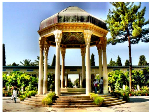
شکل ۲) آرامگاه حافظیه؛ شیراز، ایران

معماری از دیرباز به انسان کمک کرده است که وجود خود را معنادار کند. انسان به مدد معماری پایگاهی در فضا و زمان به دست آورد، پس به امری فراتر از نیازهای عملی و اقتصادی متوجه است و به معانی وجودی توجه دارد؛ معانی وجودی از پدیده‌های طبیعی و انسانی و معنوی نشأت می‌گیرد و در قالب نظم و شخصیت به ادراک درمی‌آید. هم از این روست که معماری این معانی را به‌صورت‌های فضایی تجربه می‌کند. صورت‌های فضایی در معماری نه اقلیدسی است نه آینشتاینی. بلکه یعنی مکان و معبر و حوزه؛ به عبارت دیگر، ساختار ملموس محیط انسان. پس معماری را نمی‌توان از راه مفاهیم هندسی یا نشانه‌شناسانه به‌درستی تبیین کرد. معماری را باید در چارچوب صورت‌های معنادار (نمادین) فهمید. بدین لحاظ، معماری بخشی از تاریخ معانی وجودی است. به زعم شوئر امروزه انسان سخت نیازمند آن است که "معماری چون پدیده‌ای ملموس را دوباره فراچنگ آورد" [23] . هوسرل معنا را در منطق استوار می‌سازد و بیان (معنا) را مستقل از ارتباط نشانه‌ای تصور می‌کند؛ اما به عقیده دریدا، میان معنا (بیان) و نشانه‌های آن نوعی درهم‌تنیدگی ذاتی وجود دارد. معنا هرگز نمی‌تواند مجرد از بافت زبان شناختی، نشانه‌شناختی و تاریخی‌اش در نظر گرفته شود. این بافت‌ها نظامی از ارجاع است که به فراسوی خود حضوری معنا اشاره دارد و سعی در نشان‌دادن پیوند ذاتی نشانه و معنا دارد [24] (شکل ۲).