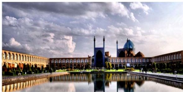
شکل ۱) احساس فضا، همیشه با زمان و مکان در ارتباط است؛ میدان نقش جهان، اصفهان، ایران

ذهنی از فضا بینجامد. این عینیت قابل ادراک بر مبنای محرک‌های حسی و تجربیات شخصی و قومی و جمعی و چارچوب‌های فرهنگی و قضاوت‌های زیبایی‌شناسی و ارزش‌ها و ایده‌آل‌ها و آرمان‌ها ادراک می‌شود و نهایتاً تصویر ذهنی در ذهن ناظر شکل می‌گیرد. قابلیت ایجاد تصویر ذهنی از فضا در ذهن انسان، قابلیت موجود در فضای معماری است که می‌تواند به ایجاد حس مکان بیانجامد. معماری یعنی خلق و سامان‌دهی فضاها، فضاهایی که ممکن است هر کدام القاکننده حالتی خاص در مخاطب خود باشند. منتهی مساله‌ای که در مورد درک از فضاهای معماری مهم می‌نماید این نکته است که بیشترین درک از فضای معماری به‌وسیله چشم صورت می‌گیرد البته نقش سایر حواس هم در درک برخی از فضاها اهمیت دارد. معمار یک بنا ایده‌ای خاص را در سر می‌پروراند و برای اینکه بتواند این ایده را به تصویر بکشد نیاز به خلق فضا دارد. و این فضای اوست که تعیین می‌کند کدام دیوار از چه نوع مصالحی و به چه رنگی در کجای فضای او ظاهر شود. شاید خیلی از مردم به غلط این برداشت را داشته باشند فضای معماری را دیوارها، ستون‌ها و سقف‌هایی که محصورش کرده‌اند به وجود آورده است. در صورتی که این برداشت نسبت به فضای معماری کاملاً غلط است چون همان طور که در پیش‌درآمد ذکر شد این ماهیت فضا است که تعیین می‌کند کدامین عنصر در کجا قرار گیرد.