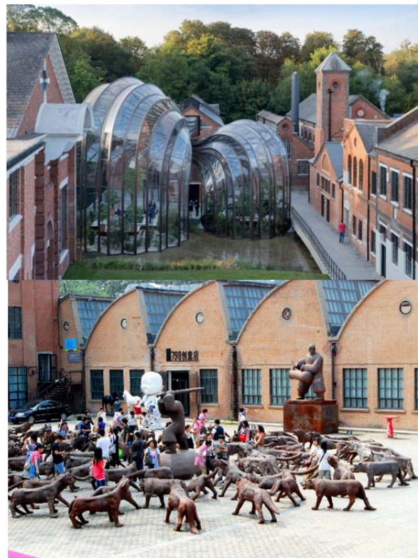
شکل ۲) تصویر بالا کارخانه‌ای در همپشایر انگلستان است که با رویکرد زیست‌محیطی و انرژی به یک باغ بوتانیک تبدیل شده و تصویر پایین ناحیه هنری ۷۹۸ شهر پکن را نشان می‌دهد که رویکرد فرهنگی و اجتماعی در تغییر کاربری آن غالب بوده است.

فضاهای تاریخی است، در عین حالی که به ارزشهایش در جامعه احترام گذاشته و بر آن بیفزاید [10] . تغییر کاربری تطبیقی ساختمان‌ها، گونه‌ای راهبرد برای پایداری شهری است؛ چرا که این کار عمر ساختمان‌ها را طولانی‌تر، جلوگیری از تولید زایدات ناشی از تخریب، استفاده مجدد از انرژی نهادینه را تشویق و همچنین منافع شاخص اجتماعی و اقتصادی را برای جامعه تامین می‌کند. بنابراین، این شیوه ابعاد گوناگون پایداری را در بر می‌گیرد [12] . انتخاب بهترین کاربری برای بناهای صنعتی متروک نیاز به ارزیابی دقیقی از جنبه‌های متعدد مرتبط با ارزش ساختمان (تاریخی، اجتماعی، اقتصادی و تکنولوژیکی) و نیز شرایط موجود آن نظیر جانمایی سازه‌ای، قابلیت همسوسدن با کاربری‌های جدید، پتانسیل مواجهه با استانداردهای روز، شرایط تاسیساتی موجود و تداوم بافت دارد. از جنبه عملکرد زیست‌محیطی، مواجهه با بنای موجود می‌تواند محدودیت‌هایی را به همراه داشته باشد. ثابت‌بودن ارتفاع سقف برای دربرگرفتن داکت‌ها، ثابت‌بودن سطح دید پنجره‌ها و اثر آن بر حجم نور روز و محدودیت فضا برای پیاده‌سازی اقدامات جدید، امکان دستیابی به یک اجرای خوب را پایین می‌آورد. به‌علاوه محدودیت‌هایی برای ارتقای کارایی انرژی نیز وجود دارد، به‌ویژه اگر تغییراتی مد نظر باشد که ممکن است بر اصالت و یکپارچگی بنا تأثیر گذاشته یا غیرقابل برگشت باشد [10] . با برخورد درست، مجموعه‌های صنعتی در مقام ساختارهایی مهم می‌توانند توانمندسازی شوند و قابلیت احیای بافت پیرامون خود را بیابند. این مطلب با پروژه‌های متعددی در سراسر جهان نظیر سایت میراث جهانی کارخانه ذغال‌سنگ شهر اسن آلمان، ناحیه هنری ۷۹۸ در شهر پکن، تیت مدرن در لندن و محدوده سوهو در نیویورک ثابت شده است (شکل ۲).