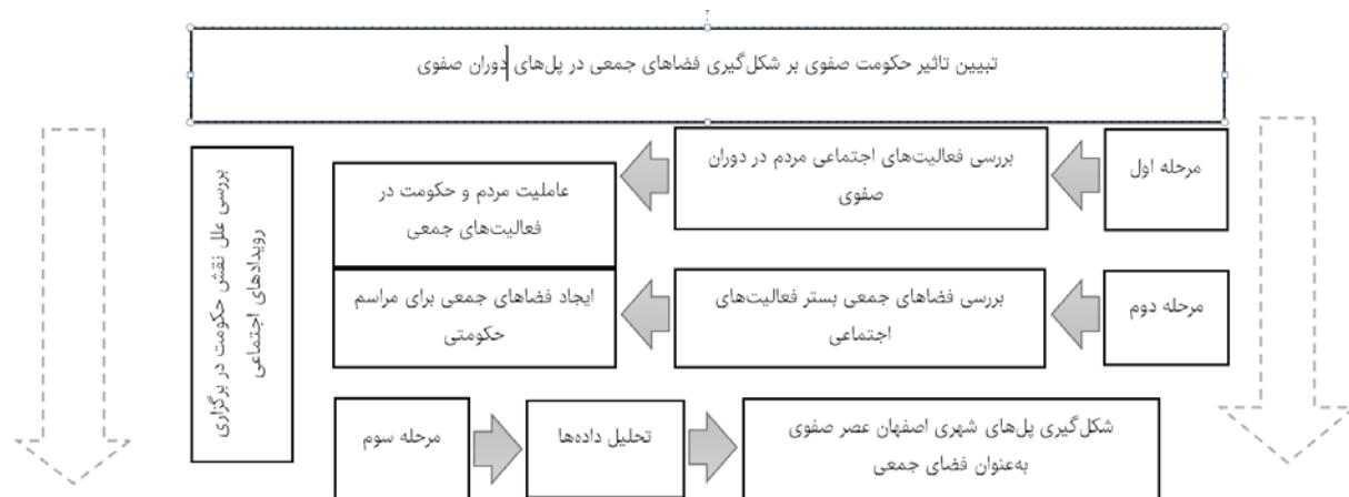
شکل ۱) مراحل انجام مطالعه