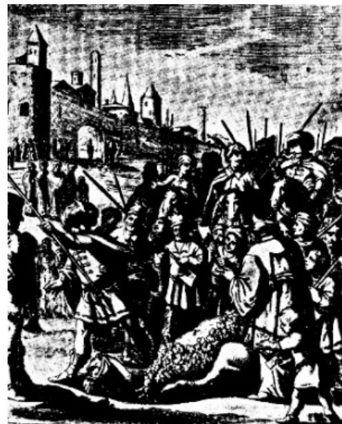
شکل ۲) مراسم قربانی کردن شتر در روز عید قربان [10]