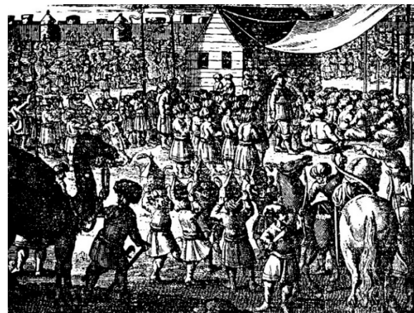
شکل ۳) مراسم عزاداری امام علی (ع) [12]