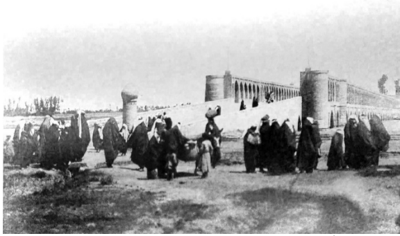
شکل ۵) پل الله‌وردی خان [25]