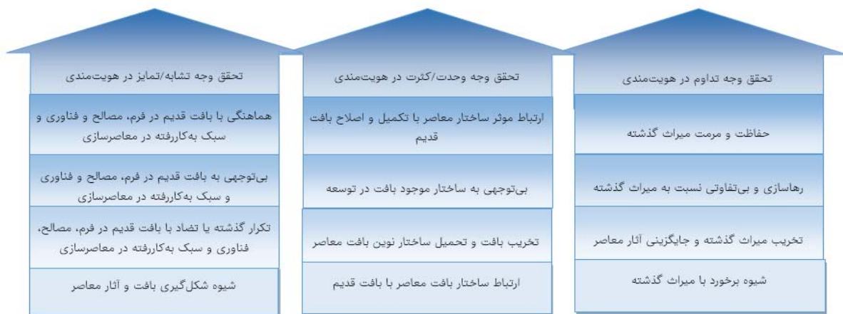
شکل ۱ سطوح تحقق مولفه‌های هویت‌مندی در معاصر سازی بافت‌های کهن شهری

از نظر مادی به معنی دخل و تصرف در اثر، برای گفت‌وگوی خلاق بین ارزش‌های پایدار کهن و ارزش‌های والای معاصر است و نه تصمیم‌های مقطعی گذرا [10]، به شکلی که میراث مادی و فرهنگی را به ثروت مادی و فرهنگی مبدل می‌کند. از این منظر می‌توان تحولات بافت‌های کهن شهری را از سه جنبه نحوه برخورد با میراث گذشته، چگونگی ارتباط ساختار معاصر با ساختار بافت قدیم و شیوه تشخیص و شکل‌گیری بافت و آثار معاصر در تشابه یا تمایز با بافت قدیم مورد بررسی قرار داد. "مبانی و مفاهیم" مورد استفاده در معاصر سازی در سبک معماری و شیوه مداخله در بافت، "فرم و شکل" از نظر معاصر، سنتی یا تلفیقی بودن آن، "فناوری ساخت" در نحوه استفاده از تکنولوژی‌های سنتی یا معاصر، "مصالح" از نظر هماهنگی یا متضاد بودن با مصالح سنتی از نظر وجه تشابه و تمایز هویت، توجه به زمینه در نحوه تعامل ساختار بافت معاصر با بافت کهن برای حفظ وحدت و انسجام بافت معاصر سازی شده در عین کثرت و حفاظت از آثار ارزشمند بافت برای تداوم هویت گذشته می‌تواند مورد بررسی قرار گیرد. شکل ۱ سطوح تحقق مولفه‌های هویت‌مندی در معاصر سازی بافت‌های کهن شهری را نشان می‌دهد.