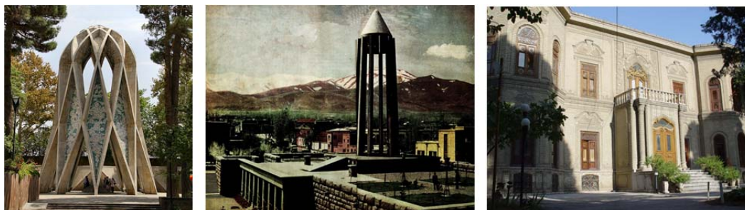
شکل ۳) به ترتیب از راست: خانه قوام السلطنه- موزه آبگینه؛ وسط: آرامگاه بوعلی با الهام از برج گنبد قابوس، باغ‌ها، حیاط‌ها و کاخ‌های ایران؛ سمت چپ: مقبره خیام، تلفیقی از شعر و هندسه و گنبد‌های ایرانی