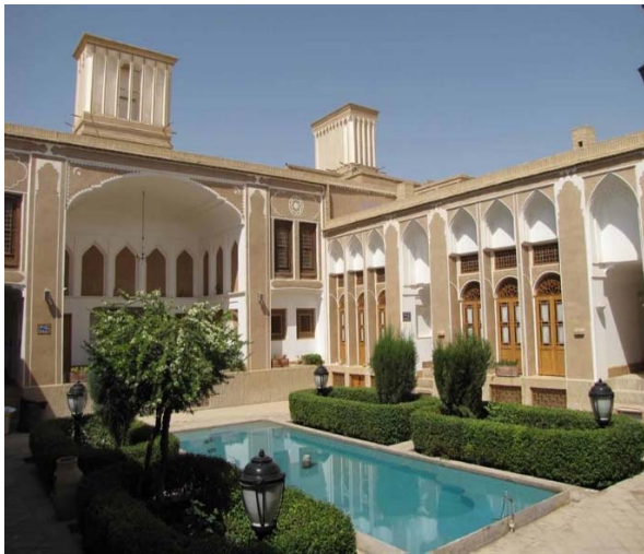
شکل ۳) خانه گلشن، یزد، ایران