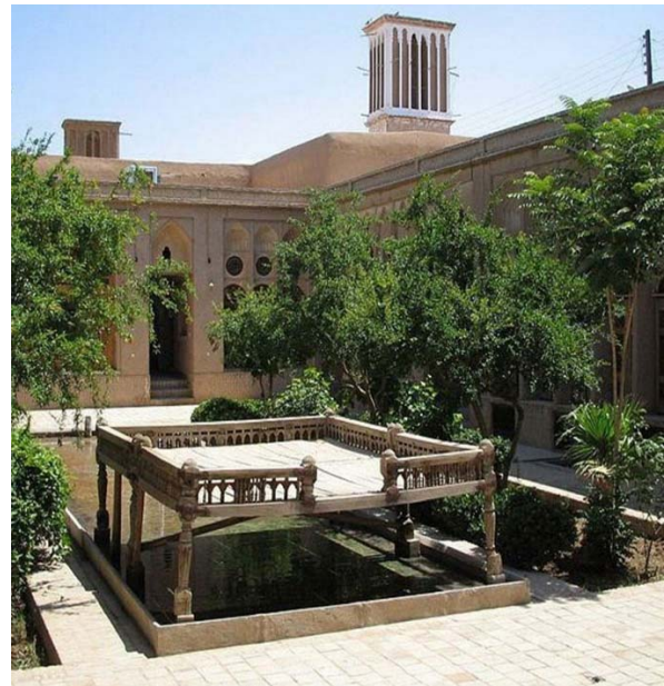
شکل ۱) خانه لاری‌ها، یزد، ایران