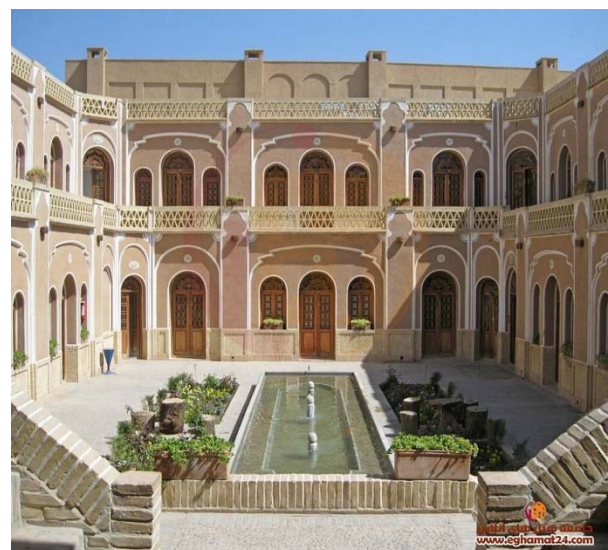
شکل ۲) خانه رسولیان، یزد، ایران

مجموعه‌های شهری و روستایی در یزد فشرده و متراکم است که از نفوذ گرمای تابشی به داخل مجموعه جلوگیری می‌کند. جان‌پناه بلند بام‌ها علاوه بر این که خانه‌ها را از انظار محفوظ می‌دارد و مانع مناسبی است در مقابل باد نامطلوب، روی بام‌ها و کوچه‌ها سایه می‌اندازد و کوچه‌ها و حیاط‌ها را گودتر می‌کنند. این بسته‌بودن، گود و پرسایه‌بودن، تماس مجموعه را با گرمای خارج کم می‌کند. در اقلیم یزد فرم پلان فشرده است تا سطوح کمتری در مقابل خورشید باشد.