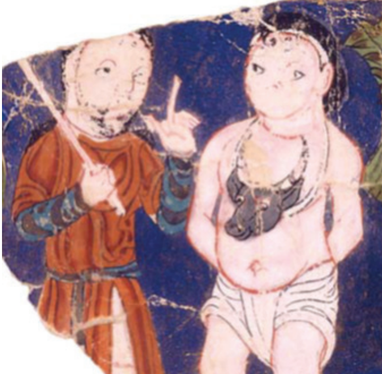
MIK III 4959 verso)