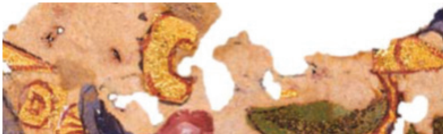
,(?)MIK III 6258b recto