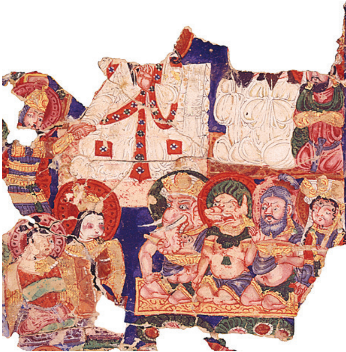
MIK III 4979 recto