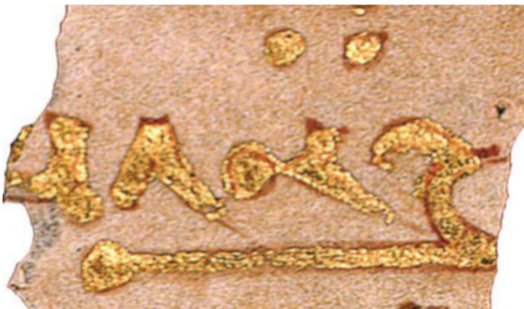
MIK III 4969

نوع دیگری از جلوه نور در هنر مانوی در هاله‌های نوری است که در برخی نگارگری‌ها دور سر افراد دیده می‌شود. در برخی تصاویر برگزیدگان (گروهی برتر از دینداران مانوی) با یک هاله نورانی در اطراف سرشان متمایز شده‌اند، این هاله گاه گرد ایزدان مانوی و حتی ارتشتاران نیز دیده می‌شود (گولاچی، ۲۰۰۵: ۲۷-۲۹). البته هاله مقدس دور سر افراد مختص مانویت نبوده و جلوه‌های آن در دیگر دین‌ها از جمله اسلام، میترائیسم،