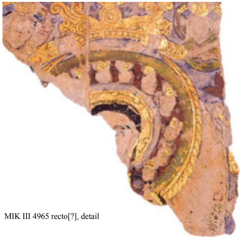
MIK III 4965 recto[?], detail