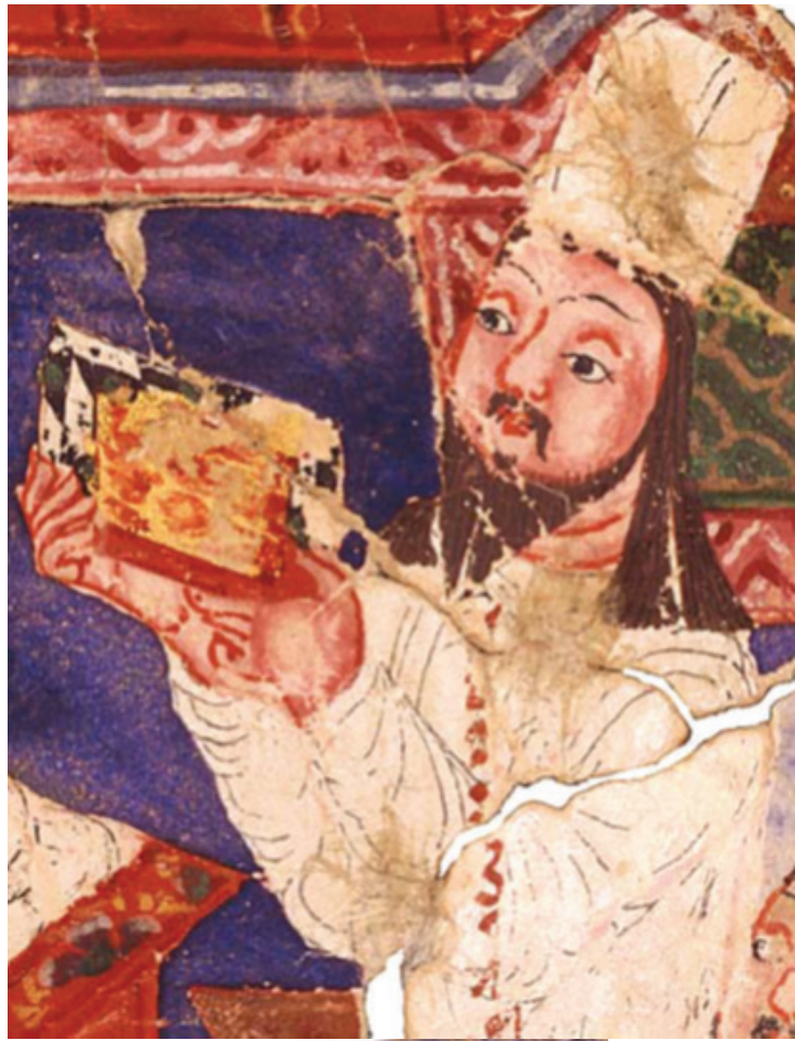
,MIK III 4979 verso

.....وجوه حکمی مانویت و تأثیر آن بر هنر مانوی