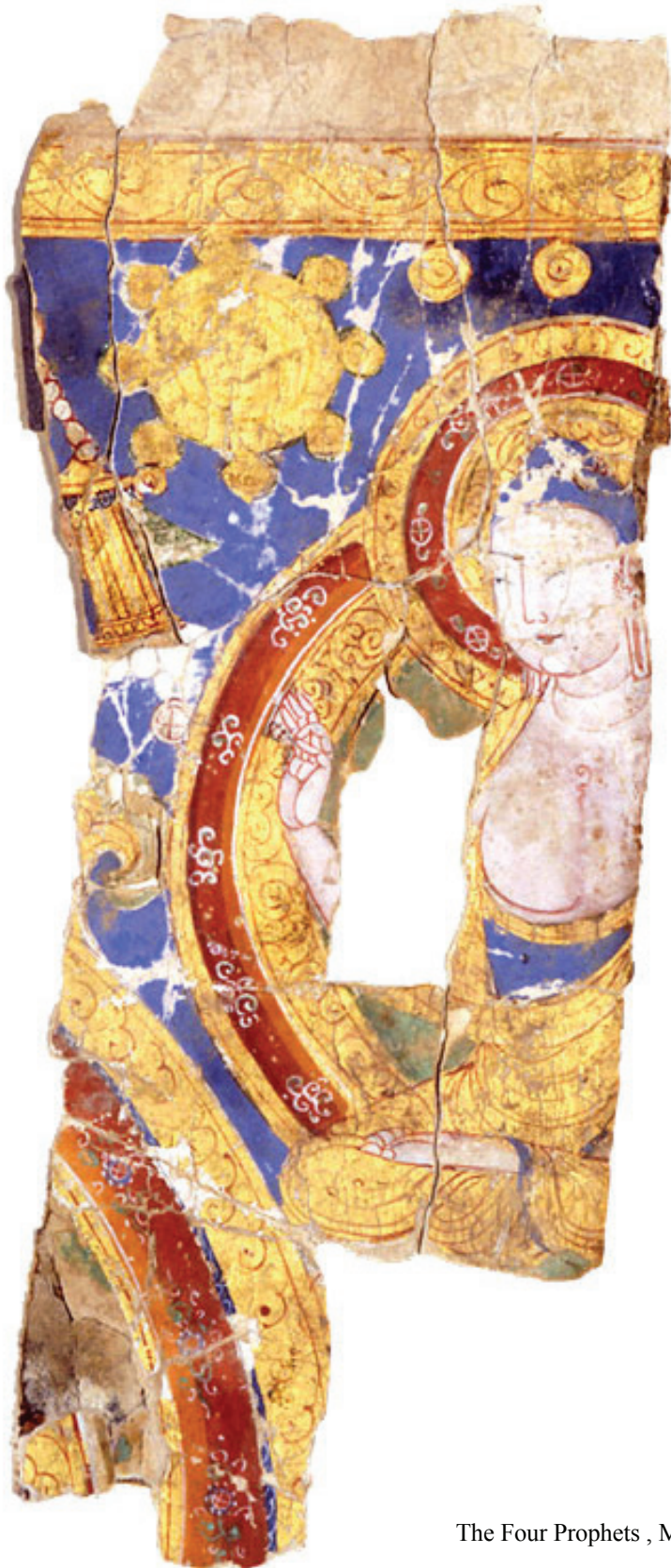
The Four Prophets , MIK III 4947 & III 5 d, detail