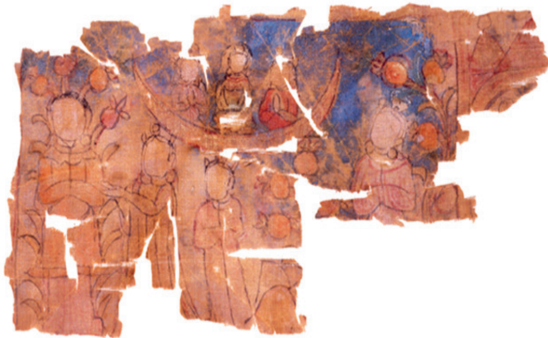
Deities of Earth and Moon Scene (H: 10.4 cm, W: 20.3 cm). Fragment of a Turfan Manichaean Textile Display; SMPK, Museum für Indische Kunst (Berlin), MIK III 6278