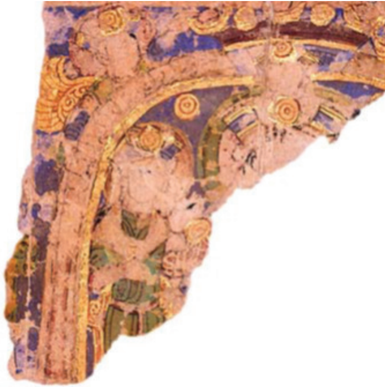
MIK III 4965 verso[?], detail)