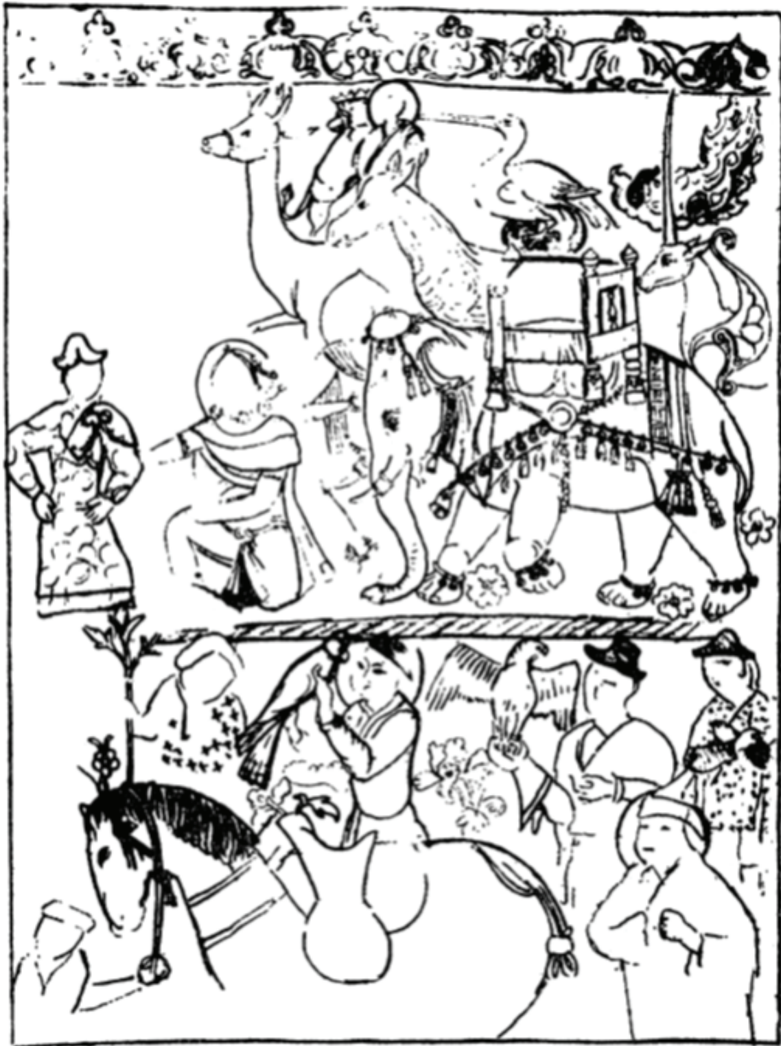
Outline of a Miniature from MS. H. 2152 Topkapi Museum