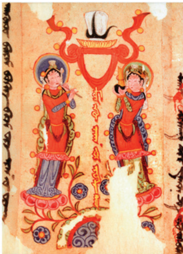
Pictorial insert of a scroll shown from picture-viewing direction (H: ca. 26 cm). Detail of a Turfan Manichaean Illuminated Scroll; Turfan Antiquarian Bureau (Turfan, China), 81 TB 65:01

الهی، محبوبه. (۱۳۸۱)، هاله: تقدس و معنا از ایران باستان تا کنون، پایان‌نامه کارشناسی ارشد، دانشکده هنر، دانشگاه شاهد.