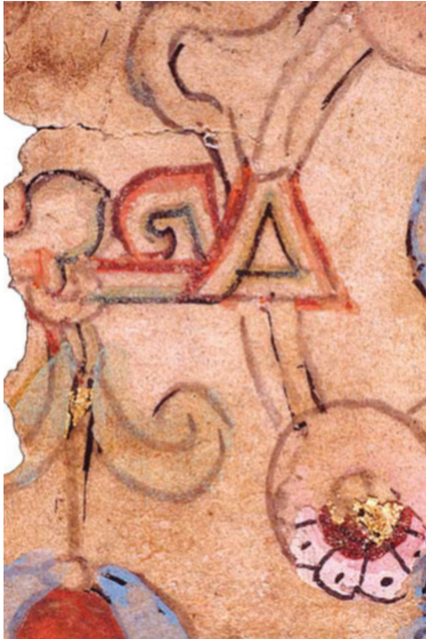
(?) MIK III 4969 outer side