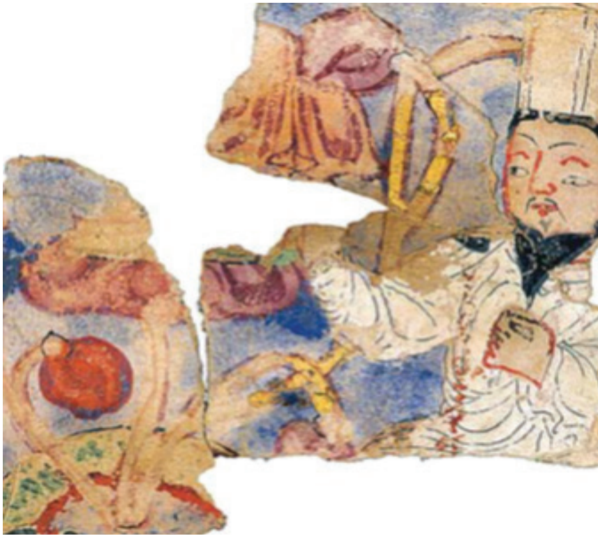
Sermon (MIK III 6256 & III 4966 c recto, detail)