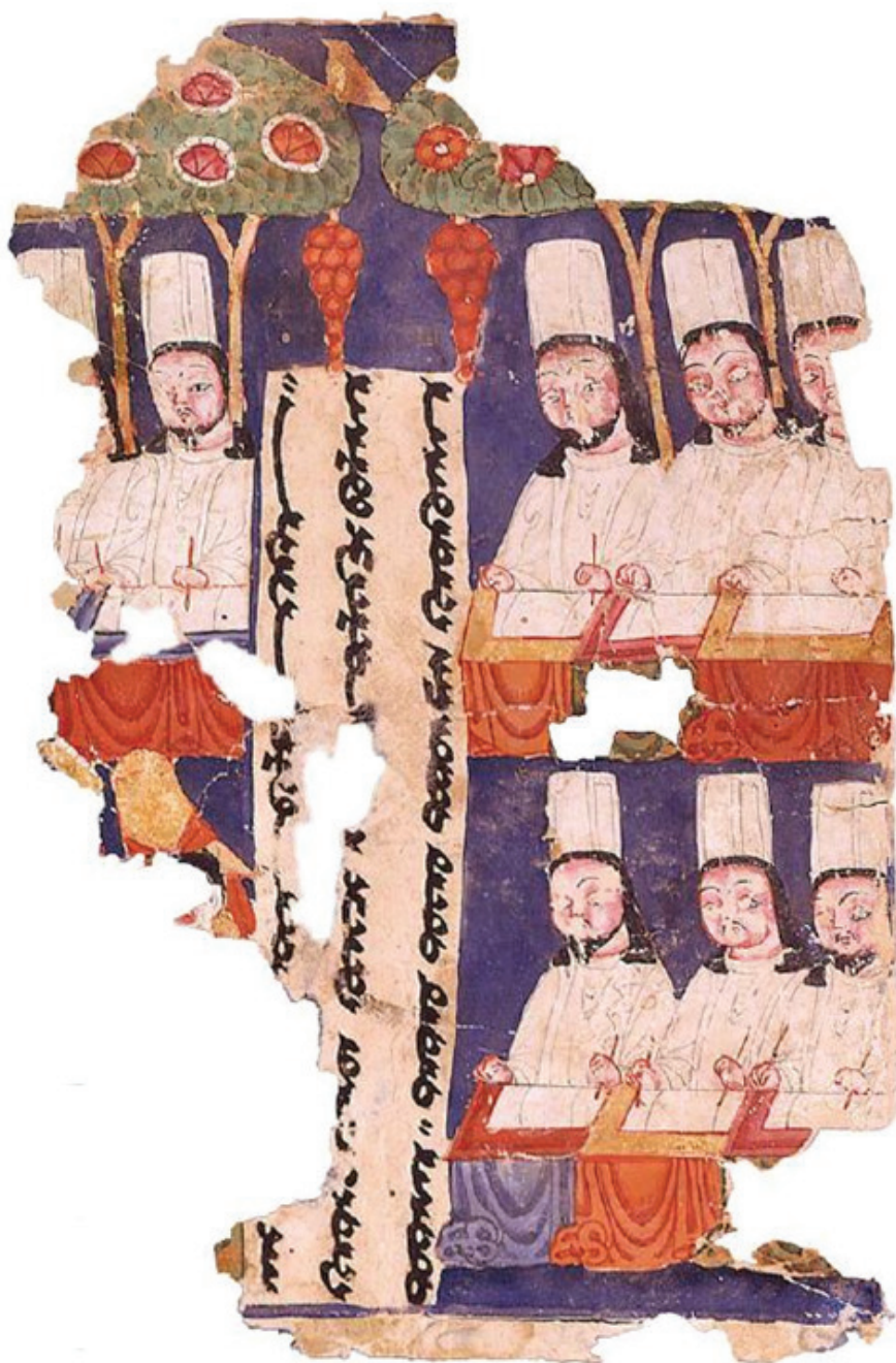
MIK III 6368 recto

آسمان و پاکی آن را یادآوری کند. غلبه رنگ آبی در هنر (احتمالاً از هنر مانوی) در هنر دوره‌های دیگر نیز نفوذ کرد، به عنوان مثال در هنر اسلامی نیز استفاده فراوان از رنگ آبی و به‌کارگیری آن به عنوان پس‌زمینه رواج یافت و حتی از کتاب‌آرایی وارد دیگر هنرها نیز شد (نک: کتاب بررسی هنر مانوی؛ با تکیه بر تأثیر هنر