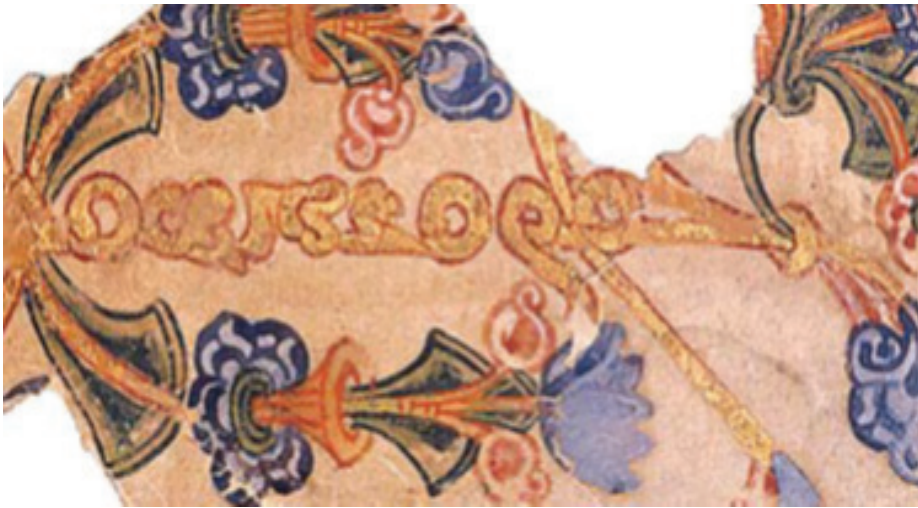
MIK III4983 recto