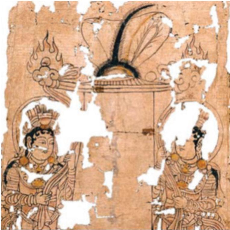
MIK III 4614, detail