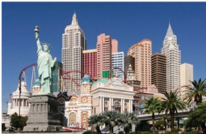
تصویر ۴.

دوم] در پیوند با گذشته و در ارتباط با غرب خاصیتی انتخاب‌گر دارد» (همان، ۶۰). در معماری دوره پهلوی اول به دلایل گوناگون به معماری گذشته ایران همچون هخامنشی و ساسانی توجه ویژه‌ای گردید و «به نوعی یک انتخاب عقلانی در [معماری] آن‌ها صورت گرفته است» (همان، ۶۱) که البته شایان توجه است که استفاده از عناصر معماری گذشته در این دوره نمی‌تواند تنها دلیل الصاق برجسب کیچ به این‌گونه پروژه‌ها قرار گیرد.