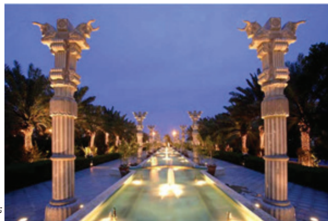
تصویر ۸.