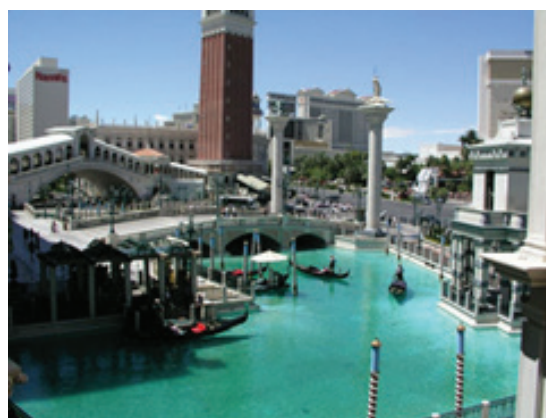
تصویر ۱.

علاوه بر نمود بیرونی کیچ در غالب معماری این پدیده در عرصه‌های مختلف (فرهنگی، اجتماعی، اقتصادی، سیاسی، هنر و ...) و با رویکردهای گوناگون به صورت تخصصی بارها، موضوع تحقیق قرار گرفته شده که اشاره به آن‌ها پژوهشی دیگر طلب می‌نماید ۳۹ .