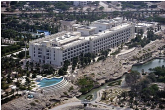
تصویر ۶. www.dariushgrandhotel.com