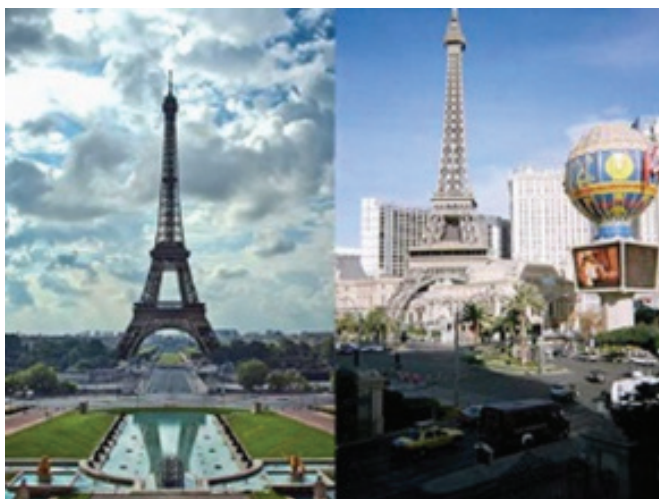
تصویر ۵.