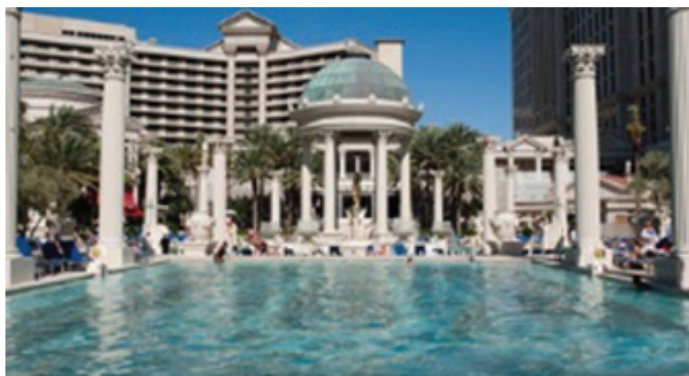
تصویر ۲.

معماری کیچ به‌عنوان نمود فرهنگ توده، بصورت بارز و گاه کم‌رنگ‌تر در دوره‌های مختلف و در اکثر کشورها نمود بیرونی یافته است ولی تسلط این پدیده را به وضوح می‌توان در آمریکا و شهر لاس وگاس مشاهده نمود، شهری که مستفاد مقاله‌ای از «کلارا ایرازابل» ۳۳ تحت عنوان «کیچ مرده است، زنده باد کیچ: خلق فراقیچ» ۳۴ در لاس وگاس ۳۵ به آفرینش پدیده‌ای اشاره می‌شود به نام «فراقیچ» که آن را حاصل فرهنگ مصرفی و لذت‌گرایی نظام سرمایه‌داری غرب می‌داند و با در نظر گرفتن فراواقعیت‌ها ۳۶ و کیچ این گونه تعریف