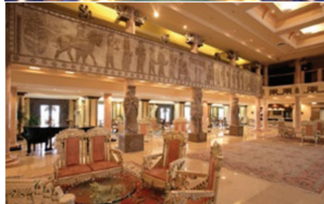
تصویر ۹. www.kishsafar.com