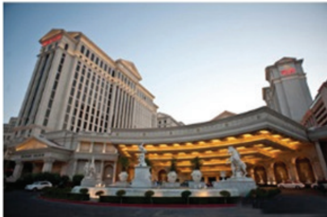
تصویر ۳. www.oyster.com

جمهوری اسلامی: اما معماری دوران جمهوری اسلامی، بسیار با ذائقه عامه همراه شد و در بسیاری موارد معماران، آثاری را خلق نمودند که اکثر پارامترهای معماری کیچ در آن‌ها قابل مشاهده است که به نظر نویسندگان از دلایل عمده آن می‌توان به نقش رسانه‌ها در