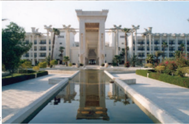
تصویر ۷.