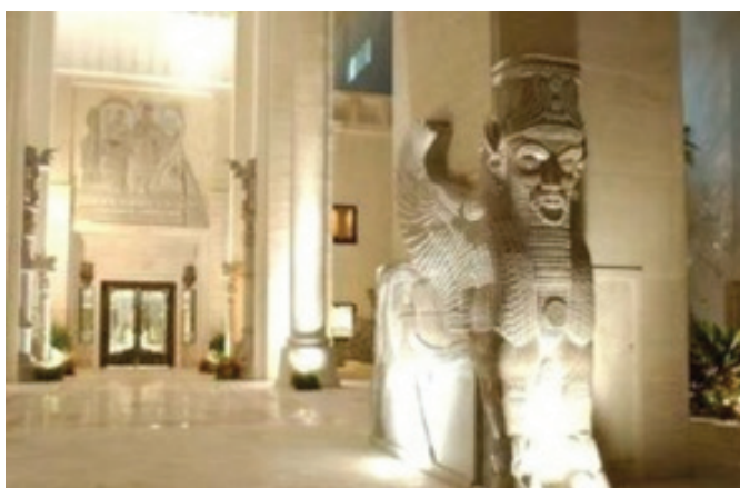
تصویر ۱۱. www.esfandiari.iiiwe.com