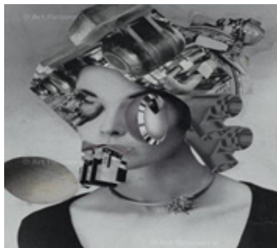
تصویر ۷. پیکابیا، مادام پیکابیا (۱۹۵۹)، فتوکولاژ بر مقوا، ۲۴ * ۵/۳۱ سانتیمتر. موزه ملی هنر مدرن، مرکز ژرژ پوپمیدو، پاریس. (Url3)

انسانی بازمی‌گردد که نتوانسته با متن تکنولوژیک ارتباط برقرار و درکی از زبان ماشین پیدا کند یا به ماشین بازمی‌گردد که به درستی به جهان ارجاع نمی‌دهد یا سرآخر به جهان ختم می‌شود که دیگر آن جهان گذشته نیست. (تصویر ۶) متن این آثار جنجال برانگیز و برای مخاطب آنچنان غریب است که جز در مواردی اندک، موفق به کشف آنچه که متن بدان اشاره می‌کند نمی‌شود. تلاش بیشتری جهت تفسیر و تأویل این متن نیاز است تا بتوان به عالمی دست یافت که متن در خود حمل می‌کند. متون هنری این دوره که به زبان ماشین نوشته شدند، بسیار تمثیلی هستند که صرفاً برای سرگرمی عوام داستانی ساده و روان را روایت نمی‌کنند. هنر، بیان جدیدی را می‌طلبد زیرا نحوه روی‌آوردگی انسان به جهان و به دنبال آن، ذات‌دهی و معنابخشی انسان به جهان، واسطه‌ای به نام ماشین یافته است. (تصویر ۴-۱۶) تکنولوژی‌های قابل خواندن (یا خواندنی) به دنبال بسط گنجایش‌های هرمنوتیکی و زبان‌شناسانه مخاطب به واسطه ابزار هستند.