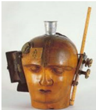
تصویر ۴. رائول هاسمن، سر مکانیکی یا روح زمانه ما (۱۹۲۰)، چرخ دنده، قاب چرمی، لوله، طوماری از نقاشی شخصیت‌ها، مقوای سفید با شماره ۲۲، ۲۰ * ۲۱ * ۳۲/۵ سانتیمتر. موزه ملی هنر مدرن، مرکز ژرژ پمپیدو، پاریس. (Url 3)

می‌دهند. ابزار متصل به قوای احساسی است. بنابراین انسان و ابزار با هم جهان را ادراک می‌کنند. همچنین نسبت تجسد انسان و تکنولوژی در آثاری که بر کاربرد ماشین تأکید دارند نیز دیده می‌شود. قدرت بیومکانیک‌ها چنان مورد توجه بود که حتی زیبایی انسان در تطابق جسم او با امور کاربردی‌ای که ماشین به راحتی می‌توانست انجام دهد تبلور یافت (تصویر ۲). ماشین‌های کشاورزی که ورتوف به آنها اشاره می‌کند، ۴۴ آنچنان‌اند که گویی به قوای کشاورز و به بدن او امتداد می‌بخشند. کاری که ماشین کشاورزی می‌کند شاید معادل کار روزها یا هفته‌های یک کشاورز باشد. اما کشاورز مجهز شده به ماشین کشاورز قدرتمندی است. پاهای او پرتوان تر، دستان او بلندتر و قویتر و نیروی او هزاران برابر شده است. فرنان لژه ۴۵ نیز در دوره‌ای از آثارش بیومکانیک‌ها را ترسیم می‌کند. در این دسته از آثار، اجزای بدن انسان مانند لوله و سیلندر بازنمایی شده‌اند (تصویر ۳). اینجا، زیباشناسی قدرت و توان دیده می‌شود. آنچه زیباست، آن چیزی است که مقاوم و پرتوان است. این آثار نشان می‌دهند انسان عصر جدید مقاوم و پرتوان است زیرا اجزا و حواسش با ماشین وحدت یافته‌اند: اندام‌ها ماشینی شدند و ماشین‌ها انداموار. اکنون دیگر طبیعت همراه با ابزار کشف می‌شود. در نظر کانستراکتیویست‌ها چیزی مثبت است که در کنار انسان کاری را انجام می‌دهد. بدین دلیل، یکی از جنبه‌های فرمی ماشین به لحاظ زیباشناختی این است که حتی اگر وجه کاربردی نداشته باشد بر زیبایی صورت‌های تکنولوژی تأکید