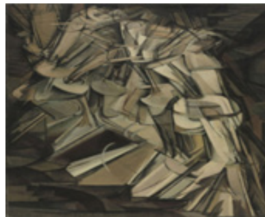
تصویر ۱۱. مارسل دوشان، پلکان (۱۹۱۲)، چاپ ژلاتینی نقره‌ای، ۱۸/۱ * ۲۴/۸ سانتیمتر (۷ ۱/۸ * ۹ ۳/۴ اینچ). موزه هنرهای معاصر نیویورک، نیویورک. (Url 17)

جهت یادآوری جایگاه ماشین، که اکنون فراتر از شیء صرف است و همانطور که در زندگی حضور مؤثر و غیرخنثی دارد، مشخصاً جای بیشتری را در آثار انتقادی اشغال می‌کند. با پیشرفت عصر تکنولوژی‌های مدرن، ماشین به تدریج به خالق خود نزدیک می‌شد. (تصویر ۱۰) از طرفی حس پدر-فرزندی که انسان به ماشین دارد و از طرفی شباهتی موروثی که خود بدان اهدا کرده سبب می‌شود انسان جذب او و محو تماشايش شود. بدین ترتیب، مطابق با ساختار افزایشی-کاهشی که آیدی در نسبت انسان و تکنولوژی مطرح می‌کند و سنگینی بار افزایشی آن و نیز فراموشی تقلیل‌ها و کاستی‌ها، ماشین در نسبت غیریت در جایگاه بالایی قرار می‌گیرد؛ زیرا آنچه شبیه به انسان است برای او جذاب است از این‌رو جنبه‌های کاهشی آن کمتر توجهش را جلب می‌کنند. ترسیم وحدت انسان و ماشین یا نزدیکی این‌دو، میان جنبش‌های آوانگارد مشترک است. می‌توان در آثار هنری آن سال‌ها صورت‌مناظری برای آنچه که اکنون به نام ربات یا سایبورگ یا ماشین‌هایی با قوه تفکر و هوش مصنوعی شناخته می‌شوند، یافت.