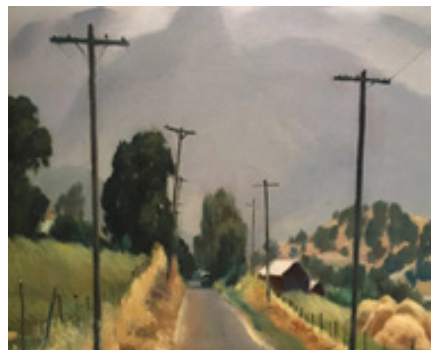
تصویر ۱۵. امیل کوزا، راندن در طول جاده قدیمی (۱۹۴۰)، رنگ و روغن روی بوم، ۶۳/۵ * ۷۲/۲ سانتیمتر. مجموعه خصوصی در کانتیکت. (Url 1)