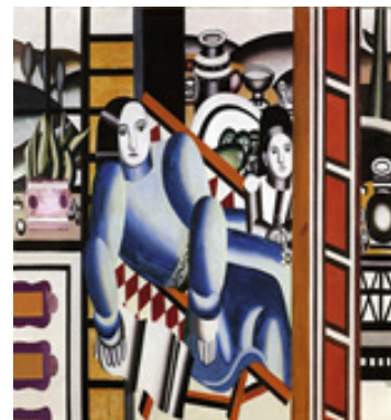
تصویر ۳. فرنان لژه، مادر و فرزند (۱۹۲۲)، رنگ و روغن بر روی بوم، ۱۷۱/۲ * ۲۴۰/۹ سانتیمتر. موزه کانست، پازل. (Url 10)

می‌دهند. ابزار متصل به قوای احساسی است. بنابراین انسان و ابزار با هم جهان را ادراک می‌کنند. همچنین نسبت تجسد انسان و تکنولوژی در آثاری که بر کاربرد ماشین تأکید دارند نیز دیده می‌شود. قدرت بیومکانیک‌ها چنان مورد توجه بود که حتی زیبایی انسان در تطابق جسم او با امور کاربردی‌ای که ماشین به راحتی می‌توانست انجام دهد تبلور یافت (تصویر ۲). ماشین‌های کشاورزی که ورتوف به آنها اشاره می‌کند، ۴۴ آنچنان‌اند که گویی به قوای کشاورز و به بدن او امتداد می‌بخشند. کاری که ماشین کشاورزی می‌کند شاید معادل کار روزها یا هفته‌های یک کشاورز باشد. اما کشاورز مجهز شده به ماشین کشاورز قدرتمندی است. پاهای او پرتوان تر، دستان او بلندتر و قویتر و نیروی او هزاران برابر شده است. فرنان لژه ۴۵ نیز در دوره‌ای از آثارش بیومکانیک‌ها را ترسیم می‌کند. در این دسته از آثار، اجزای بدن انسان مانند لوله و سیلندر بازنمایی شده‌اند (تصویر ۳). اینجا، زیباشناسی قدرت و توان دیده می‌شود. آنچه زیباست، آن چیزی است که مقاوم و پرتوان است. این آثار نشان می‌دهند انسان عصر جدید مقاوم و پرتوان است زیرا اجزا و حواسش با ماشین وحدت یافته‌اند: اندام‌ها ماشینی شدند و ماشین‌ها انداموار. اکنون دیگر طبیعت همراه با ابزار کشف می‌شود. در نظر کانستراکتیویست‌ها چیزی مثبت است که در کنار انسان کاری را انجام می‌دهد. بدین دلیل، یکی از جنبه‌های فرمی ماشین به لحاظ زیباشناختی این است که حتی اگر وجه کاربردی نداشته باشد بر زیبایی صورت‌های تکنولوژی تأکید