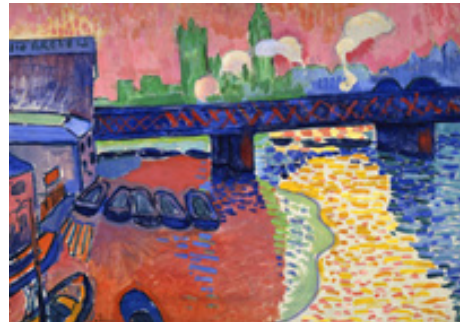
تصویر ۱۳. آندره دورن، پل چرینگ (۱۹۰۶)، رنگ و روغن بر روی بوم، ۱۰۶/۷ * ۱۲۵/۷ سانتیمتر. گالری ملی لندن، ساختمان هنر شرق. (Url 20)