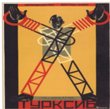
تصویر ۱. اس. سمونوف، نام اثر: پوستر فیلم ترکسیب ساخته ویکتور تورین (۱۹۲۹)، طراحی گرافیکی پوستر، ۲۹ * ۴۱ سانتیمتر. موزه گراد، مسکو. (Url 1)

کوتاه‌تر بلکه زمان را نیز به حداقل ممکن می‌رساند درخور تحسین است. از این‌رو، شجاعت، جسارت و بی‌پروایی فوتوریسم از تکیه بر توانایی‌ها و قابلیت‌هایی برمی‌خیزد که ماشین به انسان می‌دهد. نزد آنها گسست رادیکال از گذشته و عشق و امید به آینده در همنشینی با ماشین رخ می‌دهد. ماشین در کارخانه، دستان انسان را بسط می‌دهد، پاهای او را در حرکت بلندتر می‌کند، پشت او را برای بلند کردن و تحمل اجسام سنگین قوی می‌کند. همچنین، چشمان انسان را برای دید دور یا چیزهای کوچک تیزتر کرده و شنوایی او را قدرت می‌بخشد. به طور خلاصه کیفیت زیباشناختی ماشین نزد تکنیک‌گرایان حرکت سریع و بی‌پایان ماشین‌های کارخانجات و انجام کارهای سنگین است که در قدرت و توانایی انسان نیست بلکه به کمک ماشین انجام می‌شود. بنابراین نسبت تجسد در بسیاری از آثار هنری زمانی آشکار می‌شود که ماشین به تنهایی ابژه مورد نظر نیست بلکه به جای بدن انسان نشسته و واسطه انسان در تجربه چیزی است. «تکنولوژی در اینجا ابژه-مانند نیست بلکه واسطه و میانجی تجربه است، نه ابژه تجربه شده» (Ihde, 2009: 42 & 72). پیروزی و موفقیت انسان در برابر نیروهای طبیعت به همین همبستگی و امتزاجی که میان بدن انسان و ماشین روی می‌دهد، به دست می‌آید. تلفیق بدن انسان و ماشین، در آثار آوانگاردها عنصری تکرار شونده است (تصویر ۱). در آثار کانستراکتیویست‌ها، که ماشین را میانجی تولید می‌دانستند، بخشی از بدن انسان را ماشین‌آلات تشکیل