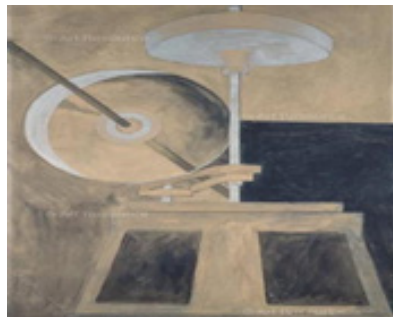
تصویر ۱۲. فرانسیس پیکابیا، دختر بدون مادر (۱۹۱۶) - (۱۹۱۷)، آبرنگ، گواش، جوهر هندی، ۳۵ * ۵۰ سانتیمتر. موزه ملی هنر، مرکز ژرژ پمپیدو، پاریس. (Url 3)