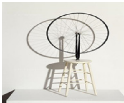
تصویر ۱۶. مارسل دوشان، چرخ دوچرخه (۱۹۱۳)، فلز و چوب رنگ شده، ۶۳/۵ * ۳۱/۵ * ۱۲۶/۵ سانتیمتر. موزه ملی هنر مدرن، مرکز ژرژ پومپیدو، پاریس. (Url 3)