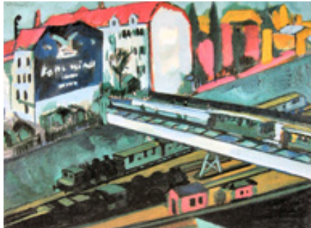
تصویر ۱۴. ارنست لودویگ کریشنر، پل راه آهن خط درسدن - لوتبرگ، رنگ و روغن روی بوم، ۸۱ * ۷۱ سانتیمتر. موزه باهوس، برلین. (Url 2)