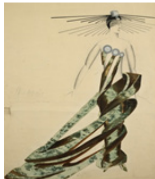
تصویر ۱۰. الکساندر اکستر، ملکه میخی (۱۹۲۴)، جوهر، گواش و مداد روی کاغذ، ۳۶/۲ * ۵۴ سانتیمتر (۱۴ ۱/۴ * ۲۱ ۱/۴ اینچ).