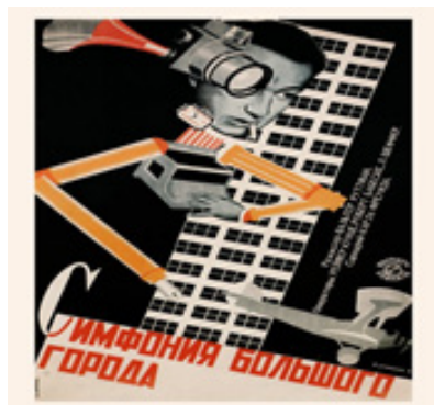
تصویر ۲. ولادیمیر و گئورگی استرنبرگ، پوستر فیلم سمفونی یک شهر بزرگ، ساخته والتر راتمن، (۱۹۲۸). لیتوگراف، ۶۹ * ۱۰۴ سانتیمتر (۱/۴ * ۲۷ * ۴۱ اینچ). کتابخانه ملی روسیه. (Url 21)