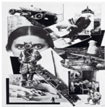
تصویر ۶. جورج گروز و جان هارتفیلد، زندگی و کار در شهر جهانی در ساعت ۱۲:۰۵ ظهر (۱۹۱۹) فوتومونتاژ. (Url 9)

داشته‌اند. آنها از شیوه تحلیل پدیدارشناسانه تکنولوژی که آیدی سال‌ها بعد مطرح کرد اطلاعی نداشتند اما قدرتمند شدن جسم را تجربه کردند. تجربه‌ای جذاب که جذابیت آن و تغییرات شگرفی که در نحوه تجربه به همراه دارد، به شکلی برجسته به چشم می‌آید. تجربه چیزها به نحوی جدید، آنچنان شیفتگی به بار می‌آورد که وجوه تقلیل‌گرای آن یا به بیان آیدی، جنبه‌های کاهشی آن کمتر مورد توجه قرار می‌گیرد یا حتی اصلاً به چشم نمی‌آیند. از منظر آیدی شیفتگی می‌تواند همراه با فراموشی باشد، که منظور از آن فراموشی خنثی نبودن بنیادی تکنولوژی است. این شیفتگی سبب می‌شود تا انسان فراموش کند که همواره در کنار هر تشدید و بزرگ‌نمایی که در تجربه انسان به واسطه تکنولوژی رخ می‌دهد، کاهش و تقلیل نیز حاضر است (Ihde, 1986: 110). در نسبت تجسد، بخشی از ادراک انسان قوی شده اما هم‌زمان بخش دیگری دچار ضعف می‌شود یعنی همان مفهوم ساختار افزایشی - کاهشی و یا نسبت تقلیلی - تفصیلی که آیدی مطرح می‌کند. در هنر نیز آنچه برجسته می‌شود ساختار افزایشی نسبت تجسد یا حوزه انکشافی جدید است که کاربر را جذب و شیفته خود می‌کند. اما ساختار کاهشی یا همان نسبت تقلیلی، بیشتر میل به پنهان شدن دارد. وجه افزایشی نسبت تجسد و البته دیگر نسبت‌ها آن‌چنان کشش دارد که انسان کمتر متوجه ضعف ادراکاتی می‌شود که در نسبت تجسد قوت نیافتند. اگر قرار است که این دسته از آثار بر پایه نسبت تجسد تحلیل شوند، باید هر دو وجه