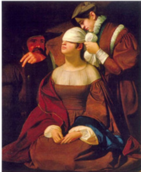
تصویر ۳. بانو گری آماده اعدام می‌شود، جورج وایتینگ فلگ ۱۸۳۵