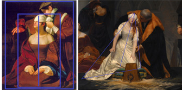
شکل ۱. نحوه استقرار پیکرها

نباید هیچ تفاوت بصری‌ای میان نگریستن به یک نقاشی و نگریستن از قاب پنجره به آن چیزی که آن نقاشی بازنمایی‌اش می‌کند وجود داشته باشد. (دانتو، ۱۳۹۳: ۱۷)