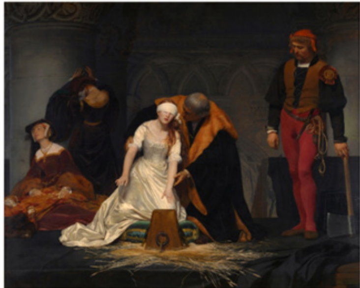
تصویر ۲. اعدام بانو جین گری، پل دلا روش ۱۸۲۳