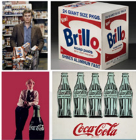
تصویر شماره ۱. وار هول و آثارش

می‌گیرد. امری که تبارشناسی آن نکات ماهوی را از چگونگی حضور پنهانی سرمایه مکشوف می‌نماید. از آنجا که هنرمند برای ارتزاق از هنر به گواه تاریخ، در اغلب موارد، ناکام بوده است، باید تمام چنددهه مفید عمر را در ناسازهای سپری کند که از یک سو تمایل به فردیت هنری و از دیگر سو تنگنای معاش محصورش نموده است پس در قبال سفارش بی‌چاره می‌ماند؛ فرهنگ صله‌گیری یعنی، اتصال مستقیم معشیت هنرمند به لایه نازکی از اجتماع که ثروت را در اختیاردارد.