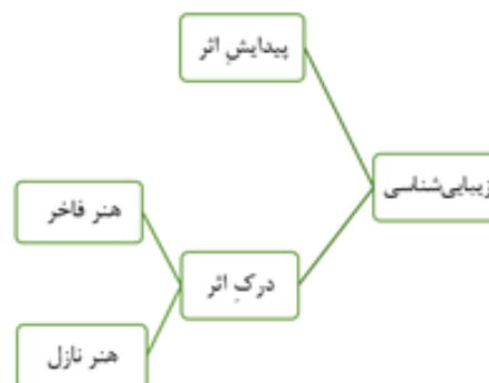
نمودار یک: گستره کلی مفهوم زیبایی‌شناسی