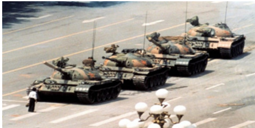
تصویر ۱. مرد معترض در میدان تیانمن در برابر رژه ارتش جمهوری خلق چین منبع: (Beaumont, 2019)

https://www.theguardian.com/world/2019/may/11/tank-man-photograph-tiananmen-square-30-years-jeff-widener