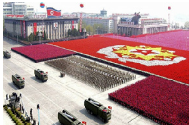
تصویر ع. تصویر سمت چپ عظمت و قدرت ارتش کره شمالی را نشان می‌دهد و تصویر سمت راست رنج مردم کره شمالی (Mark, 2020)

https://www.businessinsider.com/north-korea-secret-photos-2018-3