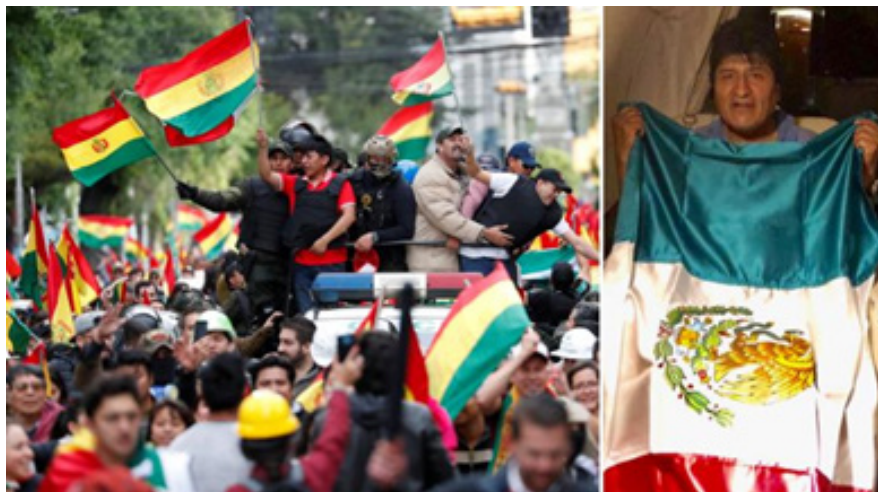
تصویر ۸. شورش‌های سال ۲۰۱۹ در بولیوی و فرار رئیس جمهوری این کشور به مکزیک منبع:

گزاره ساده خلاصه کرد. تصاویر و ابداعات بصری نه تنها به بازنمایی جهان می‌پردازند بلکه در انجام این کار بر پویایی سیاسی درک تصاویر تأثیر می‌گذارند. تصاویر و ابداعات بصری کارهایی را انجام می‌دهند. آنها به خودی خود نیروهای سیاسی هستند (Farrell and smith, 1968): 38) آنها به همان اندازه که سیاست را به تصویر می‌کشند به همان اندازه نیز به آن شکل می‌دهند. تکنیک‌های اولیه نقشه‌برداری نقش اساسی در مشروعیت بخشیدن به ظواهر دولت‌های سرزمینی و قلمرو تحت حاکمیت آنها داشته‌اند. فیلم‌های هالیوودی مدل‌های خوب و عمیقی از قهرمانان و تبه‌کاران را به ما ارائه می‌دهند تا جایی که آنها می‌توانند به ارزش‌های اجتماعی نیز شکل بدهند (Engle, 2012): 118-119) بمب‌گذاری تروریستی و انتحاری برای کشتن