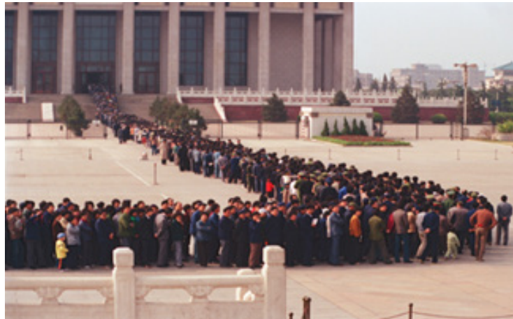
تصویر ۷. ادای احترام چینی‌ها به مائو در آرامگاهش در سالروز انقلاب خلق چین (Bleiker, 2018b)

افراد با حداکثر تأثیرات تصویری و دیداری طراحی شده است. هدف اساسی این تصاویر گسترش جهانی ادراک ترس است. در نظر بگیریید که چگونه تصاویر و ابداعات بصری باعث تجسم عملکردی می‌شوند و از نظر سیاسی حس هویت و اجتماع بودن را تقویت می‌کنند. پرچم‌ها، رژه‌ها، نمادهای مذهبی، بناهای تاریخی و مقبره‌ها بارزترین نمونه‌ها هستند (Rolling, 2007: 8). به آرامگاه