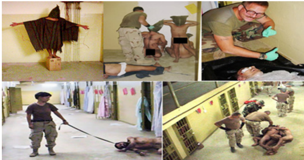
تصویر ۳. تصاویر شکنجه زندانی‌های اسلام‌گرا در زندان‌های مخفی توسط اعضای سی. آی. ای و ارتش ایالات متحده (Kinderman, 2006)

https://www.psychliverpool.co.uk/psychology-news/social/abu-ghraib-real-stanford-prison-experiment