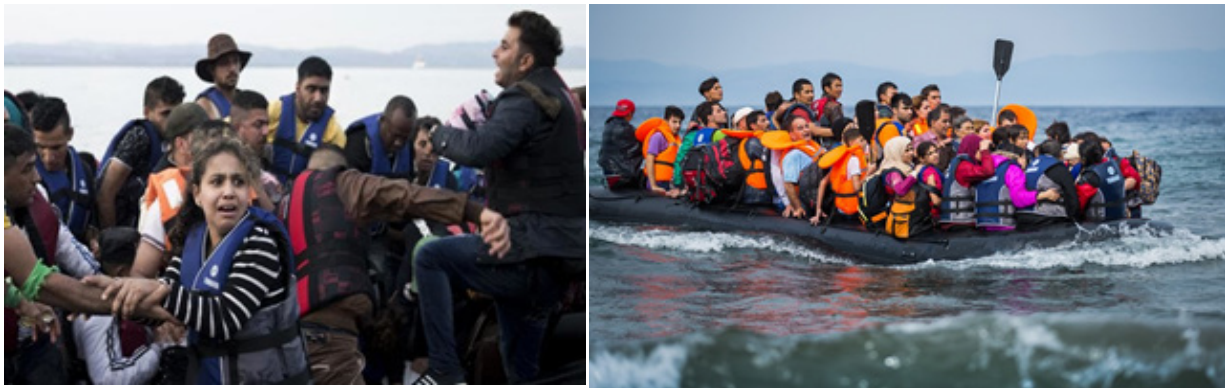
تصویر ۴. مهاجران خاورمیانه‌ای عازم استرالیا

مرحله اساسی را در ادراک سیاسی و زیبایی‌شناختی ابداعات بصری از جمله تصاویر و ارتباط آن با ساخت‌بندی مفهومی سیاست داخلی و جهانی مشخص کرده است. این سه مرحله می‌توانند ادراک مفهومی و سیاسی تصاویر را تسهیل یا دشوار کنند. این سه مرحله عبارتند از: