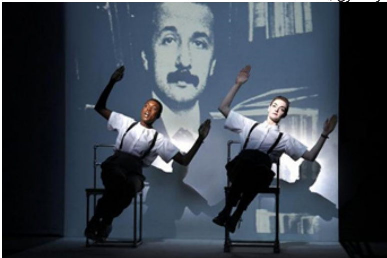
تصویر ۴: اینشتین در ساحل. نمایش‌های رابط ۲

در صحنهٔ قطار دو، پرسپکتیو از جلوبه عقب قطار تغییر کرده و این تخمین را به ذهن متبادر می‌کند که ویلسون روایت تازه‌ای را از تئوری نسبیت اینشتین، تحقق بخشیده است.