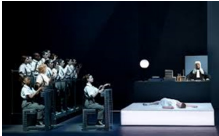
تصویر ۷: اینشتین در ساحل. محاکمه ۲

نقش انفجار برای لحظه‌ای ثابت می‌ماند و بعد دوباره بالا می‌رود. اجراگرها بر روی صندلی‌های سمت راست صحنه نشسته‌اند و شروع به تایپ می‌کنند. اتوبوس شبیه لوکومتیو از سمت چپ وارد می‌شود. نور تندی راننده را روشن می‌کند. زوج عاشق روی نیمکت پارک نشسته‌اند.