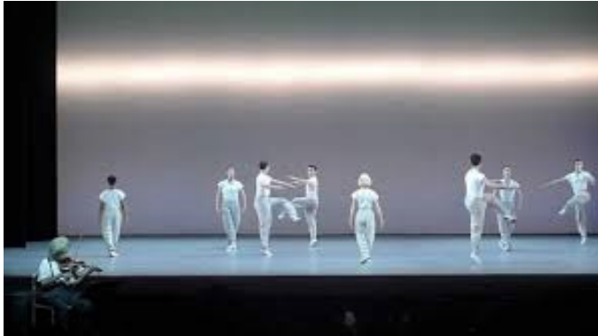
تصویر ۵: اینشتین در ساحل. محیط ۱

یکی از پنجره‌های بالایی آن روی کاغذ چیزی می‌نویسد. بیست و چهار اجراگر در صحنه هستند که اونیفورم اینشتین را بر تن دارند و به سمت روبرو خیره هستند. مرد بیرون می‌رود.