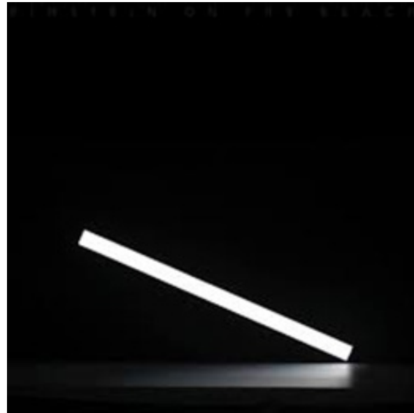
تصویر ۹: اینشتین در ساحل. محاکمه ۳

مکان و فضا در معماری و تئاتر با توجه به عنصر زمان و حرکت معنا می‌پذیرد. ترکیب مکان، زمان، نور، حرکت بازیگران و تمامی عناصر میزانشن بر روی صحنه فضا را می‌سازند.