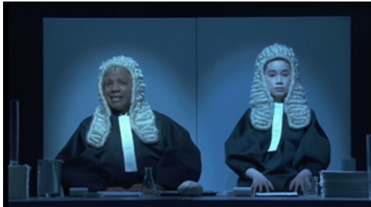
تصویر ۳: اینشتین در ساحل. محاکمه ۱

شکل دیگری از نی پلی یک. دو زن سیاه پوست و سفید پوست عقب صحنه هستند. در همان مربع سفید و روشن‌شان. اما این بار پشت‌شان به تماشاگران است. چهره گروه کر روشن می‌شود. طوری که انگار در نقطه شروع نمایش هستیم.