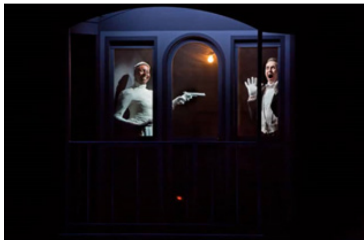
تصویر ۶: اینشتین در ساحل. قطار ۲

اجراگرها در تاریکی در تکاپو هستند. سپس نقاشی ساختمان عظیمی بر پرده پشت دیده می‌شود. مردی در