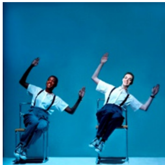
تصویر ۱: اینشتین در ساحل. نمایش‌های رابط ۱

شروع نمایش همراه با ورود تماشاگران اجرا می‌شود. دو زن یکی سیاه‌پوست و دیگری سفیدپوست، پشت میزهای مینی مالیستی، سمت چپ صحنه، داخل نور مربع شکل که بر روی پارچه سفید پشت سر آنها تابیده شده، نشستند. زن‌ها اعدادی را تصادفی حساب می‌کنند. اعضای گروه کر به آرامی وارد صحنه می‌شوند. نور روی بازیگران متمرکز می‌شود. کنش‌ها در این