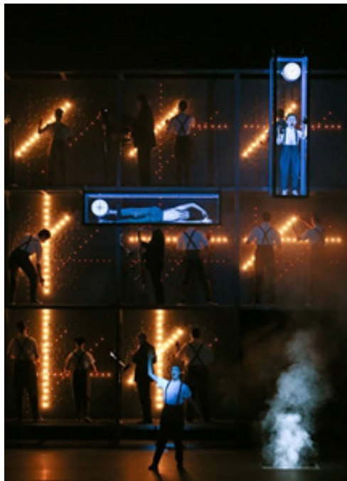
تصویر ۱۰: اینشتین در ساحل. محیط ۳، سفینه‌ی فضایی