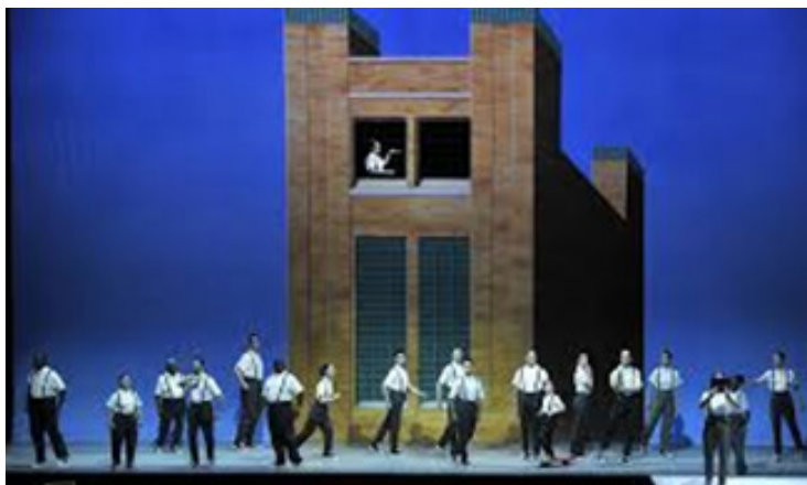
تصویر ۸: اینشتین در ساحل. قطار ۳

بنابه نظریه پدیدارشناسی نوربرگ شولتز، مکان معماری زمینه‌ای برای فعالیت‌های انسانی است و فضا به مثابه ظرفیست که وقایع در آن رخ می‌دهد، با کمک عامل زمان تجربه می‌شود و روایتی را بیان می‌کند.