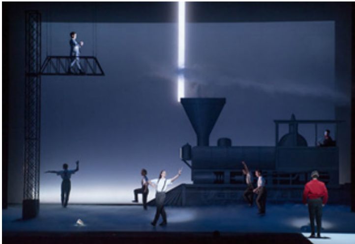
تصویر ۲: اینشتین در ساحل. قطار ۱

صحنه به صورت خیلی کند و در عرض بیست دقیقه صورت می‌پذیرد.