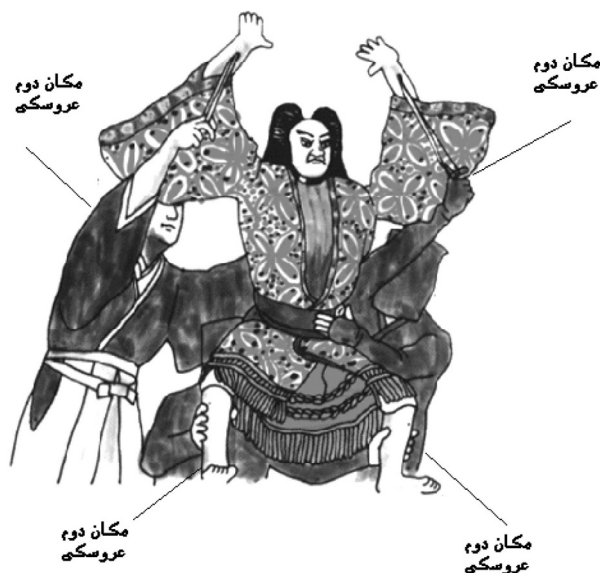
تصویر ۳: عروسک بونراکو یا سیاه

نوع دیگر عروسک‌ها با تکنیک سیاه یا بونراکو هستند. فضای دوم درست پشت سر و بدن عروسک قرار می‌گیرد.