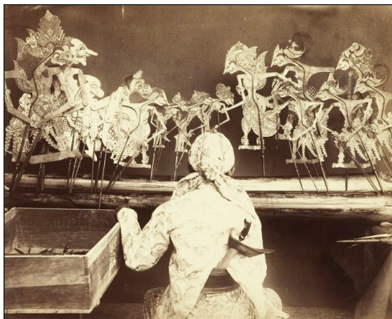
تصویر ۴: نمایش سایه‌ی اندونزی

مورد آخر عروسک‌های سایه هستند. در نمایش‌های سایه به سبب حذف بعد سوم، هم در تجسم مکان داستانی و هم در مکان دوم عروسکی شرایط متفاوتی وجود دارد. مکان‌های داستانی بر روی فضای دو بعدی پرده شکل می‌گیرند و همواره بعد سوم را برای تماشاگر خالی باقی می‌گذارند. اما در این نوع نمایش عروسکی مکان دوم وجود ندارد چرا که نمایش‌های سایه دنیایی وهم‌گون و تصویری سینمایی برای مخاطب ایجاد می‌کنند. به همین سبب جایی برای مکان دوم بر روی صحنه وجود ندارد. در تصویر ۴ نمایشگر عروسکی، منبع نوری و عروسک‌ها قابل رؤیت‌اند.