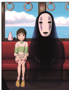
شبح نقاب دار: www.minitons.ir

۱-۶. روبه‌رو شدن با شبح نقاب‌دار؛ شبح نماد بخش سایه‌ی ۲۱ روان است. او غول حرص و طمع است که خویشتن خود را فراموش کرده است، می‌تواند به هر چیزی تبدیل بشود، از این روست که فقط نقاب است، نیروی ویژه‌ی غیرقابل انکاری است که باید او را به خاطر داشت و محدود کرد، زیرا «محدود کردن غارتگر ذاتی روح برای زنان ضروری است تا بتوانند تمام نیروهای غریزی خود را در کف اختیار بگیرند» (استس، ۱۳۹۰: ۵۶).