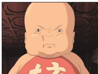
فرزند یوبابا: www.minitons.ir

۳-۱. شستن بد بوی بزرگ، چیهیرو کاری را انجام می‌دهد که بقیه از انجام آن فرار می‌کنند. چیهیرو با پاک کردن فضولات آن موجود، می‌فهمد او فرمانروای رودخانه بوده است و با تمیز شدنش ثروت زیادی نصیب آن‌ها می‌شود. «در نمادشناسی، مقادیر بزرگ آب، معرف مکانی است که گفته می‌شود خود زندگی از آن‌جا سرچشمه می‌گیرد» (استس، ۱۳۹۰: ۴۱۷)؛ پس رودخانه، جریان آزاد و حیات‌بخش است که خاک تشنه را تغذیه می‌کند و سبب رشد و نمو بذرها در آن می‌شود. «رودخانه زن وحشی ما را پرورش می‌دهد و بزرگ می‌کند: موجودی زندگی‌بخش. زمانی که ما خلق می‌کنیم، این موجود وحشی اسرارآمیز نیز به نوبه‌ی خود، ما را خلق می‌کند» (استس، ۱۳۹۰: ۴۱۱).