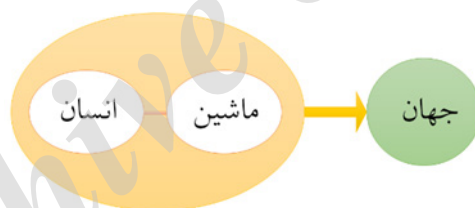
تصویر ۱. مدل اول دریافت سینما در پدیدارشناسی ویوین سوپچاک

سوپچاک انواع مدل‌های دریافتی مخاطب از جهان را در بخش تن فیلم تحلیل می‌کند، که اولین مدل، دریافت ابزارمحور تنانه ۱۳ است؛ در این نوع دریافت رابطه فیلم‌ساز با جهان به واسطه دوربین و رابطه تماشاگر با جهان به واسطه پروژکتور شکل می‌گیرد، در این نوع رابطه، اگرچه رابطه مستقیم با جهان، جای خود را به رابطه با واسطه می‌دهد ولی این دلیل بر غنی‌نبودن این رابطه نمی‌شود. برای مثال فیلم‌ساز تحت رابطه با واسطه دوربین خود، می‌تواند نقاطی از جهان را دریافت کند که در رابطه مستقیم حضور در آن نقاط و یا نزدیک شدن به آن، غیرممکن باشد و یا برای مثال دیگر، در رابطه تماشاگر با فیلم تحت واسطه پروژکتور، در هنگام دیدن گل بر روی پرده، اگرچه حس بویایی او غیرفعال است ولی در یک مکانیزم دریافتی حرکتی، می‌تواند تکامل گل از بذر تا حالت رشد یافته‌اش را در چند ثانیه دریافت کند. بنابراین این مدل از دریافت اگرچه در یک فاز ضعیف و در فاز دیگری غنی است، ولی به عنوان یکی از مدل‌های دریافتی دقیق و واقعی در زیر شاخه ارتباطات تنانه تکنولوژی می‌باشد.