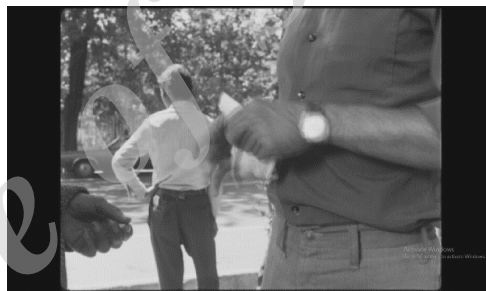
تصویر ۴ و ۵. سمت راست: برگرفته شده از فیلم مسافر ، سمت چپ: برگرفته شده از فیلم باد ما را خواهد برد

لوری لاندای معتقد بر عکس‌العمل نوروها در هنگام تماشای فیلم است، به طوری که هنگام تماشای فعالیت‌هایی نظیر رقص، حرکت، ورزش و ... روی پرده، علی‌الخصوص در شرایطی که خود مخاطب قبلاً آن‌ها را در زندگی واقعی تجربه کرده باشد، سلول‌های مغزی به همان شکلی پاسخ می‌دهند که در تجربه زنده و واقعی پاسخگویند؛ همچنین عصب‌شناس‌ها اظهار دارند ارتباط بین افراد که دلیلش بازتاب نرونهاست، زمینه‌ساز ایجاد ارتباط قوی و درک معنای یکسان بین آن‌ها می‌شود (Landay, 2012, 130-131)؛ و همچنین آنتونیو داماسیو ۱۸ از دیدگاه فیزیولوژیکی نیز ارتباط تنانه با فیلم را می‌شکافد او معتقد است، بسیاری از تغییرات فیزیولوژیکی (عضلانی و تغییرات درونی) در هنگام برخورد برگشت پذیر با فیلم و حتی هنگامی که موقعیتی را در ذهن خود متجسم می‌کنیم، حادث می‌شود (Linder, 2012, 205)؛ و اما آیا سینمای کیارستمی، این ارتباط قوی و درک معنای یکسان را بین تن تماشاگر و تن سینما جاری می‌سازد؟ با تکیه بر مدل سوم سوپچاک تماشاگر در یک رابطه تنانه با پروژکتور و رابطه هرمنوتیکی با دوربین فیلم‌ساز است که در سطور قبل به تأویل پذیری سینمای کیارستمی و موجودیت رابطه هرمنوتیکی تماشاگر با سینمای وی و تجربه آن به مثابه متن، اشاره نمودیم و اما در فاز بررسی ارتباط تنانه تماشاگر و فیلم، می‌توان به موجودیت فضای هاپتیکی و سعی در فعال‌نمودن سایر حس‌ها در این سینما اشاره نمود. برای مثال در فیلم اولی‌ها در صحنه‌ای از فیلم، ناظم گلی را در حیاط مدرسه در دست داشته و بچه‌ها در حال عبور در قالب صف از مقابل ناظم هستند که یکی از بچه‌ها از ناظم درخواست می‌کند که «آقا اجازه‌ست بو کنیم؟»؛ این جمله کوتاه در فعال‌سازی حس